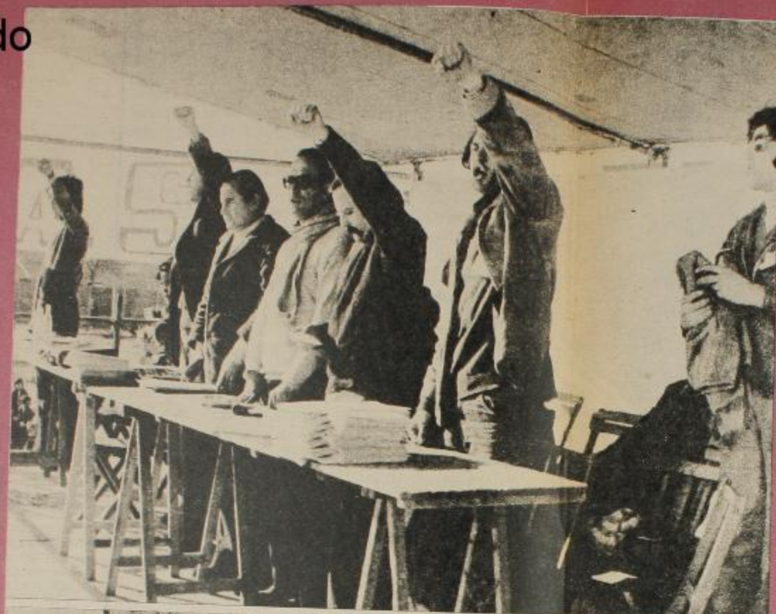
A la izquierda: El puño en alto, en los integrantes de la mesa permanente del F.A.S., prueban la indisoluble unión de los representantes de las bases con ellos, en la lucha por la liberación nacional y social de nuestra Patria.

N.H. — ¿Para vos éste es un gobierno popular?