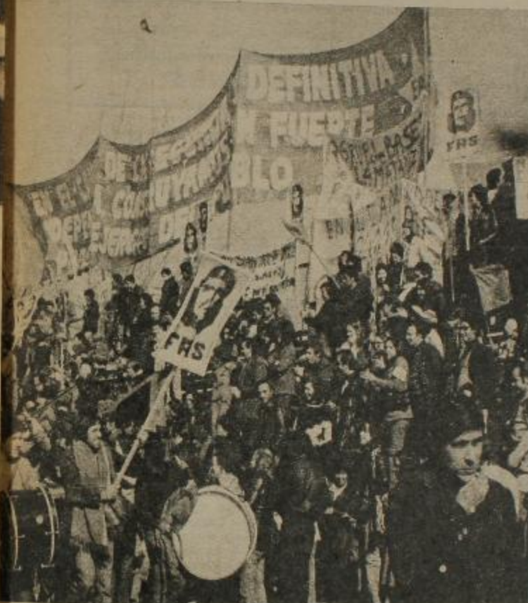
Desde distintos puntos del país, obreros y pueblo combativo demostraron en el 5º Congreso del F.A.S. su compromiso de luchar por una Patria Socialista comandados por el C.H.E.

de crear un Frente antifascista, antiburocrático, ¿cómo lo ves?