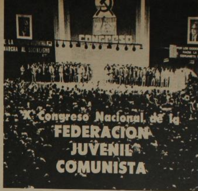
Congreso Nacional de la FEDERACION JUVENIL COMUNISTA