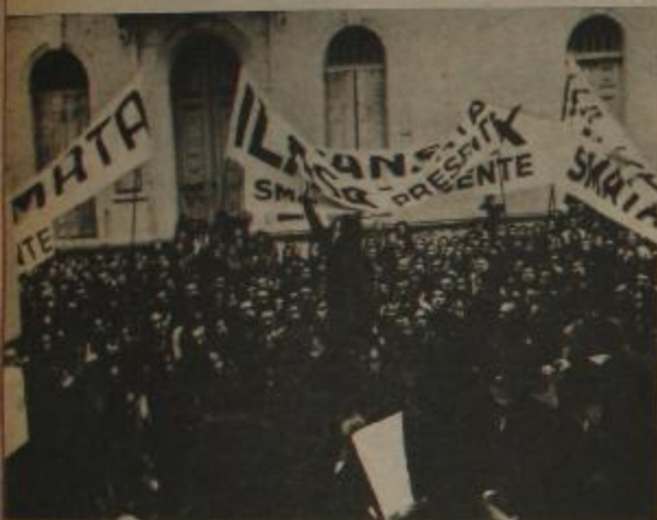
Asamblea del SMATA Córdoba: por la democracia sindical.

Todos los trabajadores sumaron una creciente indignación en el proceso posesionador en el SIM (I), Córdoba, en donde el clasismo infligió una gran derrota a la burocracia sindical, que se niega a reconocer el resultado de las elecciones en grosera violación de la democracia sindical. Los mecánicos cordobeses, a la vez que se preparan a defender su sindicato de las manobras de la burocracia, enfrentan a las patronales monopolistas de la industria automotriz con un justo pedido de aumento de salarios que deshace el ya maltrahado pacto del hambre. Y lo hacen de la única forma posible: movilizándose y ganando la calle para enfrentarse a sus enemigos.