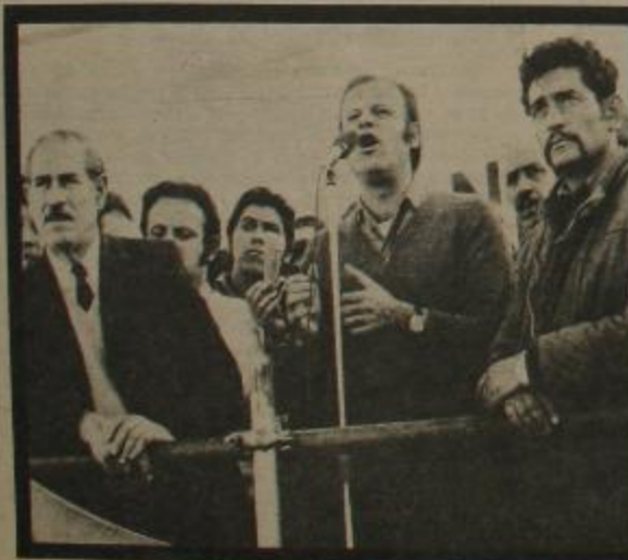
"Vea, vea, qué cosa más bonita: peronistas y marxistas por la patria socialista".