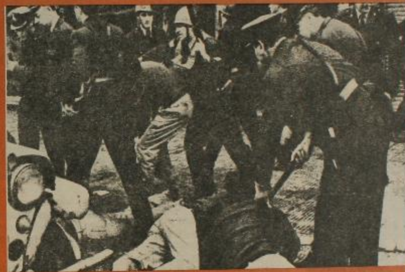
Esto ocurrió a un año del devotazo: represión a la JP en las cercanías de Devoto.

El 25 de mayo dos sectores del campo popular salieron separadamente a la calle para reclamar la libertad de los nuevos presos políticos, los del gobierno peronista. Uno fue convocado por COFAPPES en Congreso, bajo consignas de unidad. El otro, organizado por la Juventud Peronista, usó alternativas y vacilaciones en su convocatoria, como producto de la disconformidad de los compañeros que no intervinieron en su organización con la consigna sectorial de Libertad a los Presos Peronistas lanzada inicialmente, que al día siguiente fue transformada por la de Libertad a los Presos Populares. Pese a esto, las movilizaciones no llegaron a unificarse.