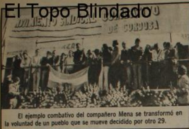
El ejemplo combativo del compañero Mena se transformó en la voluntad de un pueblo que se mueve decidido por otro 29.