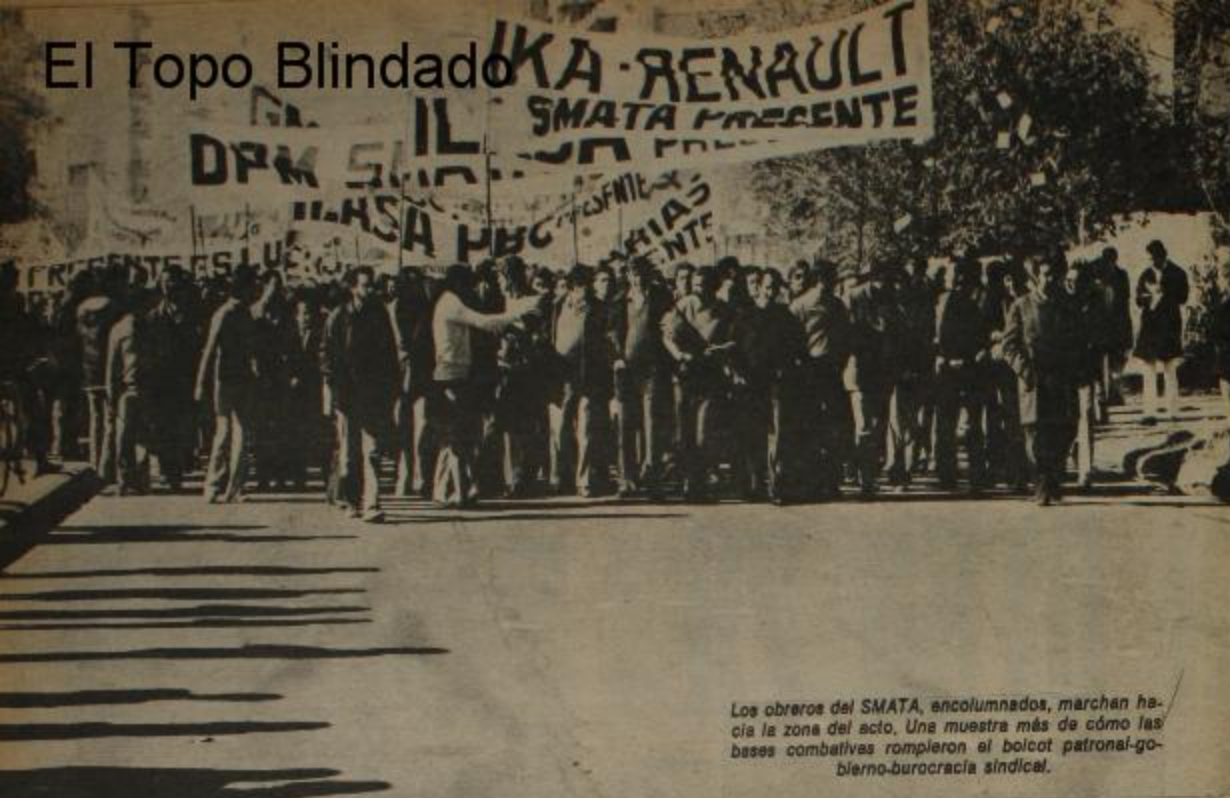
Los obreros del SMATA, encolumnados, marchan hacia la zona del acto. Una muestra más de cómo las bases combativas rompieron el boicot patronal-gobierno-burocracia sindical.

Dándole el carácter combativo al acto del 29 de mayo, una vez finalizado éste, se desprendió de la multitud una columna de 3.500 trabajadores que se dirigieron a la cárcel para exigir la libertad de los presos políticos. Los compañeros fueron recorriendo las calles de Córdoba al son de consignas combativas. Hablaban con la gente que en su conjunto apoyaban la marcha, de distintas formas, aplaudiendo, sumándose a la columna, comprando los periódicos revolucionarios, levantando las banderas argentinas con la estrella roja del socialismo, convidando agua a los integrantes de la columna y