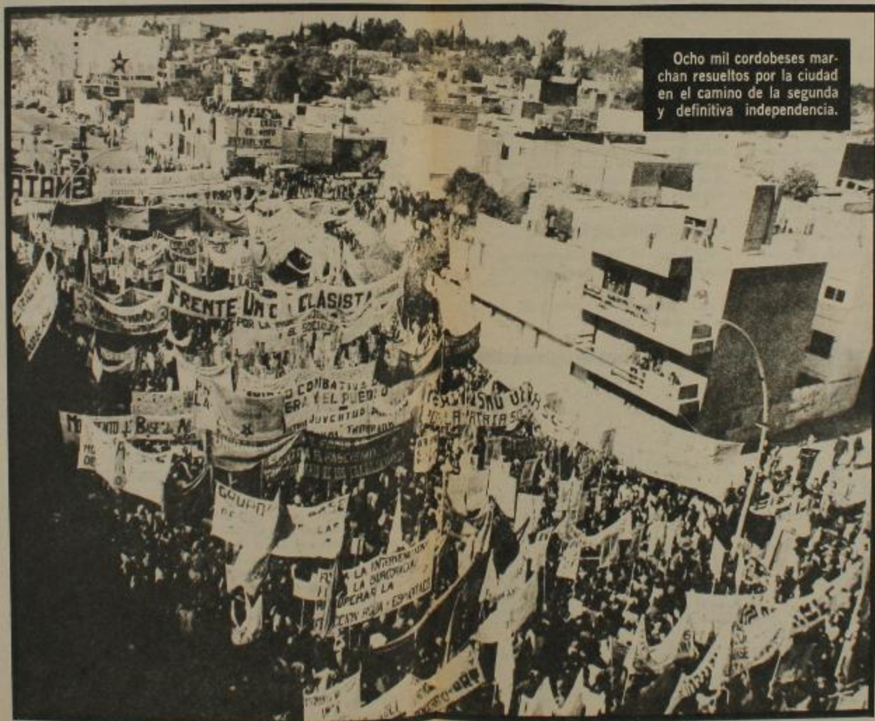
Ocho mil cordobeses marchan resueltos por la ciudad en el camino de la segunda y definitiva independencia.

ANTE el llamado del Movimiento Sindical Combativo, al acto del 29 de mayo, los distintos sectores integrantes y los partidos políticos y agrupaciones estudiantiles del campo del pueblo, se movilizan para concurrir a este llamado y para demostrar en los hechos que no será un acto recordatorio nada más, como el acto de la burocracia traidora de Bárcena o el oficial encabezado por Duilio Brunello, sino que será un acto combativo, comprometiéndose el proletariado cordobés y sus afiliados a seguir el camino abierto el 29 de mayo de 1969 en la escena política del país.