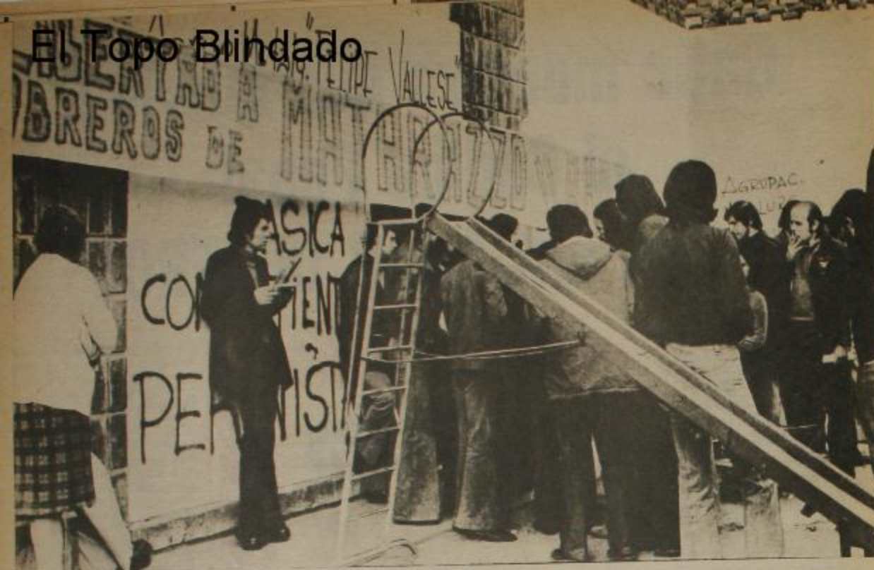
La libertad de los obreros de Matarazzo, prisioneros por el solo hecho de representar a las bases, no ser traidores y combatir por sus derechos indiscutibles, fue la consigna de sus compañeros, en las medidas de lucha realizadas.