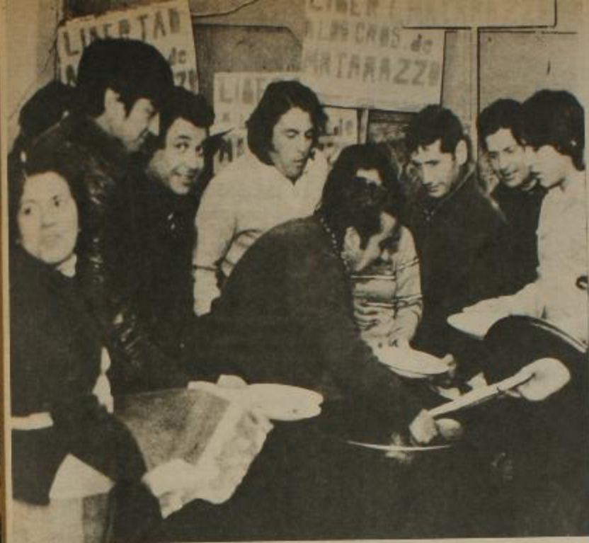
Los obreros de Matarazzo durante la olla popular. Unidad y combatividad contra la patronal, la burocracia sindical y la represión que se vale del nuevo Código Penal.

ta en que la asustadiza patronal concede casi todo lo que con justicia reclaman los compañeros (aumento de salarios, categorización del personal, guardería, etc.). Pero pronto la empresa trata de recuperar lo perdido y se niega a cumplir el convenio. El lunes 13 cuando los compañeros se dirigieron a su fuente de trabajo, se encontraron con el artero "lock-out" dispuesto por los Matarazzo, con la seguridad de que encontrarían apoyo en la burocracia traidora del Ministerio y de la CGT. Entonces, en las inmediaciones de la planta y rodeados de policías, los trabajadores se reúnen en una asamblea en la que irrumpen los agentes del desorden para detener a 12 trabajadores, de los cuales 6 permanecen aún hoy encarcelados a la espera de que el juez Luque considere si les es o no aplicable la aberrante reforma del código penal que llega a castigar una movilización activa como la de Matarazzo con penas que os-