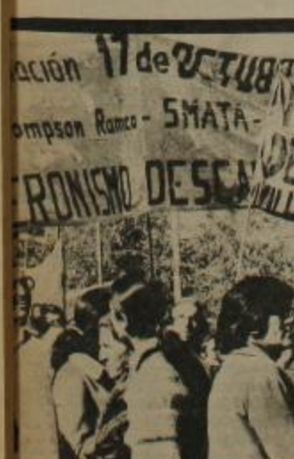
La clase obrera cordobesa y sus aliados se dieron cita masivamente en la V celebración del "cordobazo".

Sin embargo la columna logró su fin: llegar donde estaban SUS PRESOS, demostrarle su cariño y el reconocimiento a su lucha, marcando una vez más de qué forma conquista sus derechos el pueblo en esta sociedad: no puede esperar que la burguesía se los otorgue de buen grado PORQUE NUNCA LO HARIA; HAY QUE ARRANCARSELOS CON LA LUCHA. La miseria, el hambre y la represión del sistema capitalista solo se destruyen con el combate, que nos llevará a construir la patria socialista.