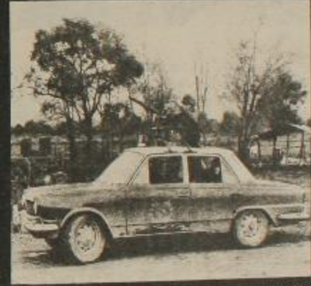
Las armas prontas a actuar, demostraron que en el "gobierno popular" se ataca a la clase trabajadora y a su vanguardia.

Obrera de Avanzada, Partido Revolucionario de los Trabajadores y el Movimiento Sindical de Bases.