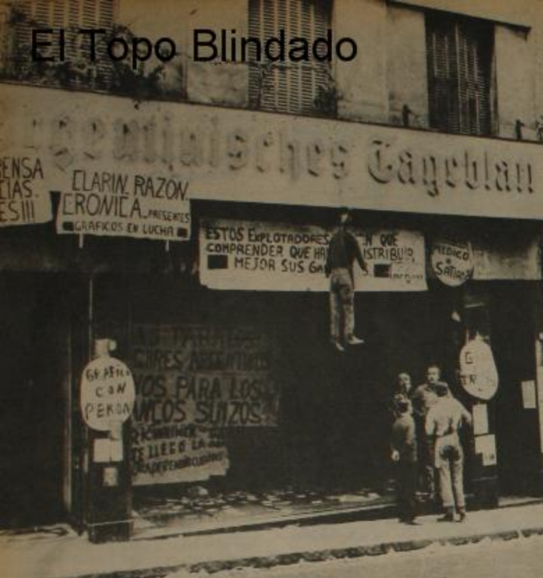
Alemann y Cia.