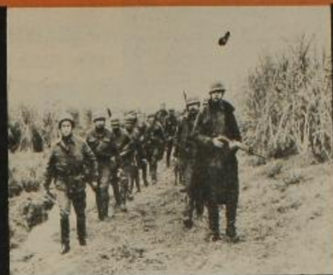
Las fuerzas represivas sobre el territorio tucumano arrasando, golpeando y encarcelando al pueblo.

fesionalista", "neutral" y "prescindente" de Chile demostró ser fascista. Seguiremos pensando que el nuestro, que demostró ser fascista, ha dejado de serlo?" Todavía muchos compañeros enrolados en el populismo y el reformismo tratan de una forma u de otra de mantener sus posiciones claudicantes, vacilantes y pequeños burgueses en el campo del pueblo. Y esto solo sirve para confundir, sembrar falsas esperanzas en las filas del pueblo y embellecer a un enemigo feroz, nada menos que el brazo armado de los explotadores. Mientras duraba el Operativo Tucumán, en "Radio Colonia" un locutor citaba las palabras de un radioescucha que le había hecho llegar al siguiente comentario sobre este hecho: "No entrar en los montes tucumanos por la niebla, fue como si los ejércitos aliados no desembarcaran en Normandía por la niebla". No es que sea alentador la posición de este radioescucha, pero demuestra que las FF.