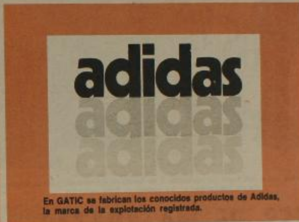
En GATIC se fabrican los conocidos productos de Adidas, la marca de la explotación registrada.

Ante el intento de este gobierno de sentar en el banquillo de los acusados, por delitos que tienen de 5 a 15 años de prisión, no a los oligarcas que nos explotan y entregan al imperialismo, sino a los trabajadores que son los productores de toda la riqueza, nos acercamos a los compañeros de la fábrica en San Martín, Provincia de Buenos Aires, para hacerles llegar nuestra solidaridad e informar mejor de su lucha.