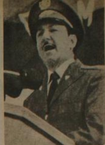
Comandante Raúl Castro

Expresión inequívoca de esta nueva situación es la derrota de los Estados Unidos en Viet Nam y su inevitable fracaso en toda Indochina; los acuerdos firmados entre la URSS y los Estados Unidos en junio del año pasado y que constituyen un triunfo de las posiciones del socialismo; la firma del acuerdo cuatripartito sobre Berlín Occidental; los tratados suscritos por varios países socialistas con la RFA que retrandan los resultados de la Segunda Guerra Mundial y del desarrollo de la posguerra; la organización de negociaciones en torno a la contención de la carrera armamentista y los problemas del desarme; el reconocimiento jurídico internacional de la República Democrática Alemana; la ayuda y el apoyo a los pueblos árabes que combaten al agresor israelí. El reconocimiento del status colonial de Puerto Rico y de los legítimos derechos de varios pueblos africanos por parte de las Naciones Unidas; el re-