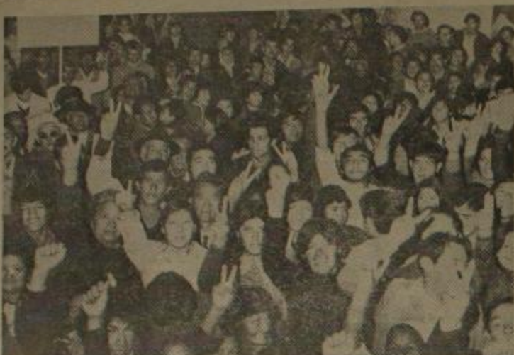
Salta: El pueblo no olvida a sus vestigios

Con una nutrida manifestación el pueblo salteño alzó su voz para condenar a los torturadores y asesinos al servicio de la burguesía y el imperialismo.