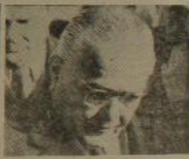
Balbin: La traza es hasta el fin