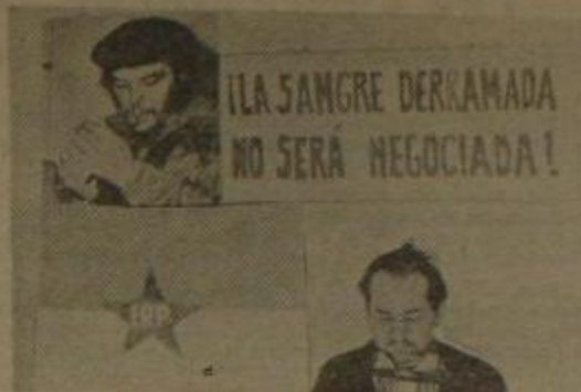
Colombo en la cárcel del pueblo