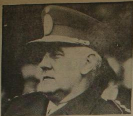
Lanusse: El padre de la criatura