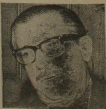
Krieges: Como antes, mejor que antes

salieran en libertad los compañeros. El pueblo no le dio tantas vueltas, ese pueblo que, el 25 de mayo, to- davía no había sufrido los tremendos golpes que la reacción le asestara por la espalda.