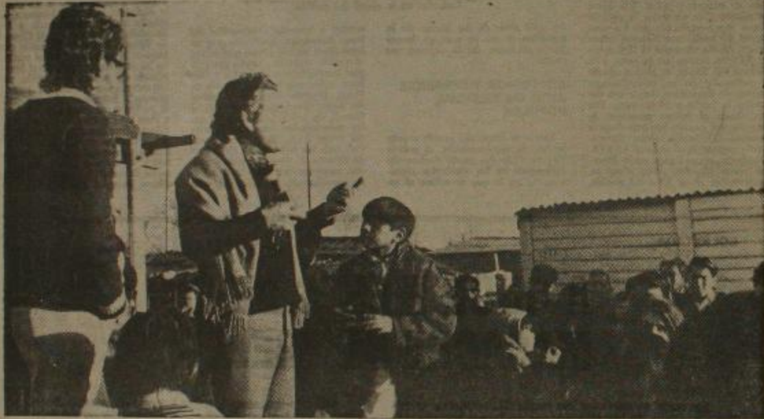
Las Antenas: Los barrios se organizan

Pero este proceso no es exclusivo de este barrio. Hay muchos otros barrios, villas, pueblos y aldeas en nuestra patria que han comenzado ya a organizarse para luchar por sus problemas inmediatos, por una sociedad más justa.