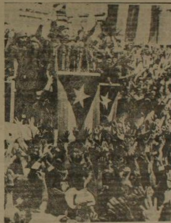
asínt Fidel en la Habana Solo 6 años después del Moncada