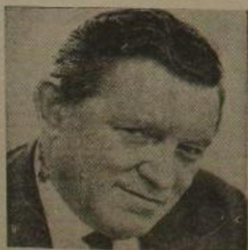
Celluari: Explora con sensibilidad social