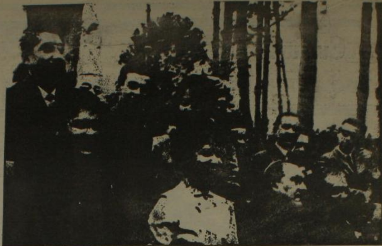
1962. PUNTA DEL ESTE. EL COMANDANTE ERNESTO "CHE" GUEVARA CON EDUARDO VICTOR HAEDO