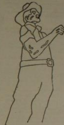
El Obispo de Goya, el Montonero de Sacramento del Tercer Mundo, las organizaciones multilaterales de Goya y el Pueblo todo han empezado su actividad estructurando una COMISION DE APOTO.

De esta forma el campesinado montonero, apoyado por los sectores populares ha decidido NO COMER MAS SU POBREZA.