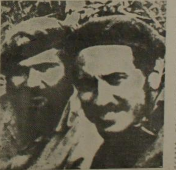
CAMILO TORRES: POR EL SOCIALISMO

Al comprometerse en la construcción del socialismo el hombre posee, objetivamente, fundada en la experiencia histórica y tratándose de sualizar en forma rigurosa los hechos, conocimiento que es la única manera efectiva de combatir el inhumano y absurdo —nuestra situación de dependencia.