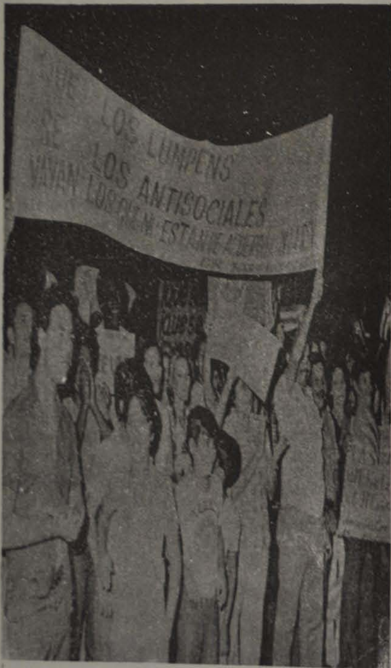
Las masas de trabajadores cubanos, que con su esfuerzo han ganado la conquista del poder político y las transformaciones revolucionarias de la sociedad socialista, repudian a los elementos antisociales y lumpenes que se niegan a integrarse en los niveles de vida superior que ha alcanzado la revolución.

Después de 2 décadas de cerco criminal, Cuba, con el esfuerzo de su pueblo, con la ayuda de países socialistas y la solidaridad revolucionaria de todos los sectores avanzados de América, logró demostrar al mundo que la Revolución Socialista es capaz de transformar la vida de un pueblo explotado por el capitalismo.