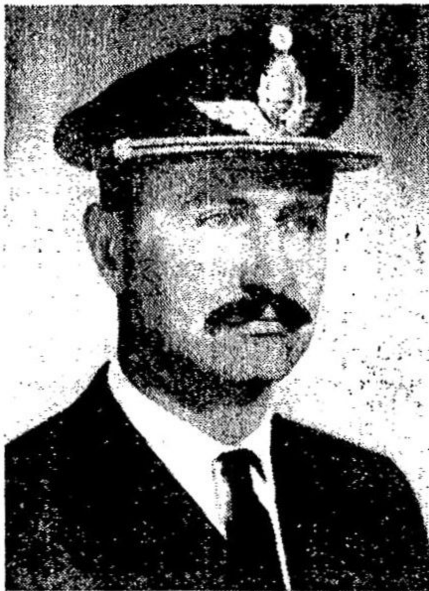
Comodoro Agustín H. de la Vega, Jefe Nacional

Porque somos cabalmente justos, aquí no vamos a escatimar una pizca de verdad; mucho se ha dicho de la subversión realizada durante el peronismo, y qué decir de la provocada luego de la Revo-