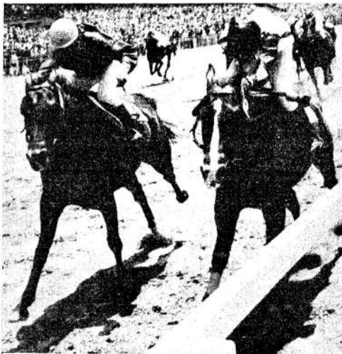
Brabham que por dentro pierde ante Exagerado-esta inscripto en dos cotos. Y sus allegados siguen deshojando la margarita. ¿Será en la milla o en 2200 metros? En cualquiera, parece fija.

No tardó mucho en ponerse en marcha el lote. Tras unos metros parejos, prevaleció Facundia en la delantera. Leve ventaja sobre Nice Dancing y a dos cuerpos la restante. Cuando transpusieron el disco por primera vez, estiró la puntera a cuatro cuerpos sus ventajas sobre la de Parisi. Y a dos largos quedaba cerrando el lote La Polilla. No fue jus-