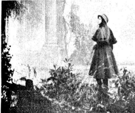
La protagonista de este buen film inglés de tono fantástico.