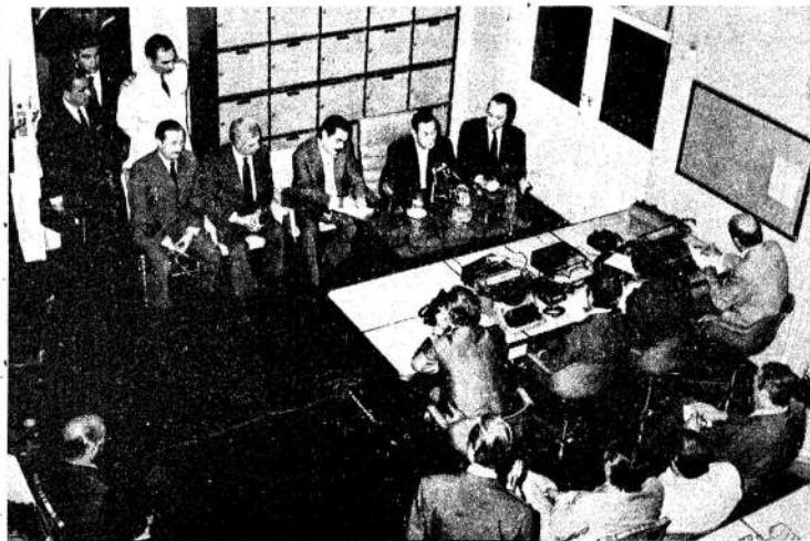
En conferencia de prensa, Perón dijo que los empresarios deben absorber los aumentos.

Perón habló de todos los temas: militares, jóvenes, violencia, precios y salarios, etc.