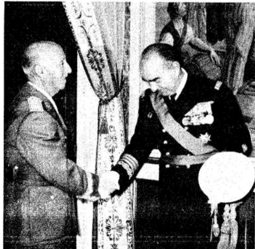
Carrero Blanco saluda a Franco. La tragedia, cerca.

Nacionalistas vascos a la ofensiva. El gobierno argentino declaró duelo nacional