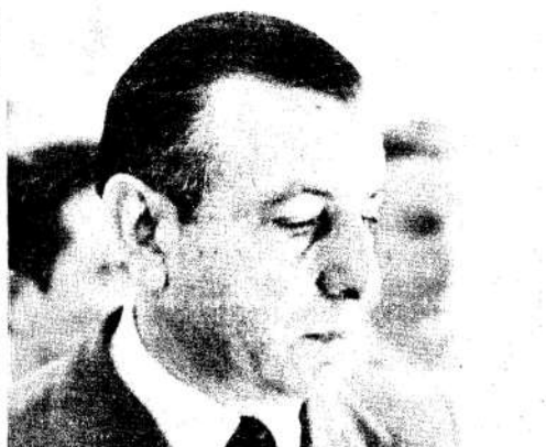
El general Caro establecerá su despacho en la Capital

Hasta el momento —de acuerdo a lo adelantado por las fuentes policiales— no ha sido radicada una denuncia formal de secuestro en ninguna de las reparticiones de esta ciudad.