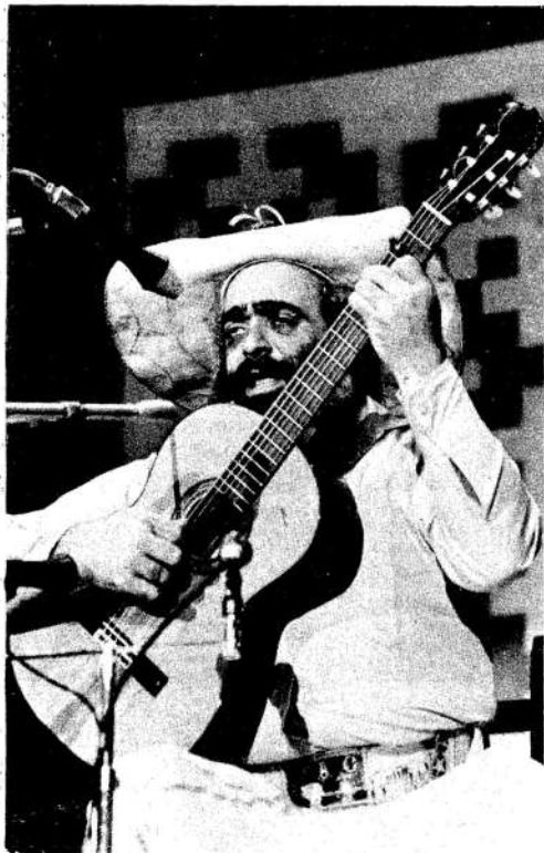
Jorge Cafrune en el Luna Park. Presencia. Repertorio confuso.

El cantor reiteró su conocido estilo en un recital generoso pero musicalmente limitado