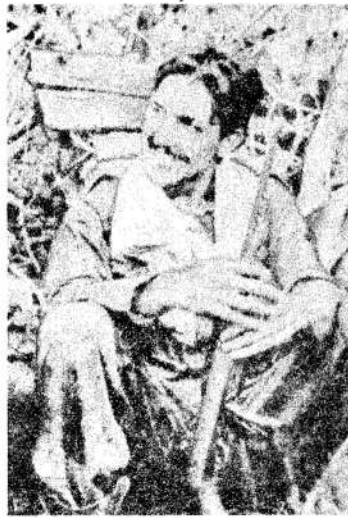
Camilo Torres y Fabio Vázquez figuras legendarias de la guerrilla colombiana. Torres, sacerdote, murió con las armas en la mano.

BOGOTÁ, 20 (Especial de IPS).—Hace una semana, el ejército regular de Colombia libró duros combates con grupos guerrilleros que operan en varias regiones del país. Los observadores sostienen que, esta vez, se trata de "combates decisivos". En el departamento de Antioquia, el ejército enfrentó a un comando del Ejército de Liberación Nacional que dirige Fabio Vázquez Castaño, y dio muerte a tres guerrilleros. Luego del combate, se anunció que habían sido liberados tres industriales que permanecían en poder de la guerrilla.