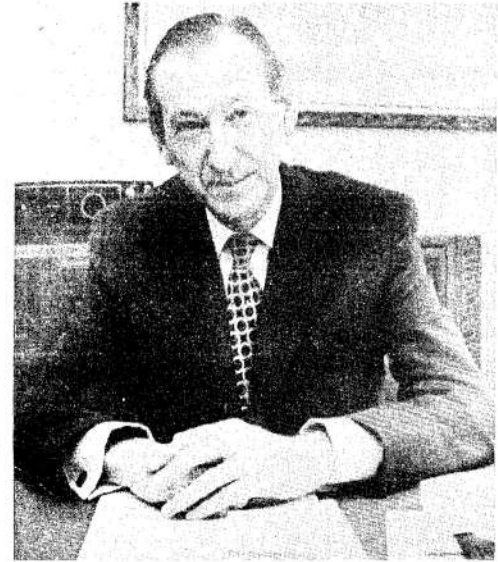
Kurt Waldheim, secretario de la ONU, presidirá las sesiones.

Tres temas fundamentales dominarán la conferencia: la exigencia árabe de que Israel devuelva todos los territorios ocupados, la insistencia de Israel en tratados contractuales de paz con fronteras seguras y reconocidas, y el destino de los palestinos, quienes fueron desplazados de sus tierras al crearse el Estado de Israel en 1948.