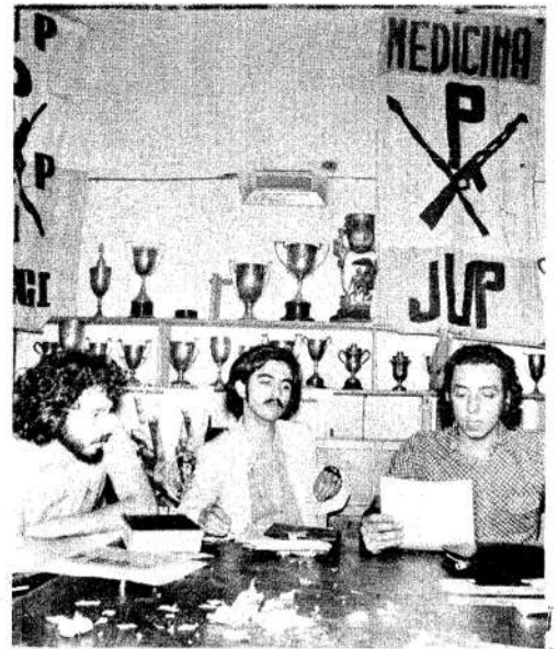
Un peronista, un comunista y un radical anunciaron el congreso

El temario oficial del congreso contempla los siguientes temas: a) situación nacional; b) situación universitaria; c) situación del movimiento estudiantil; d) plan de acción para el verano; e) renovación de autoridades.