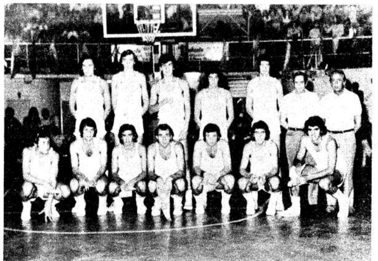
Este es el equipo que le "puso música" al sudamericano juvenil: Argentina. Brillante exposición.

Brasil está orientado por una organización excelente, que le permite crear permanentemente nuevos equipos, adiestrándolos en planos de gran valía, combinándose en ello viajes, distintos ambientes y combinaciones internacionales. En Argentina, se