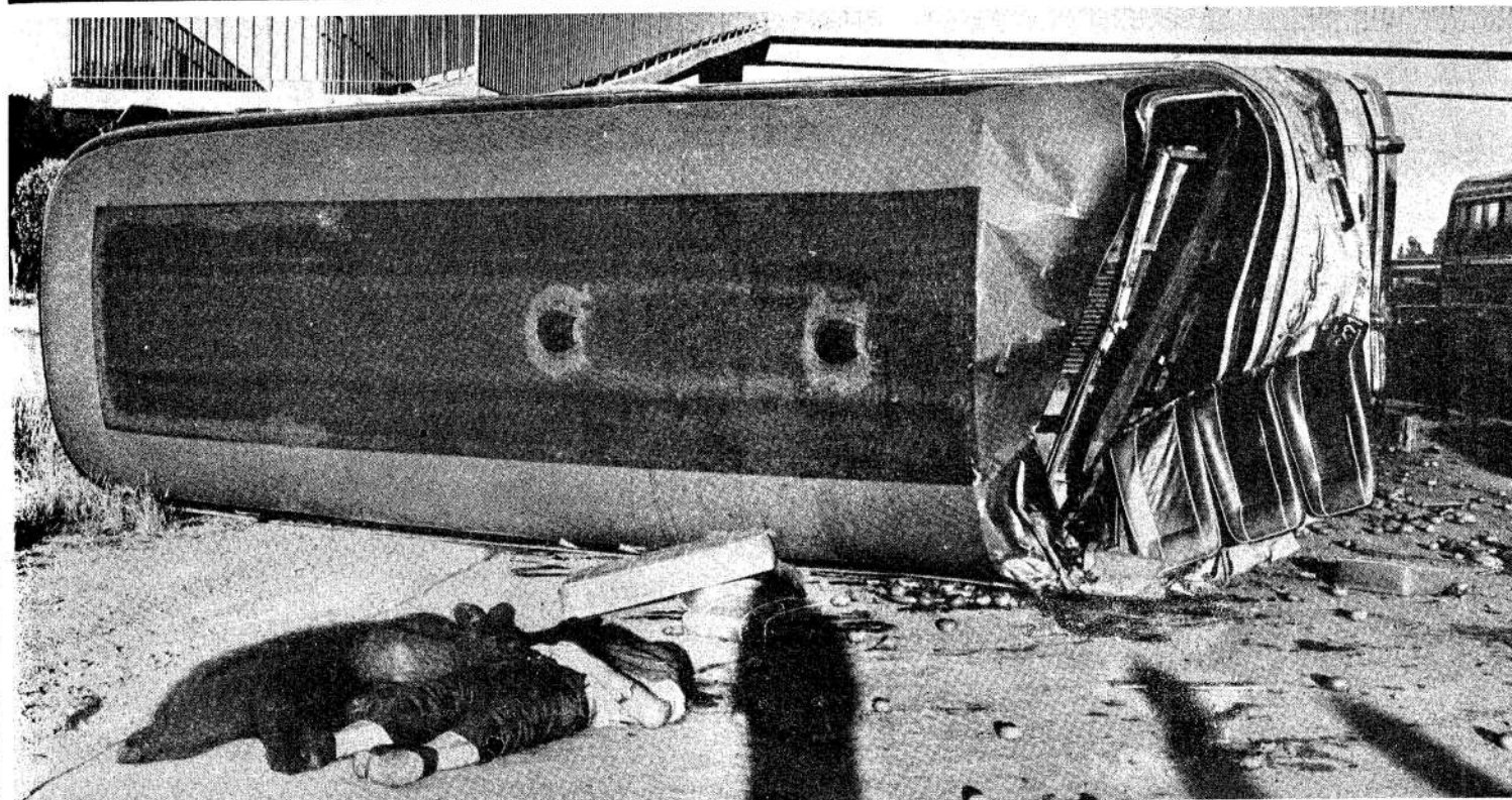
Muerte en la ruta. Fue en la Panamericana a la altura de Escobar. Chocaron un colectivo y un camión: dos muertos ( página 5)