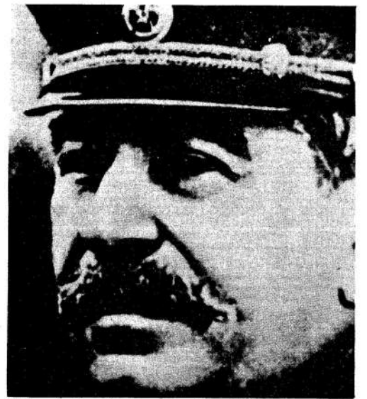
Stalin, extrañamente evocado por Robert Wilson. Interminable.

Los acomodadores del teatro de Nueva York Brooklyn Academy of Music saludaron con un cordial "buenas tardes" a los 500 espectadores que pagaron 10 dólares cada uno para asistir a la representación de Vida y tiempo de José Stalin , que comenzó en el atardecer del sábado pasado. Cerca del mediodía del día siguiente, los despidieron con un desfalleciente "hasta siempre". Es que esta última creación teatral del dramaturgo norteamericano Robert Wilson tiene una duración de 14 horas.