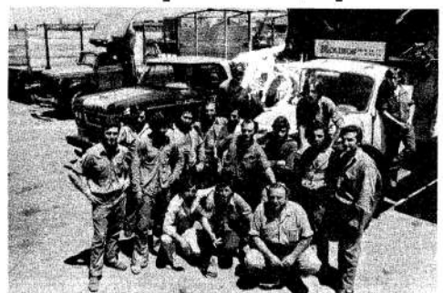
Camioneros en conflicto: esperan la mercadería horas.

Dos días de paro de transportistas en Molinos. Quieren estabilidad