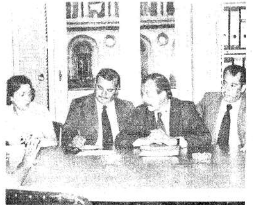
Dirigentes nacionales del magisterio en su nueva casa