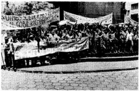
Mientras la planta permanece tomada, los obreros manifestaron.

Afiliados al gremio se concentraron frente al Ministerio de Trabajo