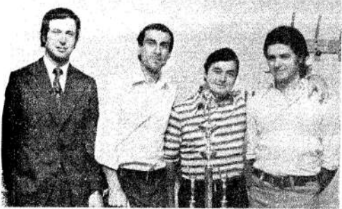
Esta Copa es nuestra! Y así es, muchachos de Iguazú.

Una cachita tradicional del Bajo Flores se pobló con sus sueños rejuvenecidos; o mejor, tra vez florecidos. Y allí, como en tiempos no lejanos, "cuando el fútbol grande", pero sin ese lirismo glorioso de ahora. Allí, como cuando eran niños. Y también soñaban, allí, volvieron a girar, orgullosos apretando en sus camisetas de un rojo traspirado, la alegría estallante de un grito entrecortado, emocionante y emocionante: ¡Campeones!