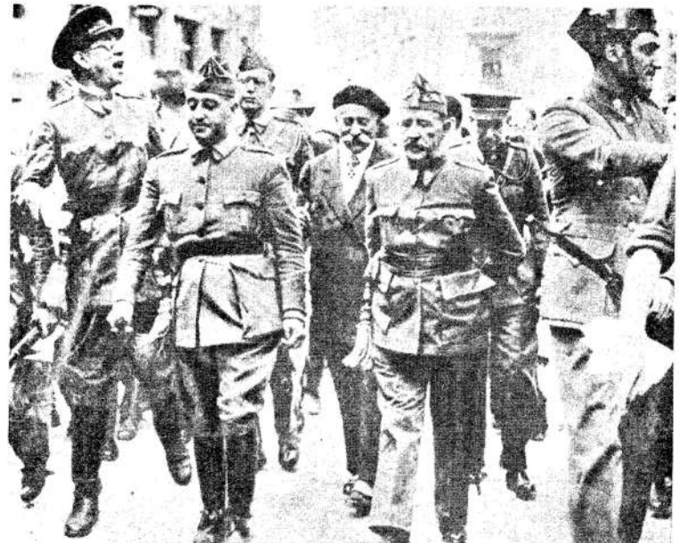
Burgos, 1936. Franco y Mola confiados. En el mar, las espaldas las protege Carrero Blanco.

El cadáver de Luis Carrero Blanco, de 70 años, quedó irreconocible y los cirujanos