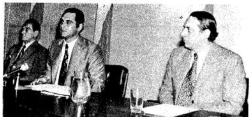
Licastro: "La unidad política está en la cultura política".

A continuación se reafirma la "Argentina Potencia" como "unidad de todos los sectores verdaderamente nacionales" y se le explica en lo externo e interno. En esta definición de transacción se quitó una referencia original a la "tercera posición".