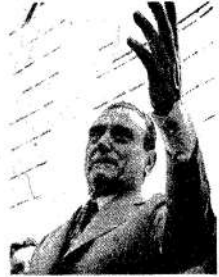
Embrioni: Yo fui albañil.

El intendente, luego de la recorrida, habló brevemente a los villeros: "Esta es una muestra —afirmó— del encuentro de obreros, técnicos y gobierno para la reconstrucción nacional. Los felicito —