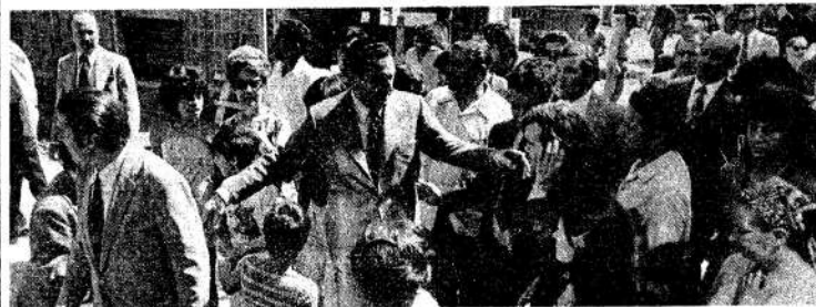
Mientras recorre la obra, el intendente atiende las inquietudes de los vecinos.

El intendente municipal, general (R.E.) José Embrioni, visitó en la mañana de ayer la obra en construcción del barrio que radiará a los habitantes de la Villa de Emergencia N° 7, de Bragado y Tellier. Los departamentos se construyen frente a la manzana donde está ubicada actualmente la villa y han revolucionado el concepto de vivienda digna y los planes de financiación de la Comisión Municipal de la Vivienda.