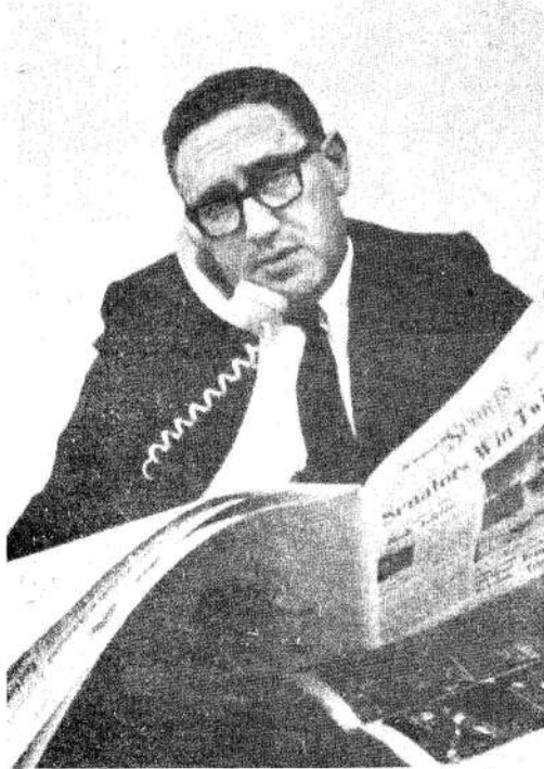
Henry Kissinger, hombre de la Comunidad de Inteligencia.

Ambos trabajaron en la Comunidad de Inteligencia. En Madrid conoció a Perón