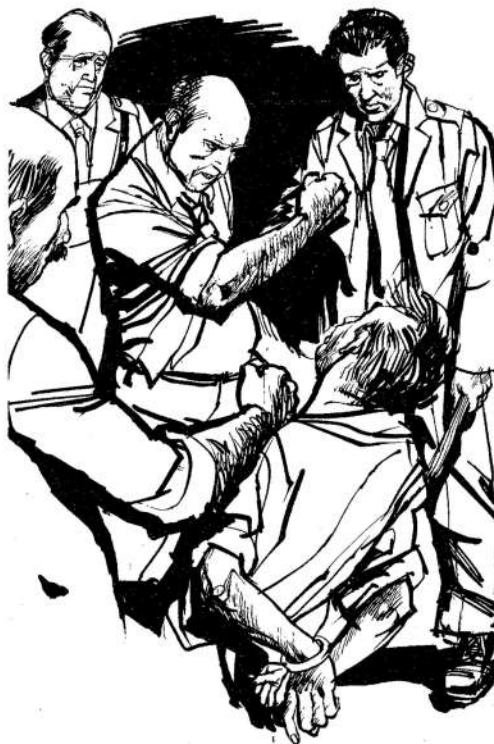
Brutales castigos aplicados a un hombre causaron su muerte.