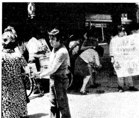
En plena calle y con alcancías los cesantes de IME piden ayuda.

Mercado ausentismo estatal; preocupa el conflicto al P.E. provincial