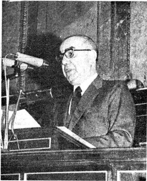
Carrero Blanco. Fue mano derecha de Franco

Mientras tanto, por medio de pafletos clandestinos y mensajes, se convocó a una