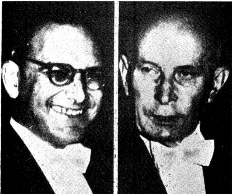
Ex primer ministro Marcello Caetano y ex presidente Américo Thomas. Los ultras se fueron.

La lucha de liberación de las colonias fue la causa indirecta del cuartelazo. Anuncian elecciones