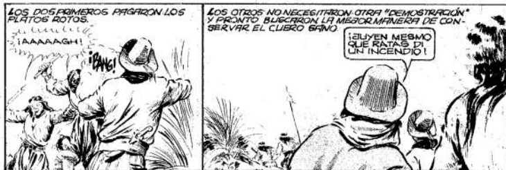
Las historietas argentinas asimilaron enseñanzas yanquis: el aborigen es presentado como salvaje

Mientras siguen aferrados a sus ritos, usos e idiomas, comienzan a organizarse. El primer Futa Traun