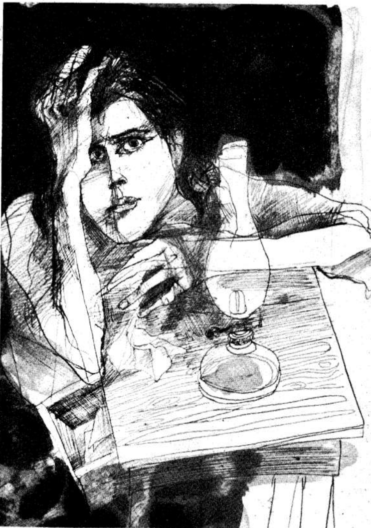
Ilustración de Carlos Alonso para "La atardecida" de Eduardo Falú y Manuel J. Castillo

Música, poemas y pintura reunidos en las originales partituras de la Editorial Lagos