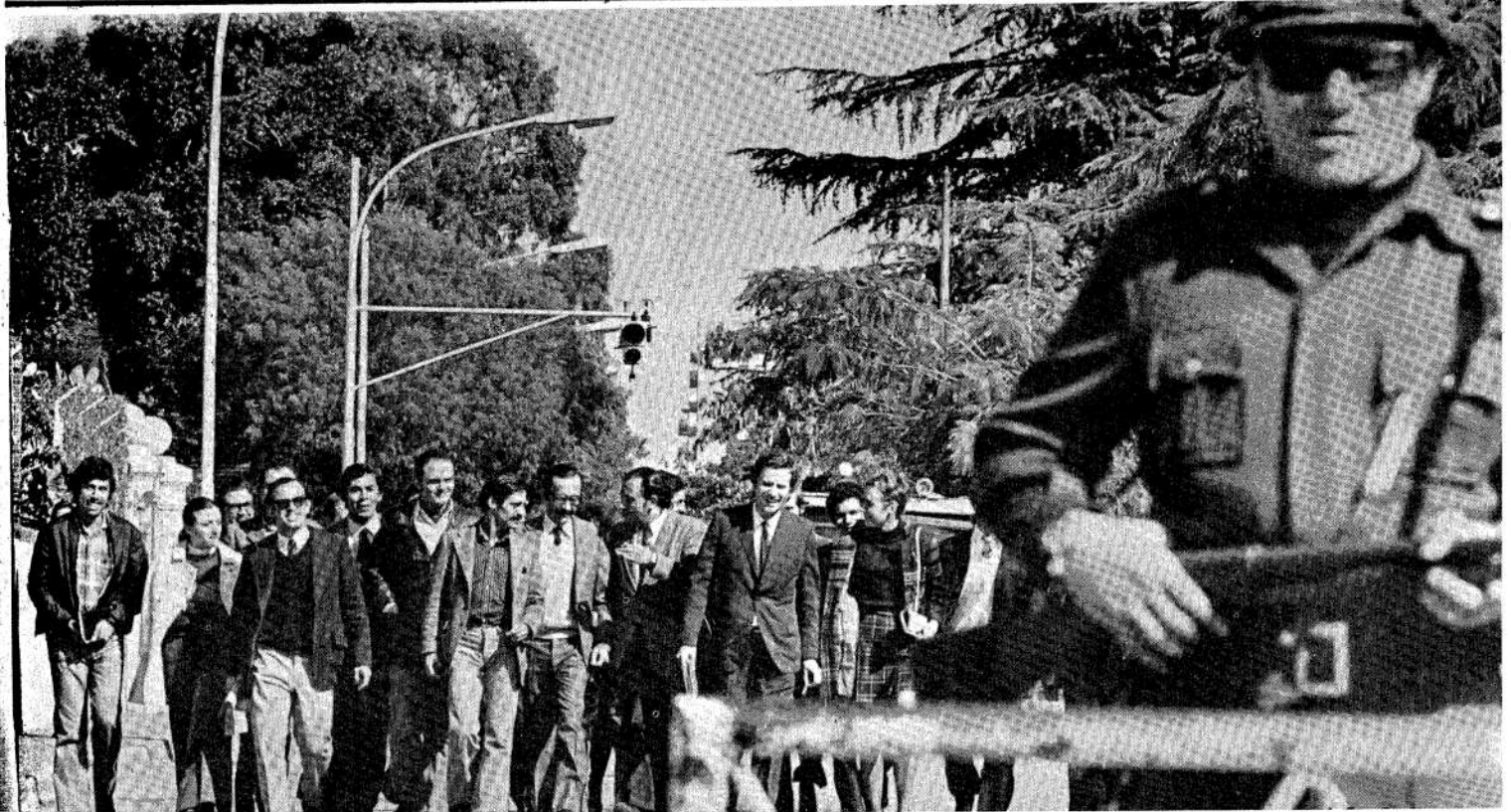
Perón y la Juventud: el acto del 1° será gremial y no político. Elegirán la Reina del Trabajo (Inf. págs. 12-13)

RESPALDO POPULAR AL GOLPE EN LISBOA Información página 2