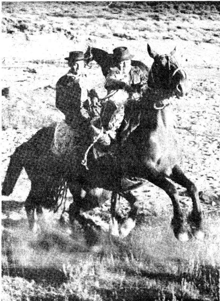
Mapuches neuquinos cumpliendo tareas campestres

El acosamiento y la destrucción que sufrieron desde tiempos inmemoriales las comunidades aborígenes no lograron, finalmente, su eliminación total. Los despojaron, sí, de las mejores tierras que quedaron en manos de terratenientes y fueron arrinconados en parcelas inhóspitas y pedregosas; sólo el conocimiento de una técnica agrícola empírica y milenaria les permitió sobrevivir en desolados parajes de Salta, Tucumán o Neuquén.