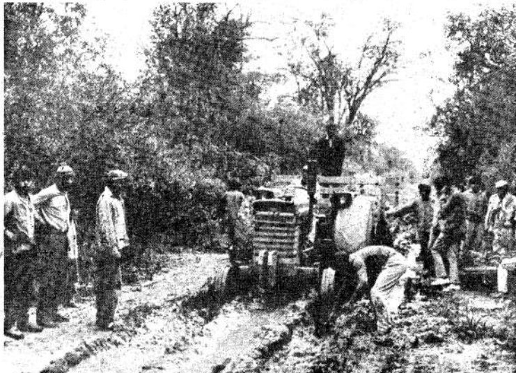
Un grupo de matacos, trata de desenchajar su tractor. La maquinaria es usada para producir