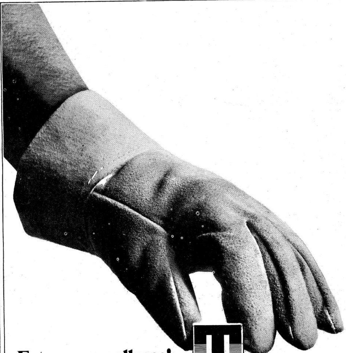
MARCOLETTI y Asociados

Israel celebró hoy el 26 aniversario de su independencia, pero el clima de guerra obligó a suspender las recepciones oficiales y los desfiles militares. De todos modos en las sinagogas se celebraron servicios religiosos. El "regalo de cumpleaños" de las Naciones Unidas a Israel, fue la condena del Consejo de Seguridad por los ataques contra las poblaciones libanesas. Mientras tanto aún no ha sido superada la crisis de gobierno precipitada por la renuncia de Golda Meir.