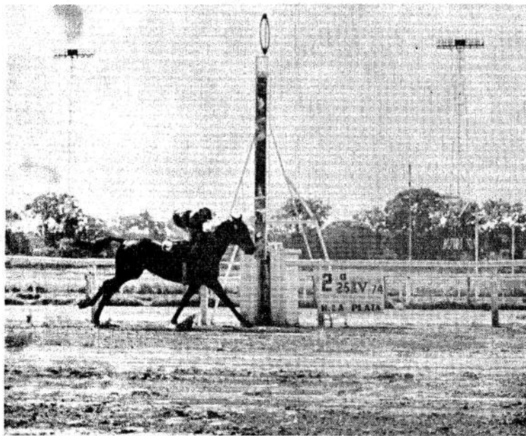
Paremia, candidata de NOTICIAS, cruza el disco victoriosa en el segundo cotejo de ayer en el Bosque. Como lo demuestra la nota gráfica, sin sustos y con inoperados $ 5.10 a ganar en 2'27"

De salida fue un diálogo con Officer al que dominó a 150 metros del disco y escapó para ganar en 2'27"