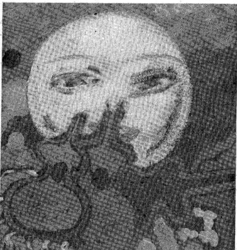
"Zamba del guitarrero" en la visión de Rómulo Macció

que se buscó embellecer el producto musical con la inclusión de obras de pintores argentinos, a través de cuidadas ediciones. El propósito de esta actividad, basada en el apoyo y la difusión de autores, músicos y plásticos locales, se proyecta ahora al exterior, ya que estas ediciones pronto comenzarán a exhibirse y distribuirse en Europa y Estados Unidos.