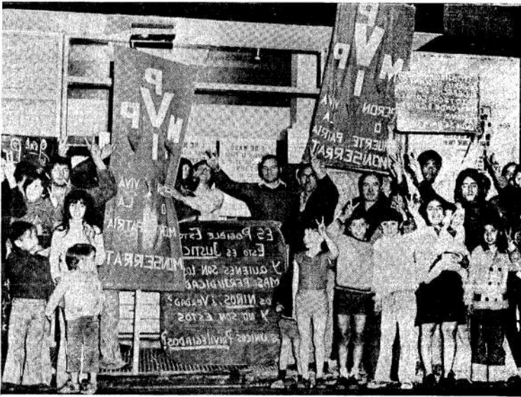
Los vecinos exponen así sus quejas y reivindicaciones, a poco de ser tomado el hotel

Fue "tomado" un hotel para dar albergue a 14 familias desalojadas