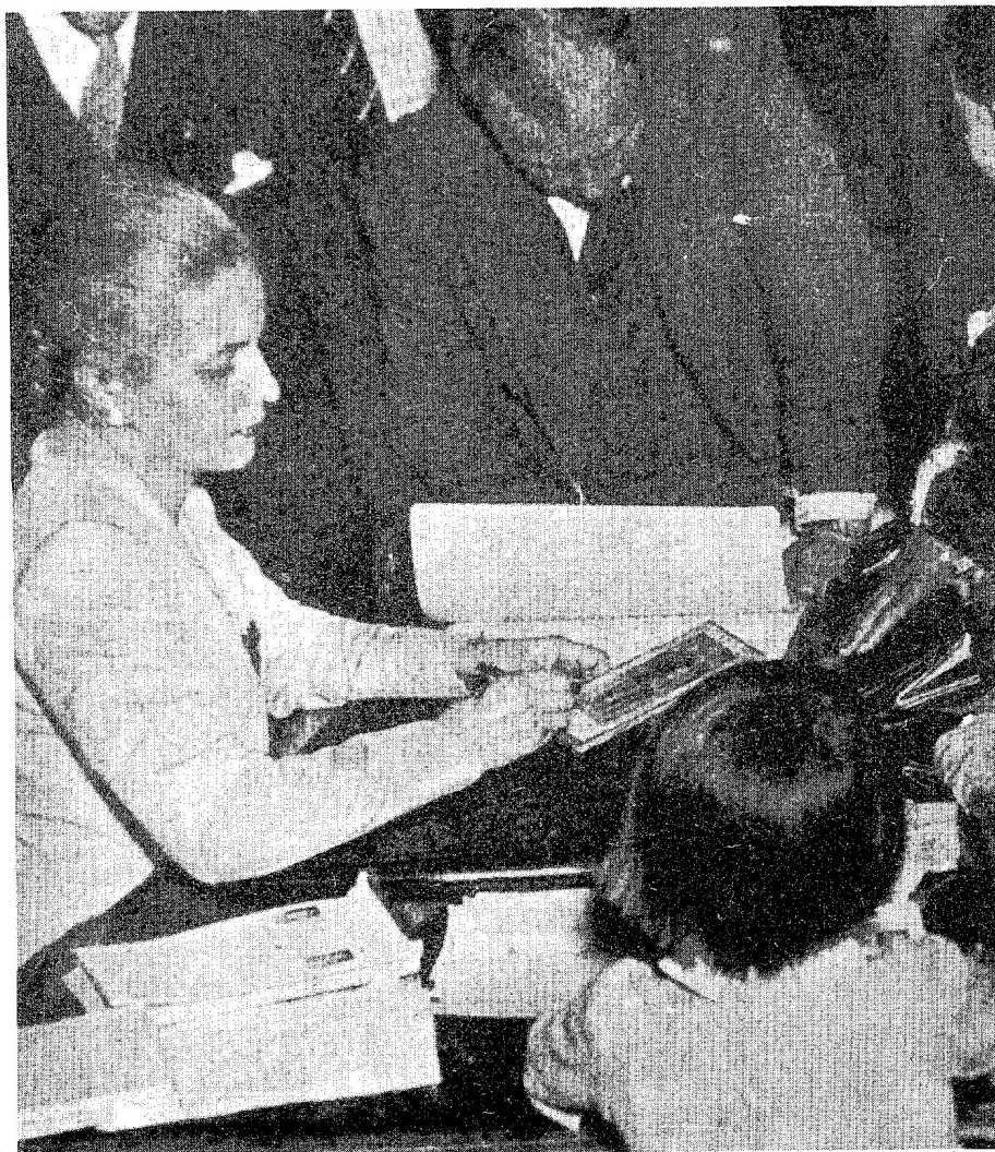
La niñez, objeto de preocupación permanente para Eva Perón.

44. La Nación , Buenos Aires, 16 junio 1977.