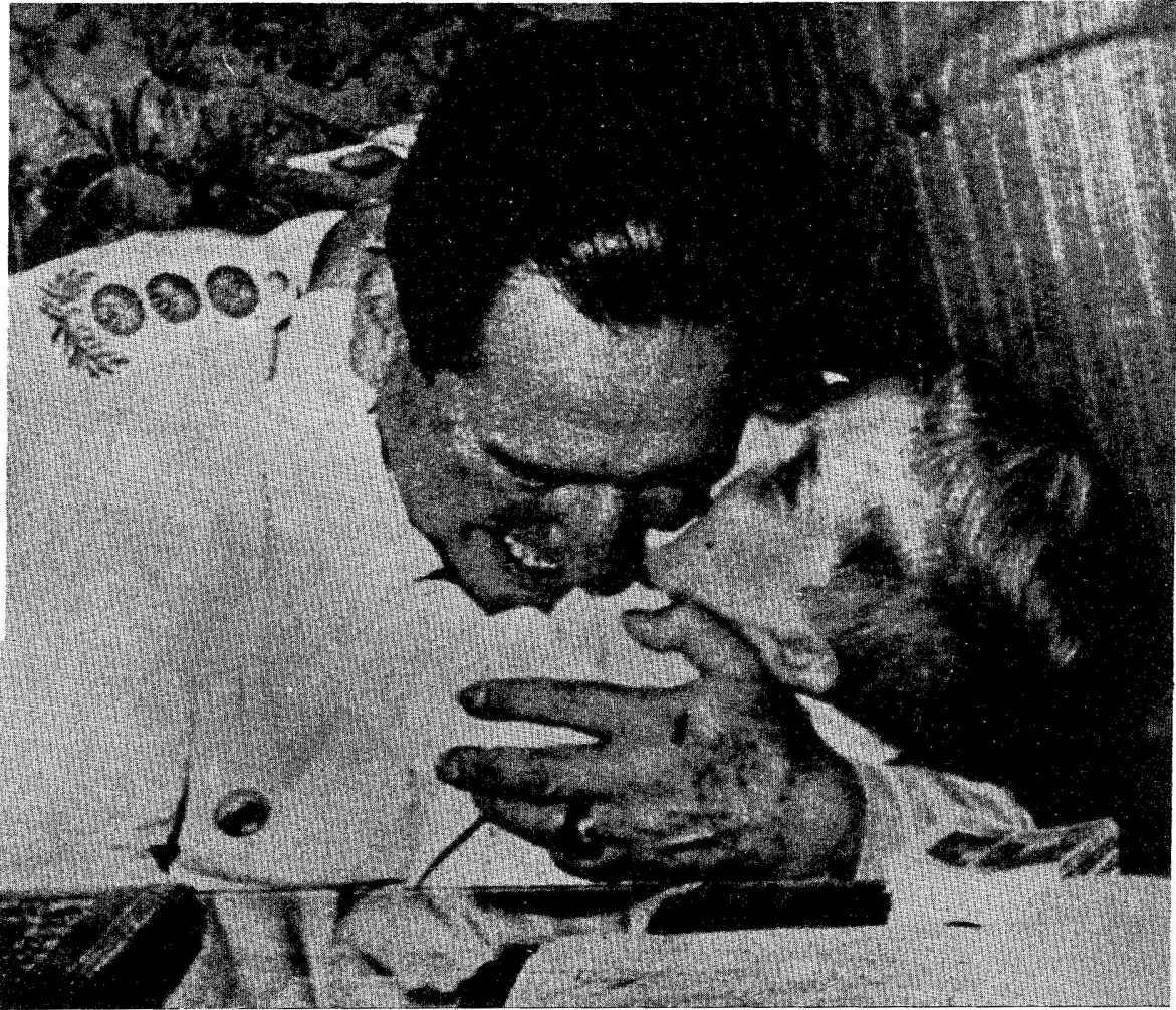
General Juan Domingo Perón