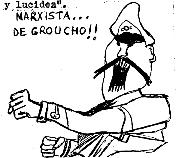
LA PATA DE LA SOTA

El Ejército ratificó el apoyo a la actual política económica del gobierno, aceptando los reclamos salariales, a los que calificó de "legales".