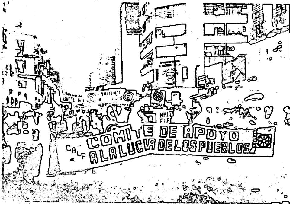
La Solidaridad con El Salvador es cada día más activa. Manifestación en Caracas.

En este sentido la actitud de gobiernos como Francia y México, al reconocer como una fuerza política representativa del pueblo salvadoreño al FMLN y