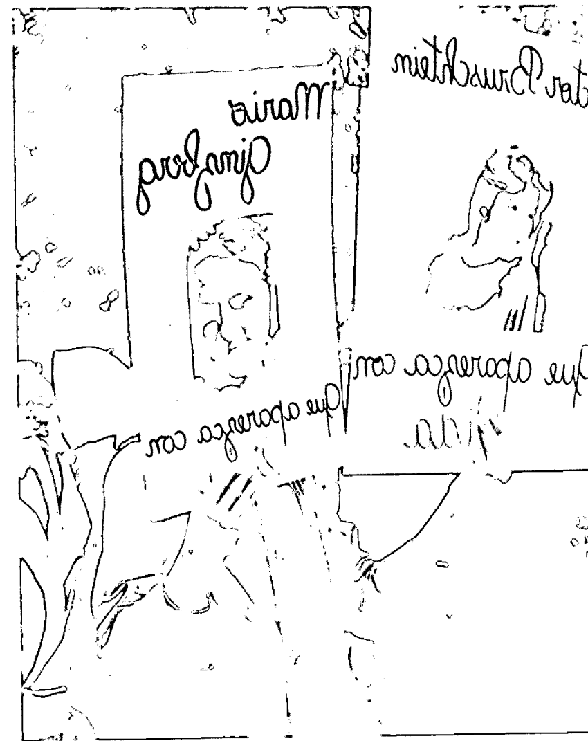
LAS MADRES DEL EXILIO TAMBIEN PIDEN POR SUS HIJOS (Del acto frente a la embajada Argentina en México)

Consecuentemente, para los familiares no hay borrón y cuenta nueva posibles y la asamblea de la OEA fue un hito más de su lucha.