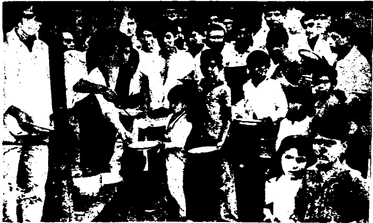
La olla popular: Impidamos la explotación organizando Congresos de Bases para frenar los planes patronales.

Nuestros compañeros, en nombre del Partido Revolucionario de los Trabajadores se solidarizaron con esa medida y pidieron un paro general de actividades de 24 hs. en toda la Provincia.