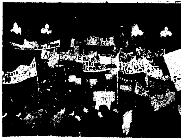
LOS ESTUDIANTES SE MOVILIZAN Hagamos una Asamblea General para continuar la lucha.

Sostenida por los compañeros de Farmacia en la última reunión de In-