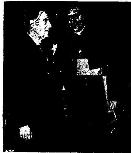
Belaunde Terry junto con la Curia y el P. D. C. peruanos siguen en su política reaccionaria.

Pero por encima de todo esto, tenemos dos circunstancias fundamentales, una de carácter subjetivo y la otra objetiva: