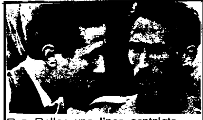
Ben Bella: una línea centrista. Boumediene: gracias a él aparecen nuevamente los representantes políticos del imperialismo

guardia capaz de movilizar los sectores políticamente más concientes de la población trabajadora de la ciudad y del campo a una escala nacional. La segunda reforma agraria fué interminablemente pospuesta, y de esta manera desanimado a los sectores más desheredados del campo, para quienes la revolución no había significado algún cambio fundamental en su miserable standard de vida y ninguna perspectiva de levantarlo en el futuro inmediato. Ninguna solución fué adoptada para el triste problema del desempleo, de esta manera se contribuía al grave surgimiento de la apatía y la progresiva desmovilización de las masas, quienes demostraron su apoyo a una orientación socialista revolucionaria por centenares de miles, en marzo y mayo de 1963. La decisión del congreso del FLN de construir una genuina milicia popular, de esta manera armando a los obreros y a los campesinos pobres, nunca fué llevada a cabo. En pocas palabras, un golpe militar llevado a cabo al caer la noche, pudo triunfar en pocas