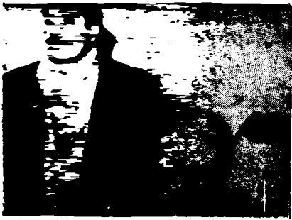
Los exilados bolivianos en un momento de la conferencia de prensa.