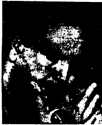
Caamaño: que se reconozca su gobierno

En esta defensa de la revolución argelina amenazada, los obreros pobres deben sacar todas las lecciones de la última experiencia. La principal lección es absolutamente clara. Es necesario construir un partido revolucionario de masas que pueda en la actualidad llevar a cabo la Carta de Argelia, que dirija la revolución socialista hacia la victoria en la creación de un gobierno estable de obreros y campesinos pobres en Argelia.