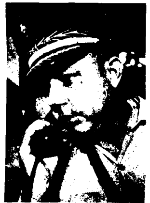
Imbert: recibe ordenes de Johnson para masacrar al pueblo dominicano