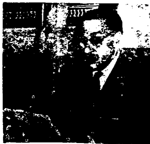
Ferhat-Abbas: una política capituladora frente al imperialismo francés

El golpe militar en Argelia en Junio 19 finalizó la alianza entre el ala del FLN dirigido por Ben Bella, el cual estaba orientado hacia el socialismo, (ligados a las masas a través de la "autogestión obrera") y el "ejército fronterizo" encabezado por Houari Boumediene, que favoreció un "socialismo árabe islámico". Fué esta alianza la que posibilitó a la combinación Ben Bella - Boumediene, voltear al régimen del gobierno provisional de la República Argelina en el verano de 1962. El golpe de estado constituyó un pesado golpe contra el ala izquierda de la revolución argelina y plantea un peligro contra las principales conquistas de la revolución, principalmente para la autogestión obrera de las empresas nacionalizadas.