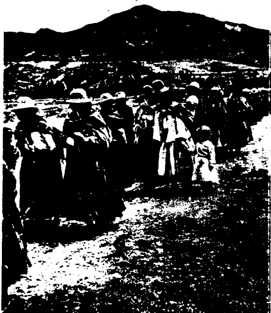
No es un partido político sino un pueblo en marcha

ía por esas pequeña y en podía fácilmente enga- la noche. Las cercas de hacienda de las tierras onamente enrolladas. Ni i hechas unas bolas, re- iedo, para que las vieses nas de la hacienda y los hosco y peludo mulo de