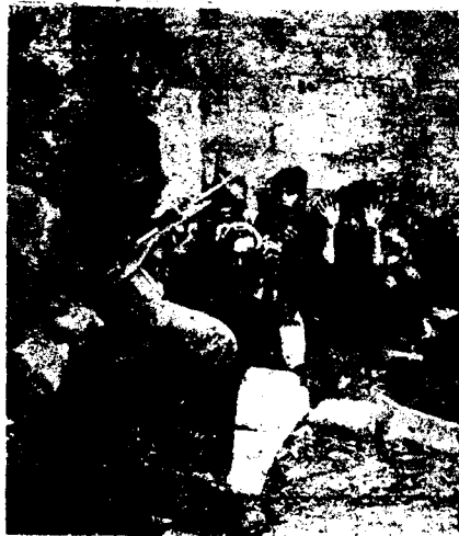
Asegurando la "democracia"

Mientras intensifican y expanden la guerra de agresión a Vietnam, los imperialistas de EE.UU. claman su "deseo de paz" y su "disposición a entablar discusiones incondicionales", con