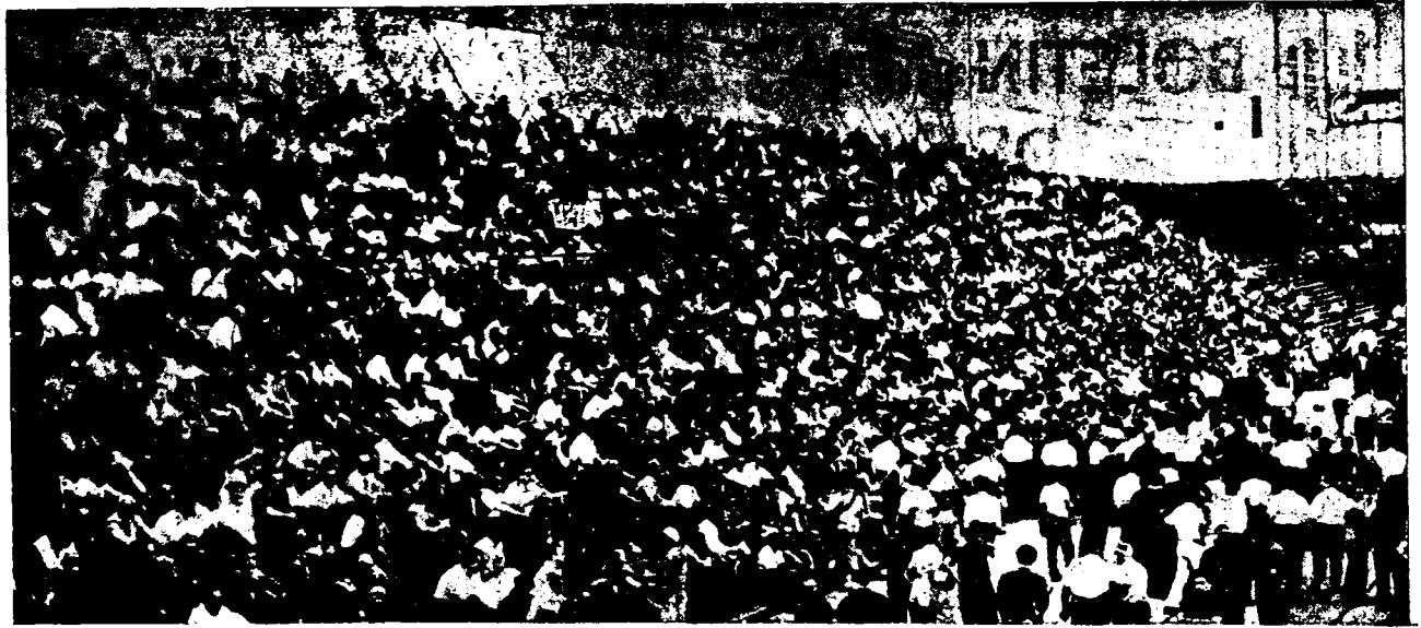
EL GREMIO GRAFICO SE MOVILIZO EXPRESANDO SU DESEO DE DEFENDER A LA VANGUARDIA DESPEDIDA

Pero mientras la patronal trata de ganar tiempo para desgastar la combatividad de nuestra vanguardia y, eventualmente, para ir logrando acuerdos parciales que no tienen otra finalidad que la de dividirnos, los compañeros de las fábricas en huelga se debaten heroicamente, en inferioridad de condiciones, contra la patronal y la policía. Pese a que su lucha se mantiene y que hacen sentir sus duros efectos a la patronal, esos compañeros -que son la vanguardia del gremio en lucha por el convenio- están condenados a desgastarse y a sufrir penosas represalias, si no reciben el apoyo inme-