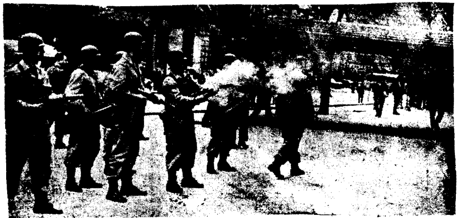
LOS TRABAJADORES YA SABEN CON QUE GOBIERNO TENDRAN QUE VERSE LAS