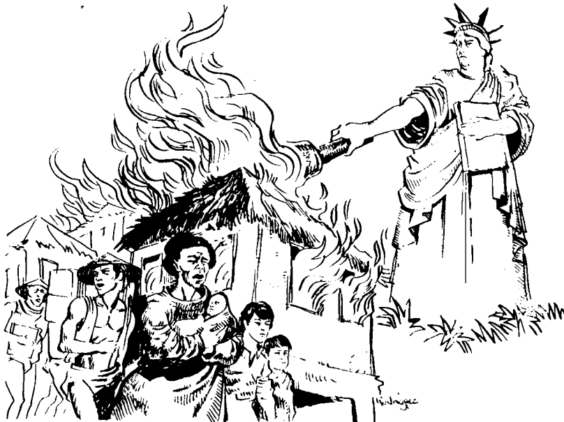
LA "DOCTRINA JOHNSON" EN ACCION vistas de vanguardia.

LOS ESTUDIANTES ANTIIMPERIALISTAS Y REVOLUCIONARIOS ARGENTINOS TIENEN LA PALABRA.