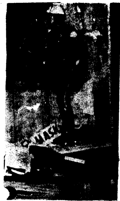
Escenas como esta de brutalidad por organizar sus Piquetes Armados de extender "su frontera ideológica" ha

En varias ocasiones, por ejemplo, los piquetes ("Deacons") se dirigieron a las autoridades Inte-