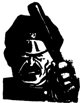
Este es el símbolo de la democracia y la libertad que tiene el pueblo norteamericano.