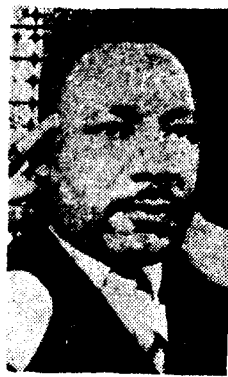
Luther King no quiere violencia. Prefiere 100 años más de ser vidumbre.

tan más identificarlos con los métodos de los Piquetes armados que con las llorosas invocaciones de Luther King. Por eso, cada vez más, la población negra busca la protección de los Piquetes y descubre que gracias a ellos, son más respetados y temidos por los racistas blancos que practican el terrorismo: "Si los Piquetes hubieran actuado antes, es seguro que los tres activistas de los derechos civiles asesinados en Mississippi no hubieran sido víctimas de los racistas", dicen. Y esta simpatía se ha extendido a otros lugares. Así, el diario "Michigan Chronicle" infor-