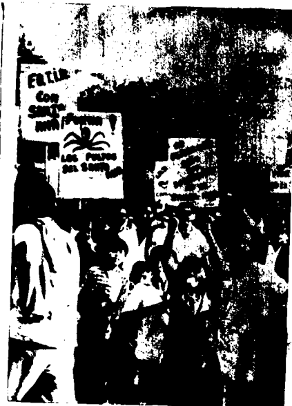
El Bloque de Legisladores Obreros los Representará en el Parlamento

Esta, que será una experiencia riquísima en enseñanzas, tenemos que tratar de que se generalice. Debemos tratar de que la aproveche el conjunto de los trabajadores argentinos; por ejemplo, es un deber de las direcciones clasistas de Jujuy en las próximas elecciones generales de 1966, llevar candidatos obreros, con un programa revolucionario y elegidos democráticamente en Asambleas de fábrica con asistencia de los activistas.