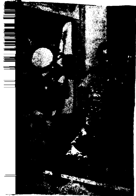
olicial son las que han hecho a los Negros de Defensa. El general Onganía tendrá que hasta las mismas ciudades de los EE. UU.

En otra ocasión, los piquetes armados debieron intervenir para defender a un joven negro que había sido acusado de besar contra su voluntad a una chica blanca. Los piquetes pusieron al muchacho negro directamente bajo su custodia y protección. Finalmente la chica blanca, cambió su historia y resultó que el beso no había sido contra