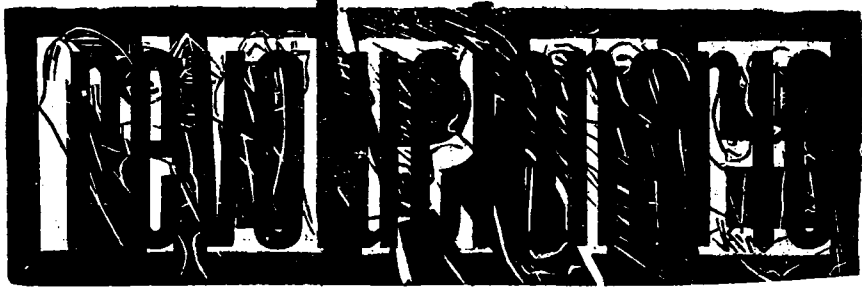
ORGANO DEL FRIP - ENERO DE 1955.

ra y estudiantil, lo está buscando afanosamente. Ha hecho o ha visto hacer toda clase de experiencias: desde el terrorismo hasta los intentos de guerrillas. Hoy, esa vanguardia atrincherada en las fábricas y gremios, continúa librando su batalla defensiva contra la oligarquía, y desde las universidades contra los avances de la colonización imperialista.