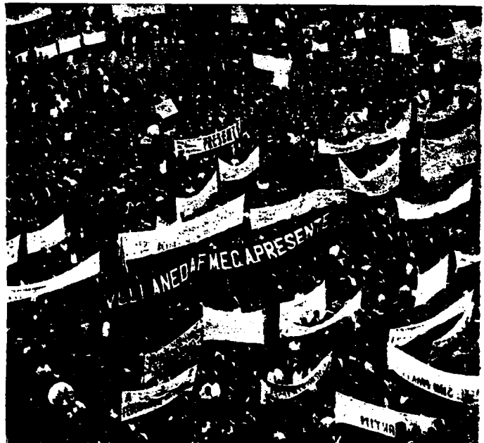
LA MASA TRABAJADORA GANO LA CALLE PERO NO ENCONTRO EN ELLA A SUS DIRIGENTES DISPUESTOS A ORIENTARLA Y EN SEÑALARLE EL CAMINO DEL TRIUNFO