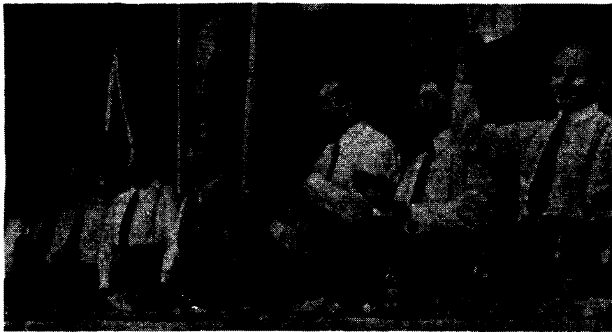
PERON RODEADO DE LA BUROCRACIA DEL PARTIDO NO SE DECIDIO POR LA SALIDA OBRERA Y POPULAR. ANTE LOS TESSAIRE Y LOS JORGE ANTONIO LOS TRABAJADORES NO CONTABAN. SIN EMBARGO SON LOS UNICOS QUE NO TIENEN LA CULPA DE LA CAPITULACION

El PRT es un eslabón de esa búsqueda de la vanguardia actual, y el instrumento para que el esbozo de revolución detenida y frustrada encuentre el rumbo de un nuevo ascenso.