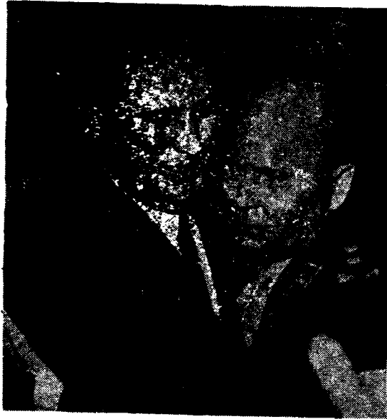
EL GENERAL LUCERO ABRAZA A PERON DESPUES DEL 16 DE JUNIO. EL EJERCITO "PERONISTA" NO PUDO Y NO QUISO DEFENDER A PERON EL 16 DE SETIEMBRE: TEMIA MAS EL TRIUNFO DE LOS OBREROS ARMADOS QUE EL DE LOS GORILAS MASACRADORES.

Pero cuando después del 16 de junio y del 31 de agosto, el fantasma