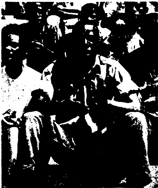
NOSOTROS VENCEREMOS: La juventud negra norteamericana se sienta en el suelo, en una de las tantas demostraciones, y canta su himno. De las Iglesias ha salido a cantar a la calle. Y en la calle ya no sólo canta. Ahora ha resuelto defenderse en forma armada de los blancos racistas

No vamos a hacer una narración de los hechos que están conmoviendo hoy el territorio y la sociedad norteamericana. Los diarios de todo el mundo publican a grandes titulares esos hechos, y descubren, escandalizados, que a más de 10 años de los sucesos de Little Rock, el "problema" negro en los EEUU es algo más que un "defecto" de la democracia yanqui. Little Rock fué sólo un símbolo. Hoy, el problema racial, ha tomado definitivamente su carta de ciudadanía en el panorama de la lucha de clases que corre a la "sociedad opulenta". La "cuestión negra" ha entrado en su etapa insurreccional, extendida como una tormenta atómica desde el pueblo y la ciudad sureña hasta los colosales centros industriales y urbanos de todo el país.