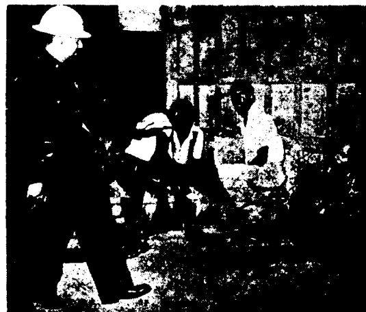
Tres negros asisten a un compañero baleado por la policía. Al lado, otro muchacho herido yace recostado en la pared. La brutalidad policial no es sino la forma de expresión del racismo blanco dispuesto a defender sus privilegios de clase.

La relativa bonanza de la economía norteamericana, ligada indisolublemente a la producción bélica, mantiene al vigoroso proletariado yanqui alejado de toda movilización de conjunto, justamente al revés de lo acontecido en la II Guerra Mundial, cuando bajo Roosevelt dió las más grandes pruebas de su poderío y combatividad. Por el contrario, hoy es el mejor aliado circunstancial de la política del imperialismo y de su gobierno. Las masas negras, por tanto, no encuentran en los blancos otros aliados inmediatos que el de las capas intelectuales de la clase media, especialmente las universidades y los sectores políticos de izquierda, entre los que sobresale, por su consecuencia y claridad el SWP, organización del trotskismo norteamericano.