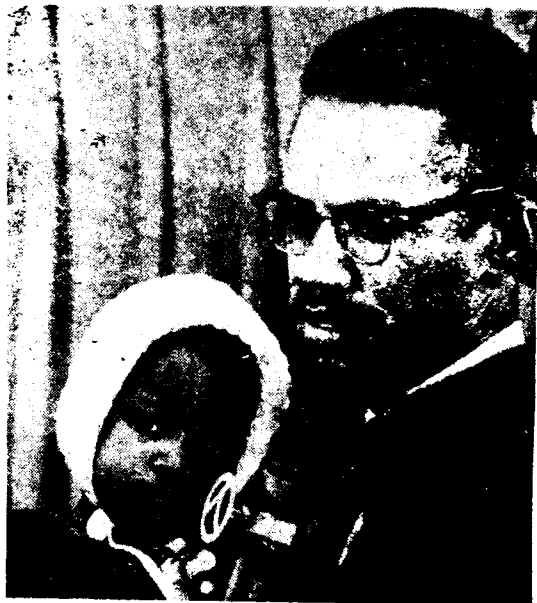
Malcolm X, con su hijita, al regreso de su viaje al Africa, donde conoció la Revolución Argelina y los nuevos países liberados del colonialismo. Poco después fué asesinado.

LA POBREZA NO ES SOLO PARA LOS NEGROS- Estos cinco hermanos son blancos y pertenecen a la familia de un obrero minero del carbón, en la zona de los Apalaches, víctima de la desocupación. La automatización ha reducido el número de obreros a un tercio en los últimos diez años. Esos desocupados no figuran todavía en las estadísticas oficiales.