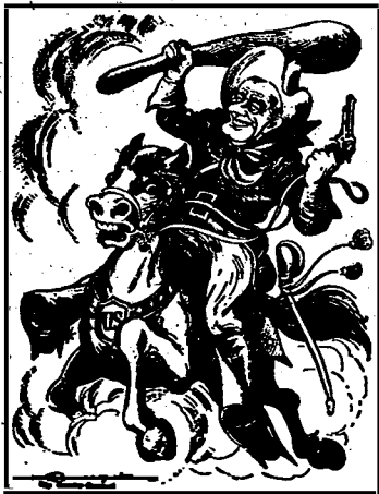
Fidel da una estrategia para frenar a este cowboy chantajista del imperialismo.

Es necesario poner fin a sus planes, transformar el Norte de Vietnam en el cementerio de los planes yanquis. Por todos los medios -con aviones y fuego antiaéreo, con la ayuda y participación del conjunto del campo socialista. Pero esto no es bastante. Es también necesario decir claramente a los Estados Unidos que la internacionalización de la guerra en el Vietnam del Sud significa la internacionalización del conflicto en el sudeste asiático; advertir que la presencia de tropas coreanas del sud y australianas autoriza al campo socialista a enviar sus propios voluntarios a Viet Nam del Sud.