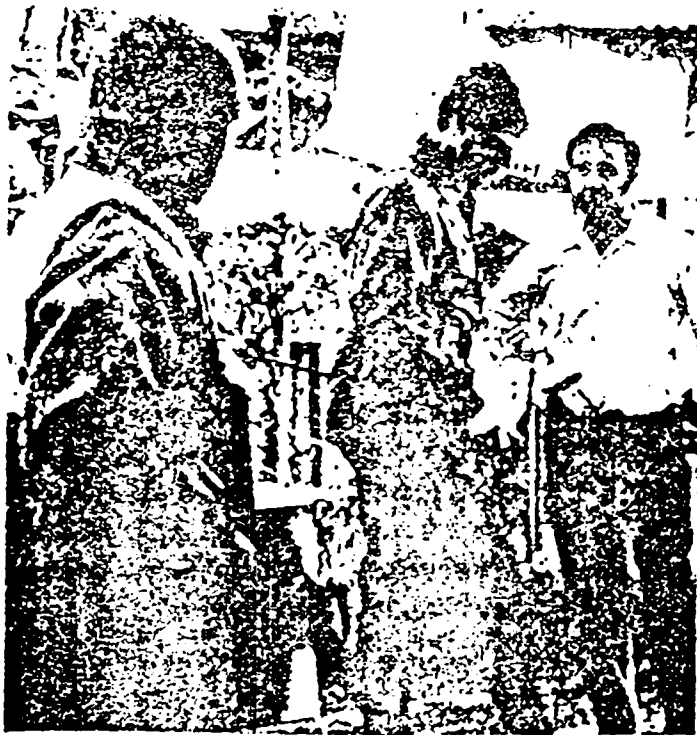
Las nuevas unidades más ágiles y pequeñas operan y se retiran enloqueciendo al enemigo.

Las nuevas unidades, más ágiles y pequeñas operan y se retiran enloqueciendo al enemigo.