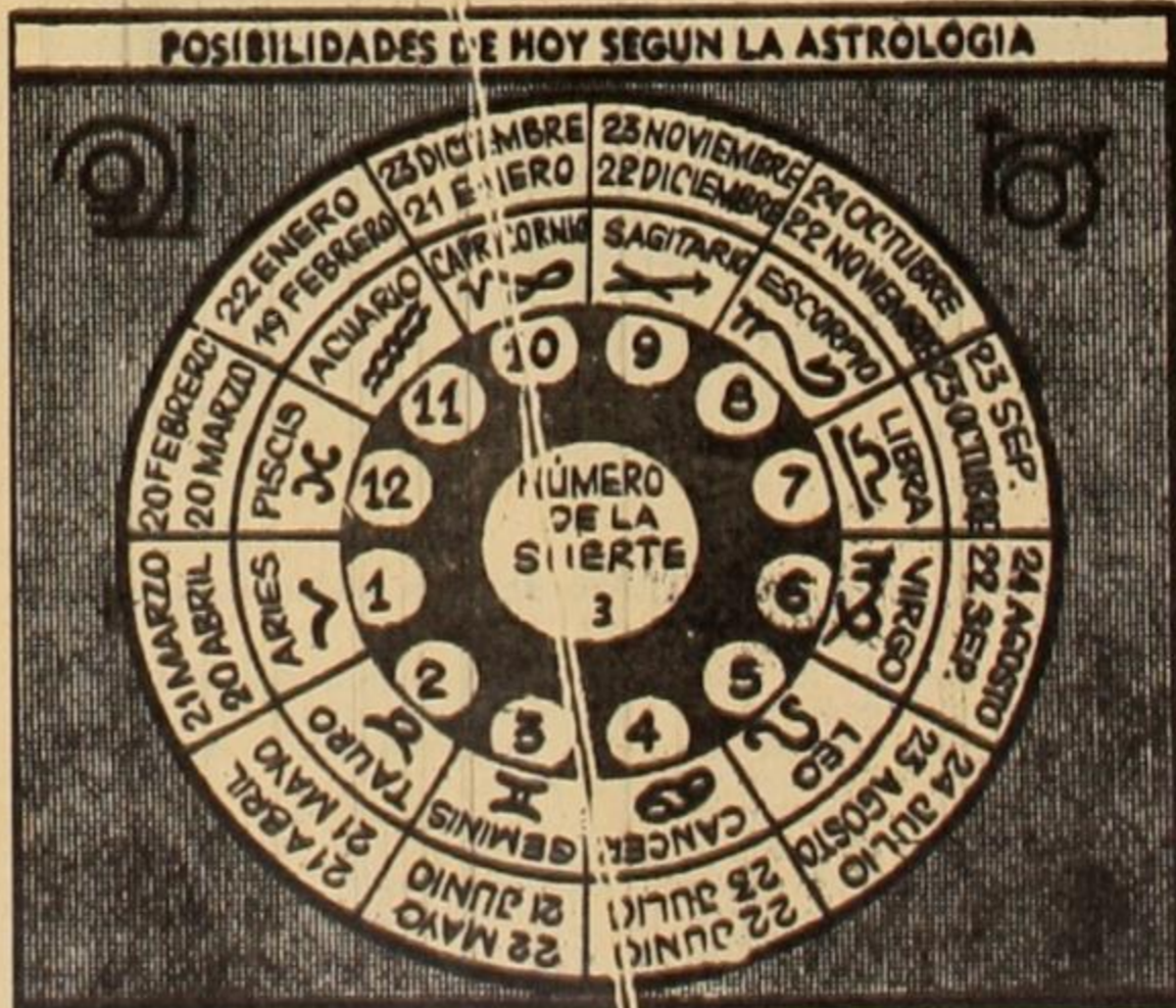
Los horóscopos, otra de las imbecilidades que divulga en estos últimos tiempos la prensa capitalista para consolar frustraciones.