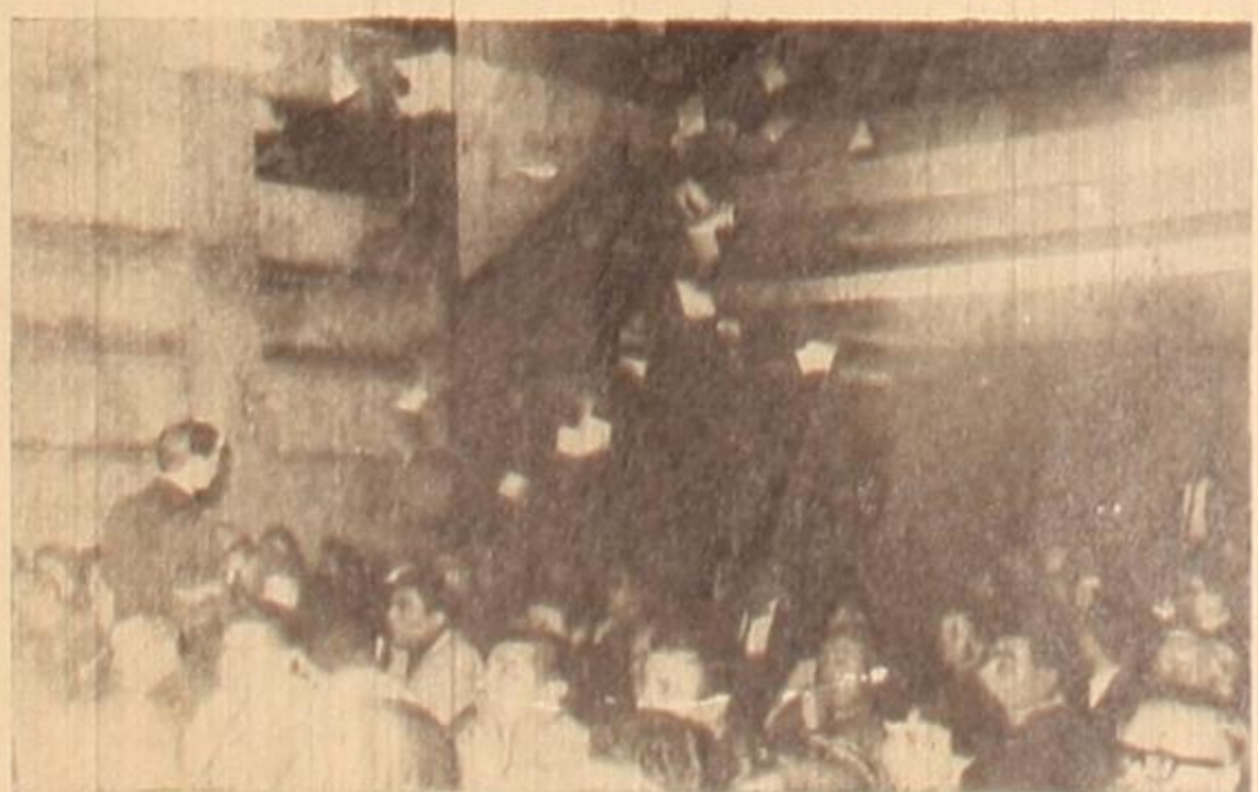
EL 5 DE AGOSTO, el peronismo revolucionario aprueba los históricos documentos y declara su vocero a "COMPAÑERO".