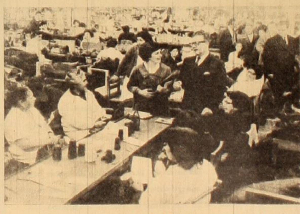
En un gran establecimiento textil, Allende conversa con las obreras acerca de los problemas que afectan a la clase trabajadora de Chile, y aprecia la firme voluntad de lucha que las anima.

BLEST: Durante el actual período preelectoral que vive nuestro país y que es intenso y apasionante, la clase trabajadora, en su inmensa mayoría, está con la candidatura del Dr. Salvador Allende, porque él es el candidato que en forma más cabal encarna las aspiraciones de la masa de nuestro sufrido y paciente pueblo chileno. Nosotros, los revolucionarios de hecho y no los de palabra o teóricos, estamos con el doctor Allende, a pesar de no creer en el proceso electoral burgués y sus maniobras. Trabajamos en el proceso electoral desde nuestras propias trincheras. Desgraciadamente, no existe en nuestra Patria la unidad revolucionaria que exige toda acción insurreccional. Son infinitos los grupos que bajo determinados y viejos líderes, trabajan por su cuenta y riesgo, sin ningún nexo o plan determinado. Cada uno