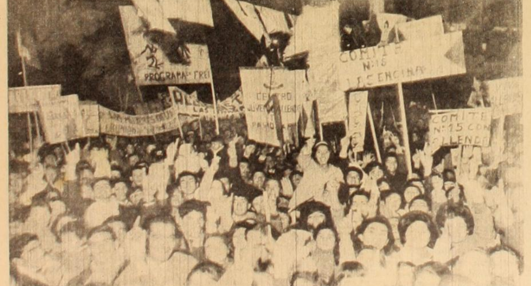
Las calles de Santiago, lo mismo que en todas las ciudades y pueblos del interior del país, son recorridas diariamente por entusiastas manifestaciones como esta expresando su apoyo a Salvador Allende.

BLEST: Pongo término a esta entrevista que tan gentilmente me han proporcionado, enviando un fraternal y cariñoso saludo a todos los compañeros trabajadores del Movimiento Revolucionario Peronista, formulando un fervoroso llamado a todos mis hermanos de clase para que TODOS UNIDOS emprendamos la gran jornada. Esta UNIDAD es necesaria, su no realización retardará indefinidamente este movimiento revolucionario liberador en Latinoamérica. Creo en la sinceridad y honradez de todos los dirigentes políticos de nuestros partidos de izquierda, y por ello es que formulé este llamado, que ha de golpear sus conciencias y sus convicciones de clase.