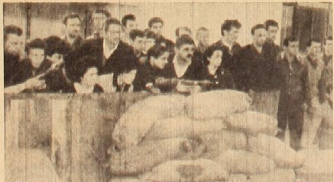
La clase trabajadora lucha contra la opresión y la miseria con todos los medios.