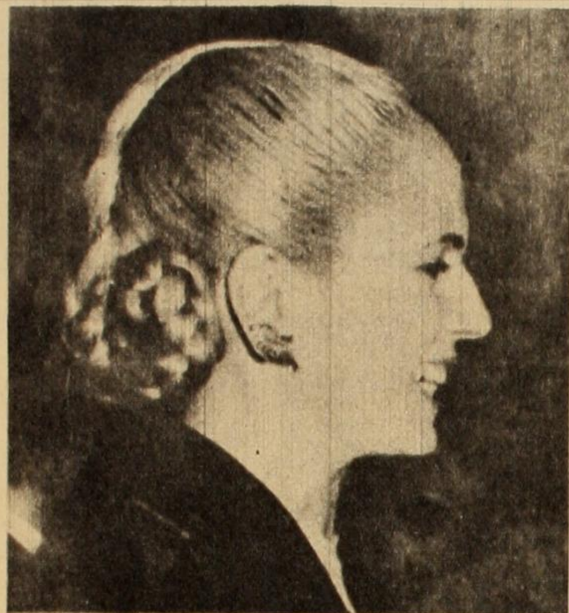
Eva Perón. Vigía de la Revolución y abanderada del Pueblo.

El 22 de agosto de 1961, la burocracia, que había alcanzado una posición amenazante en el seno del gobierno popular, es el instrumento de la traición de la burguesía y de las fuerzas militares influenciadas por ella. La voluntad de las masas reflejada en la exigencia de los dos millones de trabajadores reunidos en la Plaza de la República, que reclamaban la presencia de Evita en la fórmula presidencial al lado de Perón, es contrarrestada por las maniobras de