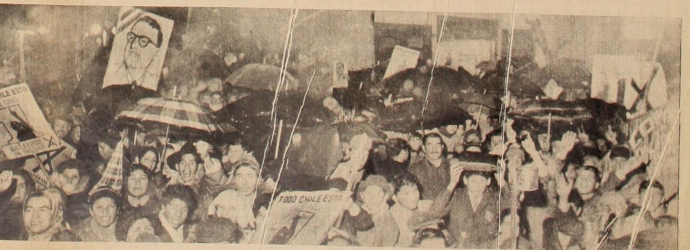
Bejo una intensa lluvia, una entusiasta manifestación popular acompaña con indeclinable fervor al candidato del Frente de Acción Popular.