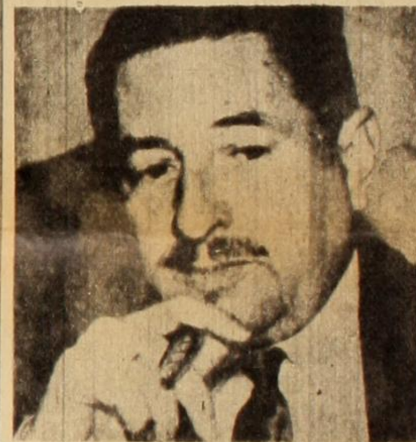
Albiau usufructúa posiciones otorgadas graciosamente por los asesinos del pueblo.