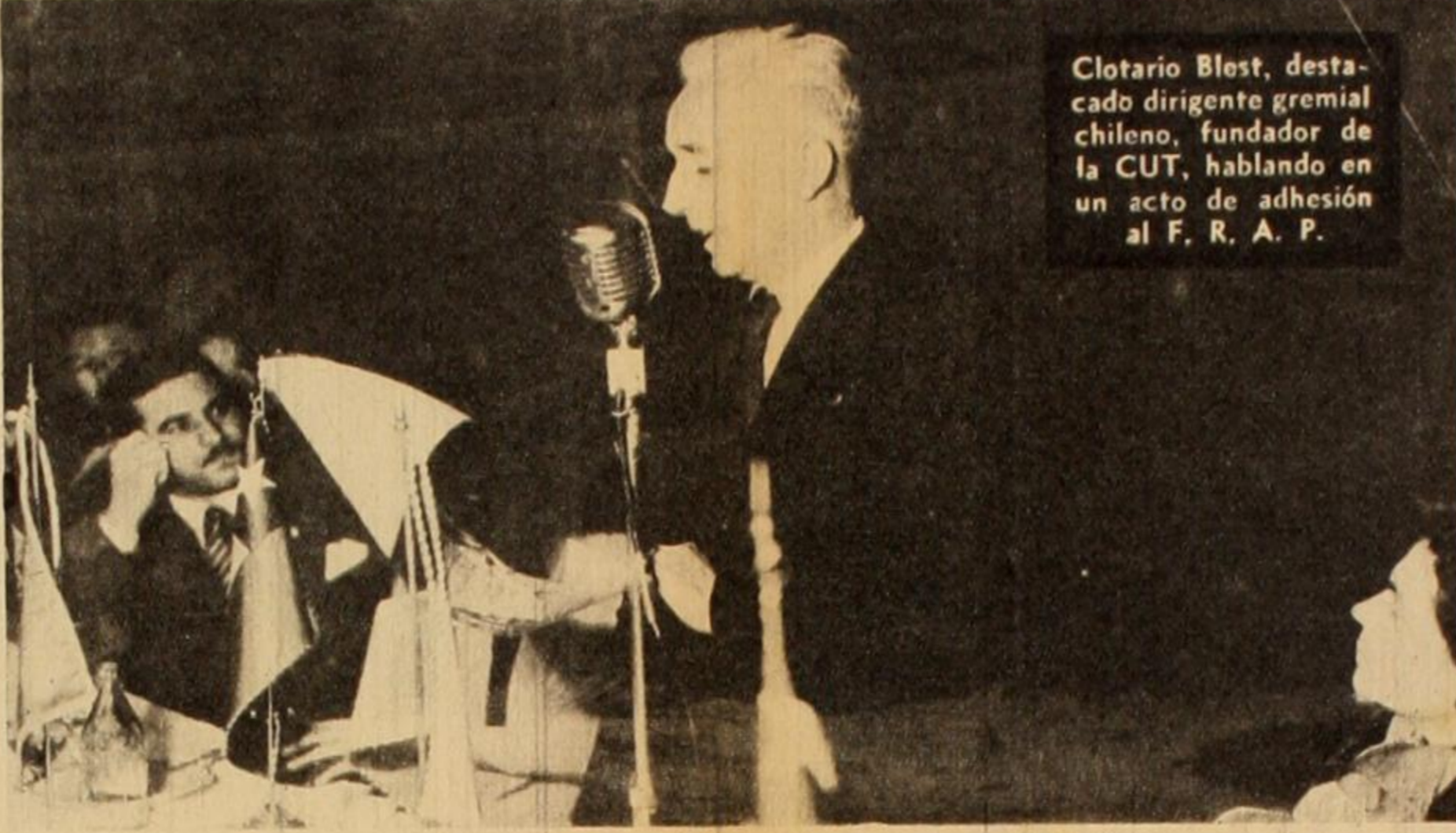
Clotario Blest, destacado dirigente gremial chileno, fundador de la CUT, hablando en un acto de adhesión al F. R. A. P.

Clotario Blest es un viejo y combativo dirigente gremial chileno, de larga trayectoria de lucha. En 1943 fundó la Agrupación Nacional de Empleados Fiscales, de la que es su actual presidente. En 1953 fundó la Central Unica de Trabajadores, siendo su presidente en forma ininterrumpida hasta 1961. Siempre estuvo al frente de la lucha de los trabajadores chilenos contra la reacción, enfrentando la represión. En 1956, cuando el régimen usurpador de la "libertad" fusiló a los militantes peronistas, en nuestro país, expresó la solidaridad de la clase trabajadora chilena con los mártires de nuestro pueblo, exigiendo a los fusiladores que detengan su crimen y viajó a nuestro país personalmente con esa finalidad. En Mendoza fue detenido y estuvo preso varios días. El General Perón le envió una carta —que publicamos en la primera página— agradeciéndole esa actitud.