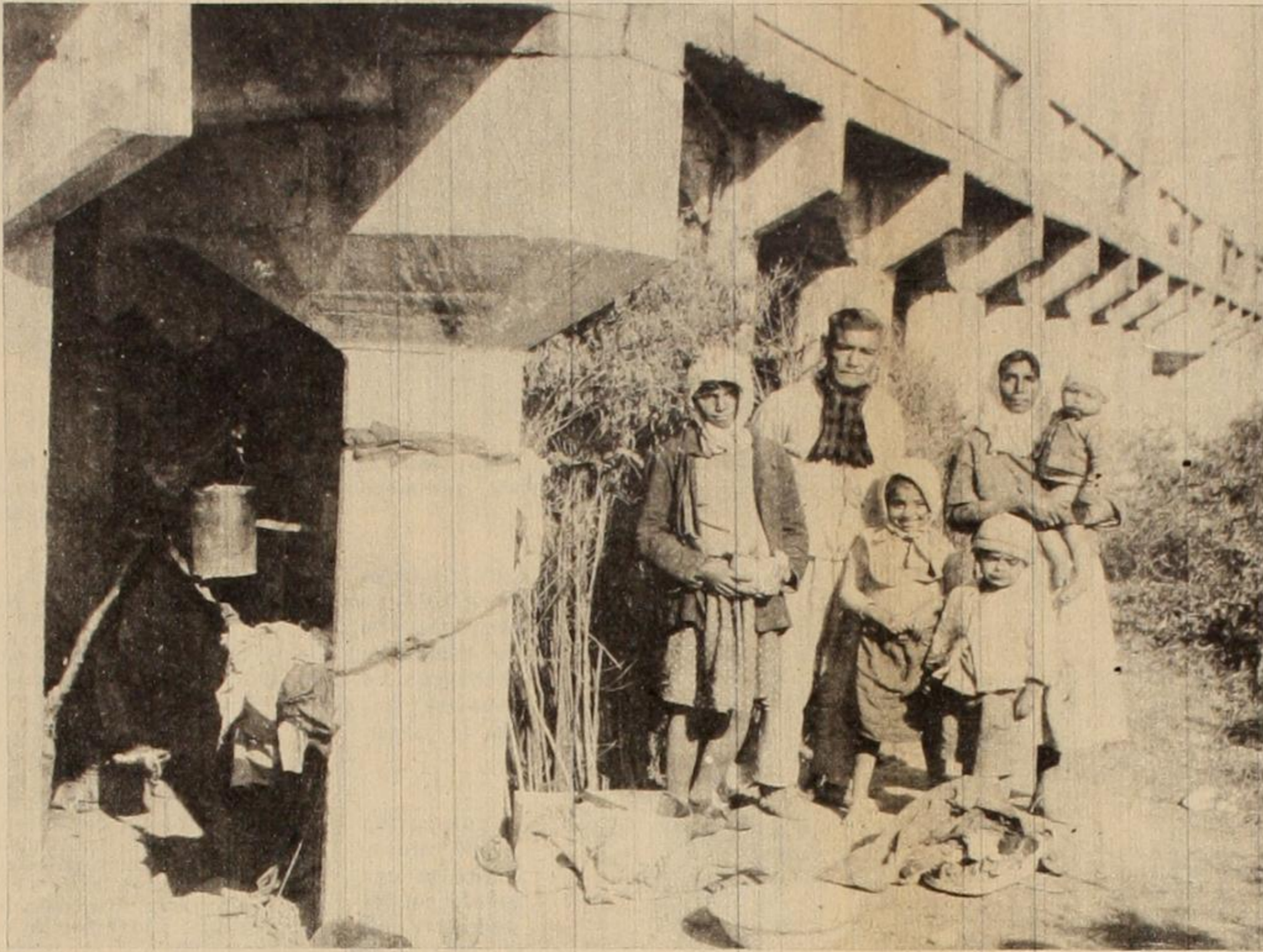
"Si tuviese cien pesos no vendría a pescar, compraría comida". La tremenda miseria del pueblo santiaguense se pone de claro manifiesto en esta nota gráfica...