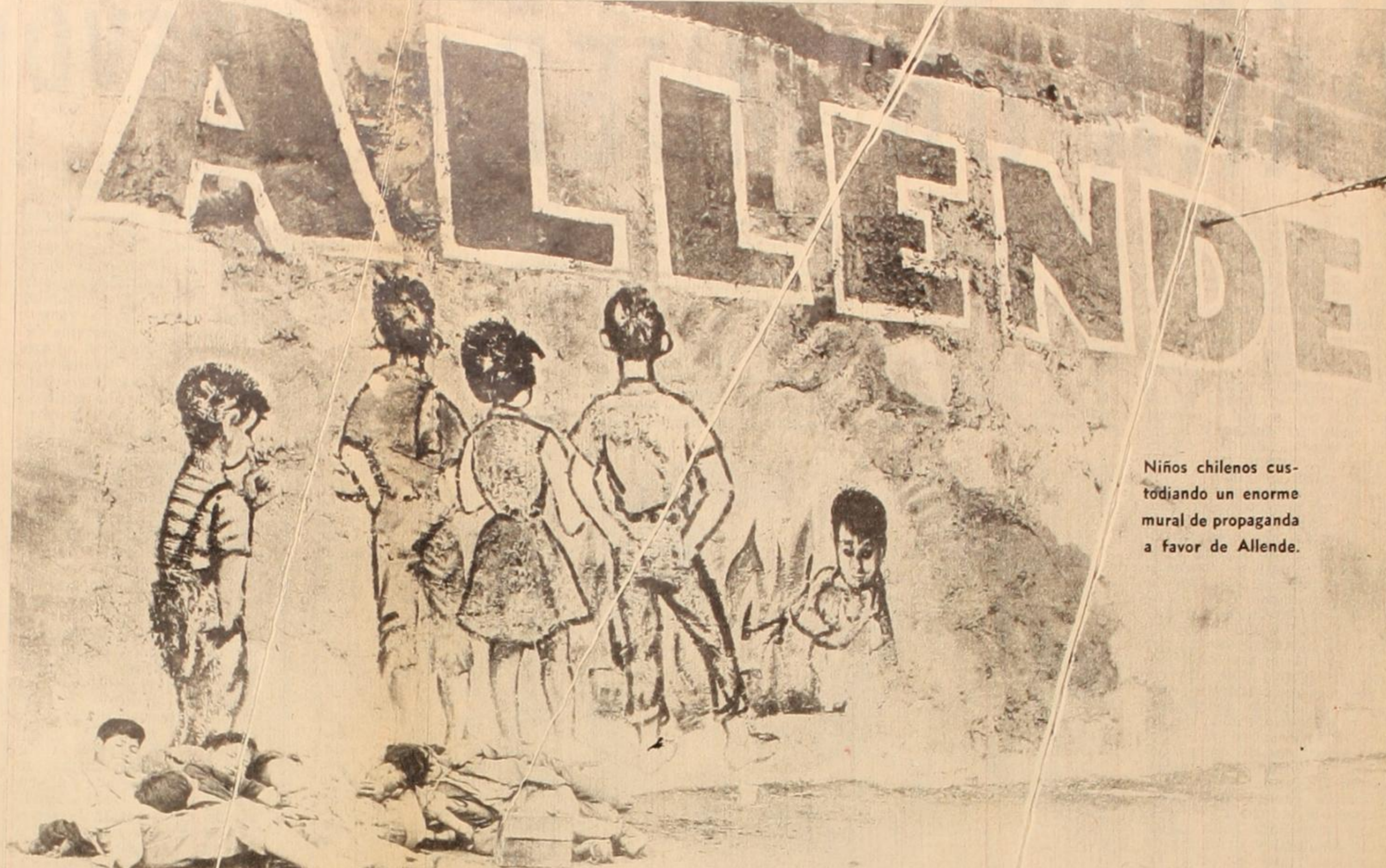
Niños chilenos custodiando un enorme mural de propaganda a favor de Allende.

EN POCAS HORAS MAS, Chile asistirá a una nueva elección presidencial. Tres senadores disputan el favoritismo del electorado. En el subconsciente de la nación flota la idea de que no se trata de una elección más. Se piensa, con temor y con esperanza, con razón o sin ella, que la historia política, social y económica del país entra en un recodo y que es difícil precisar por dónde continuará el camino.