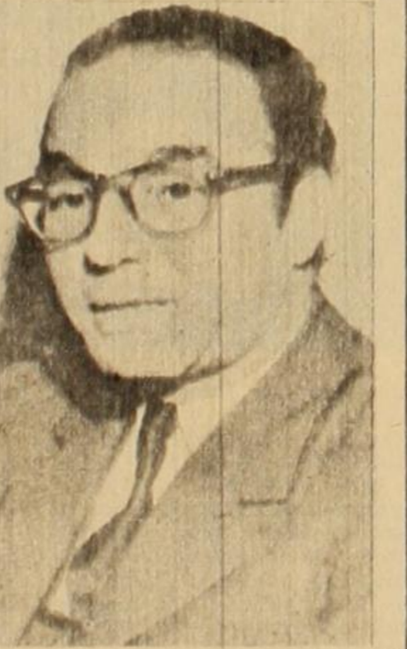
Escritor Félix Luna: Este "respectable" señor de lentos es, además de abogado frigerista, un consciente mentiroso.