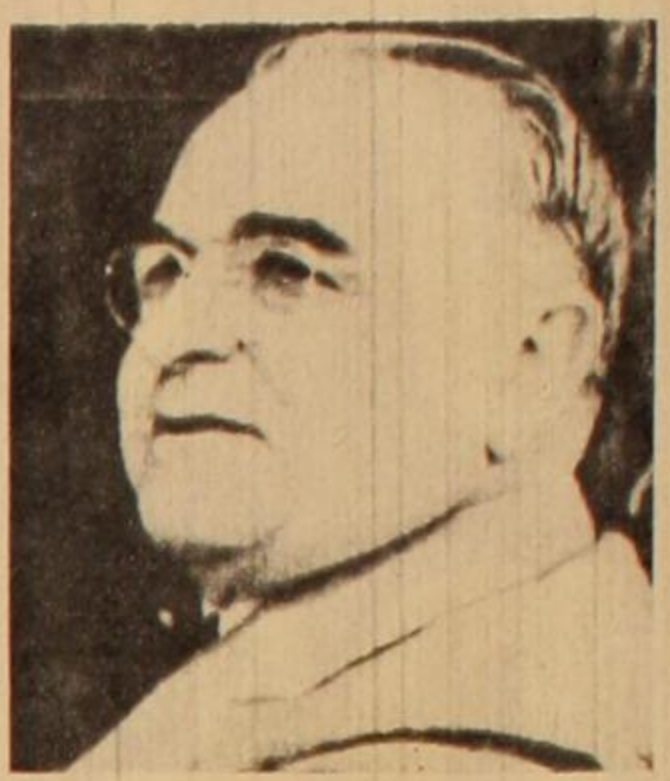
Getulio Vargas, como antes Sandino y Gaitán, entre otros, pagó con su vida la osadía de desafiar al imperialismo yanqui.

A DIEZ AÑOS DE UN CRIMEN DEL IMPERIALISMO YANQUI