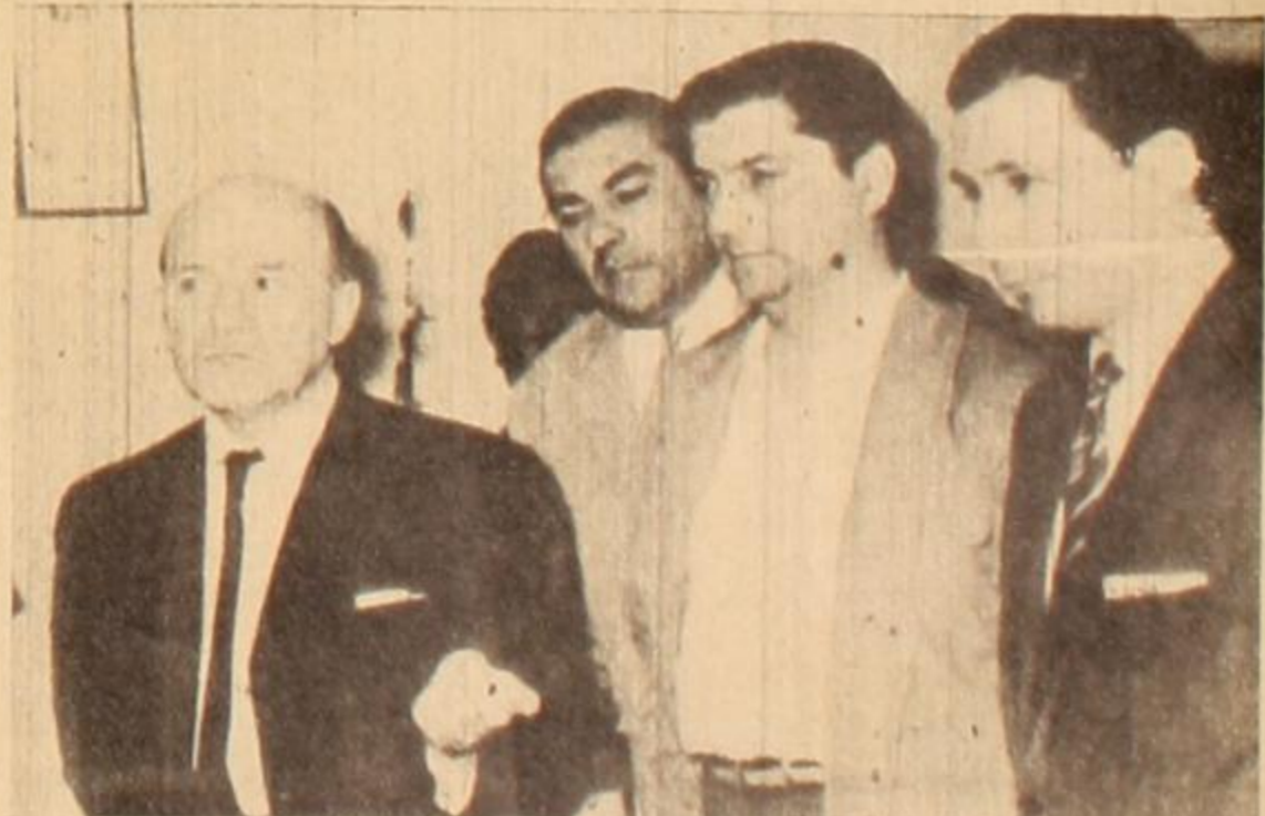
Gazzera con Solano Lima: los tráfugas le abren la puerta a la oligarquía a través del frentismo.