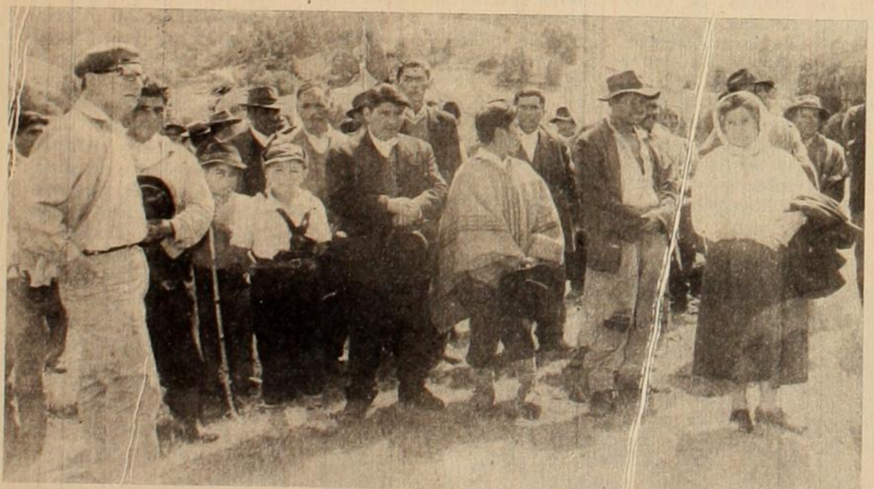
Campeños de Osorno en las tierras que ocuparon, piden armas a Allende para poder defenderlas.

na). Allende es candidato presidencial por tercera vez consecutiva. Frei lo es por segunda vez. Durán nunca ha sido candidato.