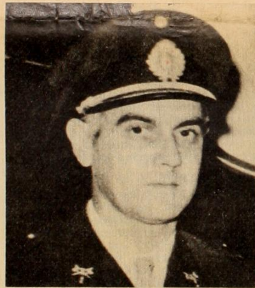
Linus: Ante la vuelta de Peron y el fortalecimiento del sentimiento revolucionario del pueblo, trata desesperadamente de acelerar la represión.

El gobierno de la "fraudeocracia", embretado en sus propias contradicciones, producto de los intereses reaccionarios encontrados que representa, ve aproximarse inexorablemente el momento en que tenga que hacer frente a una situación que es incapaz de afrontar y que amenaza su endeble subsistencia. Los sectores que responden al imperialismo yanqui, que detentan el control efectivo del ejército de ocupación, base de sustenta-