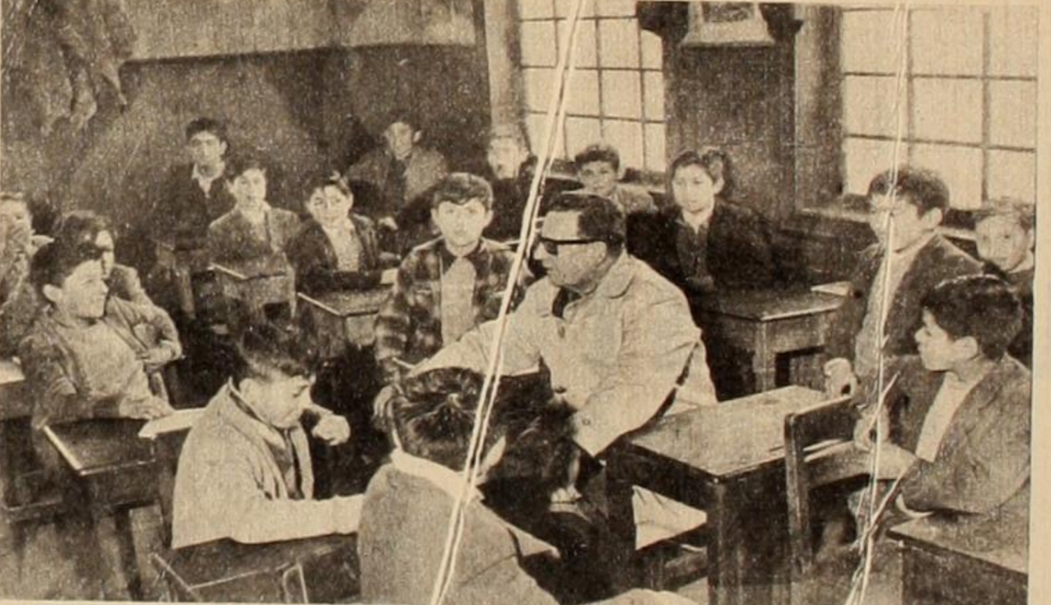
Allende en una escuela, conversa con los pequeños alumnos. "Los únicos privilegiados serán los niños", declara el candidato de FRAP