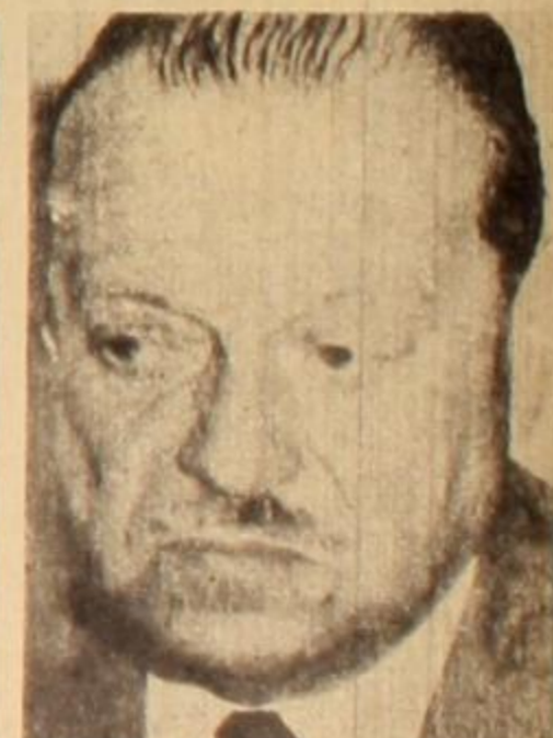
Vador e Iturbe: nuevos mentores de la conciliación con las fuerzas de ocupación.