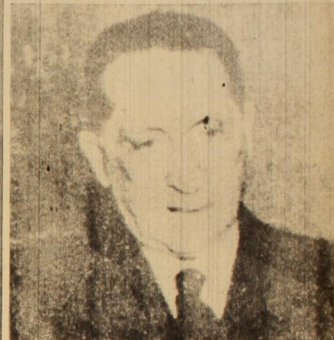
El símbolo máximo de la infamia y la traición de la burocracia: Teisaire.