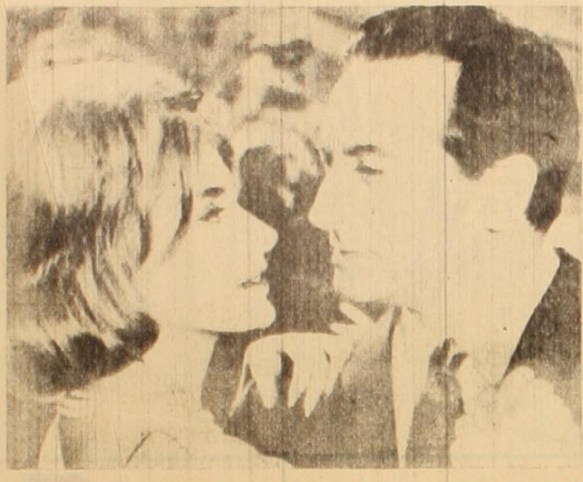
Una escena de "Mujeres perdidas", reciente estreno del moribundo cine argentino. Una vez más, éste demuestra su absoluta vacuidad.