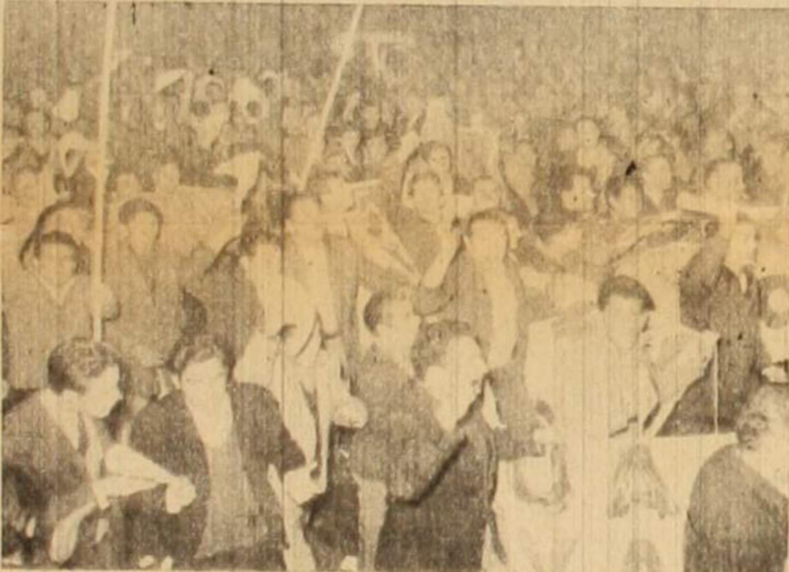
Las masas en la calle son la garantía del triunfo sobre la reacción.