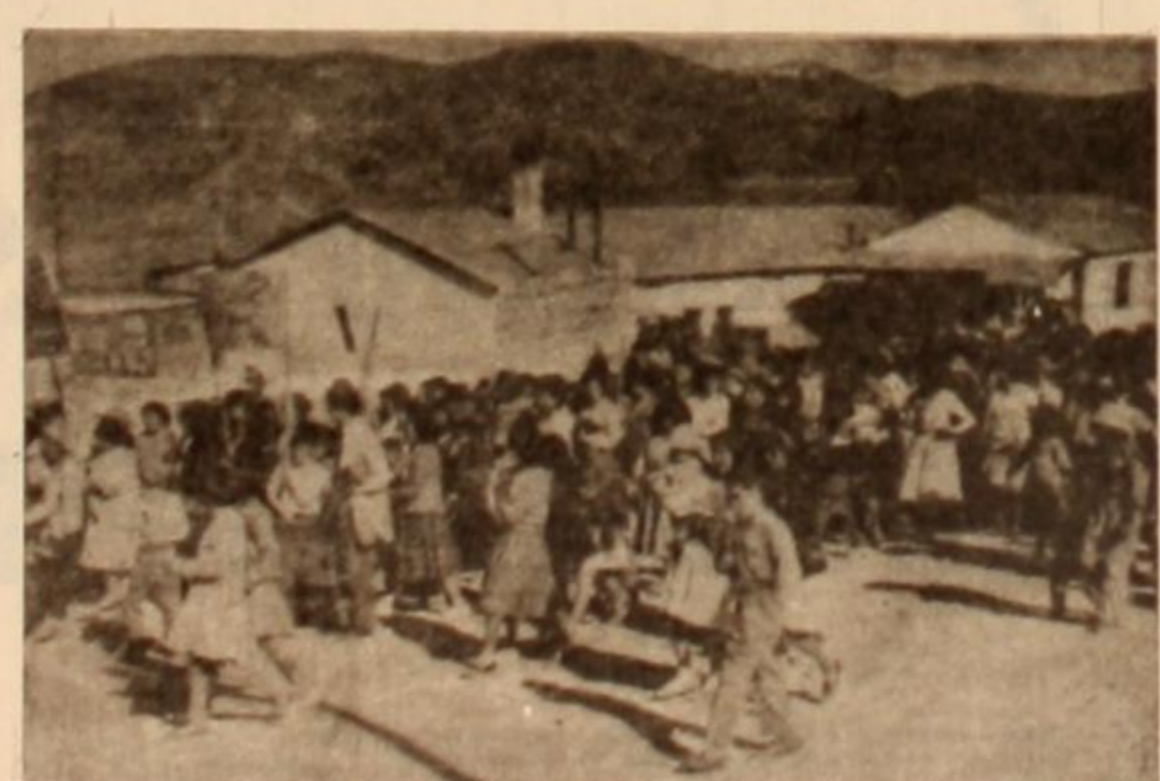
Los obreros de El Aguilar y sus familias, hombres mujeres y niños argentinos, bajan de las sierras, sobre la capital de Jujuy...