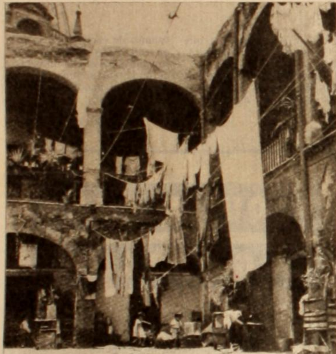
Sórdidos conventillos donde viven hacinadas decenas de familias en condiciones de insoponible promiscuidad.

respetado celosamente la "tesis" de la ganancia empresarial. Nos hemos puesto, si se quiere, en el punto de vista "capitalista", ya que, al fin de cuentas, el parasitismo de la vivienda exige mayores salarios inútiles para alimentar a los rentistas, acrecienta los costos de capitalización. En todo el análisis, asimismo, no nos hemos salido del marco injusto de la propiedad privada, reaccionando, precisamente, contra un régimen que despoja de vivienda a las 9 décimas partes de la