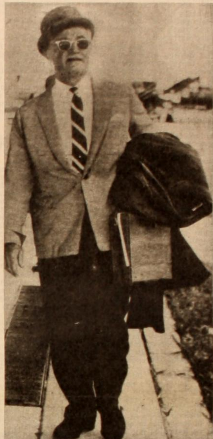
Mc Clintock: o termina de irse, o el pueblo lo echará como le corresponde: ¡a patadas!