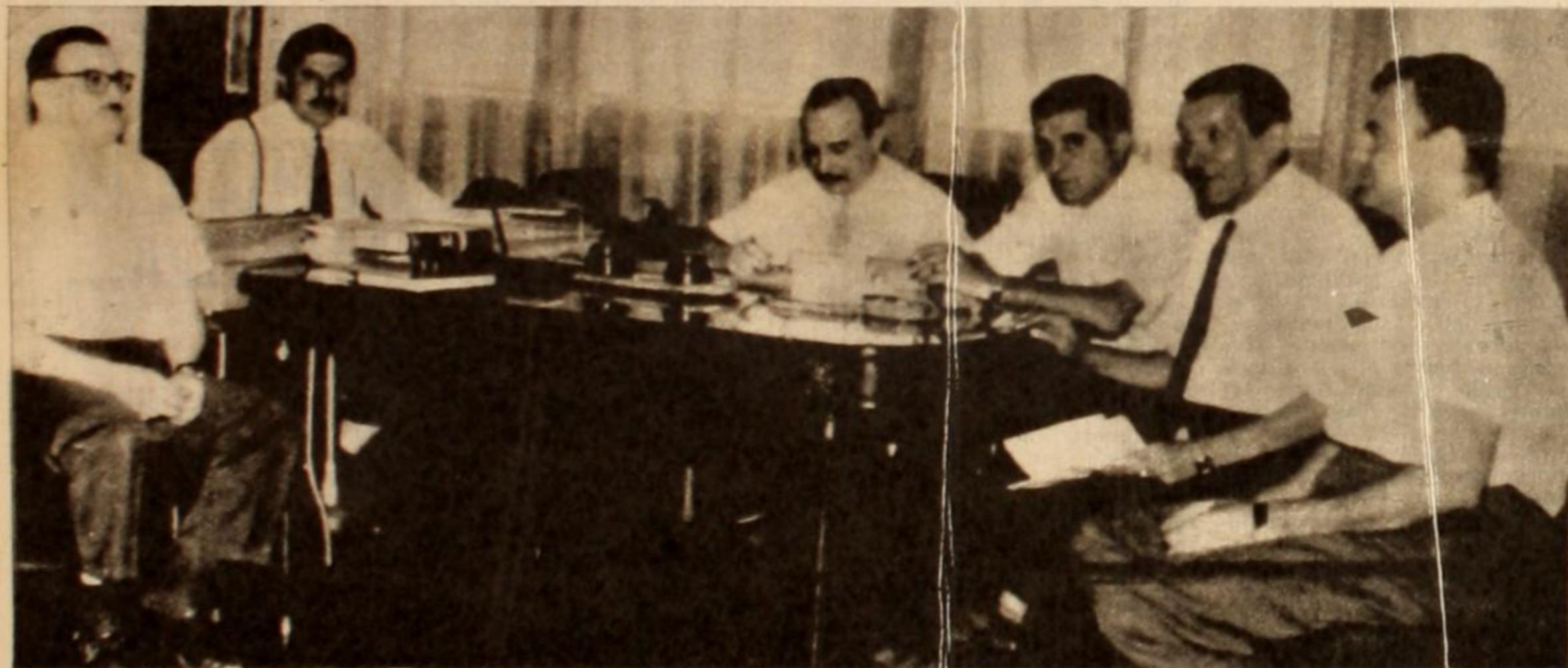
La burocracia conciliadora que aún controla la C.G.T., contra la voluntad de las bases, ha dado un nuevo paso atrás, postergando el Plan.