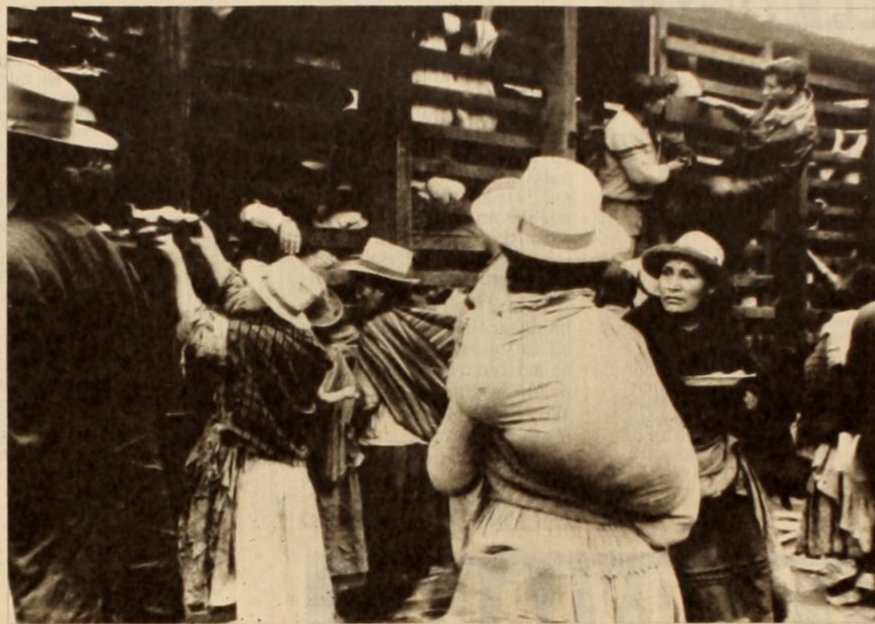
Este documento gráfico y las manifestaciones de un testigo directo denunciadas en esta nota, demuestran las promesas hechas al embajador del país hermano, Bolivia...