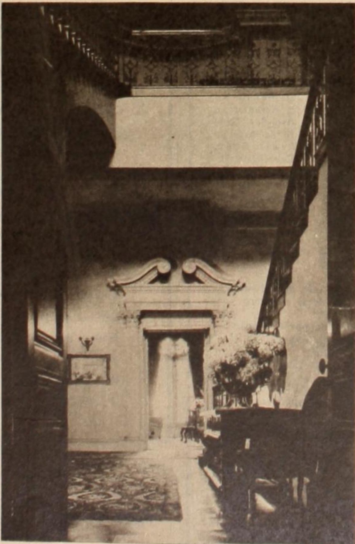
Insolentes pisos de lujo. Laberintos solitarios para uso de poquísimas personas.

alrededores, calculadas a 50 pesos diarios por cabeza, obtenemos unos 750 millones mensuales, unos 9.000 al año, más de 80 millones de dólares.