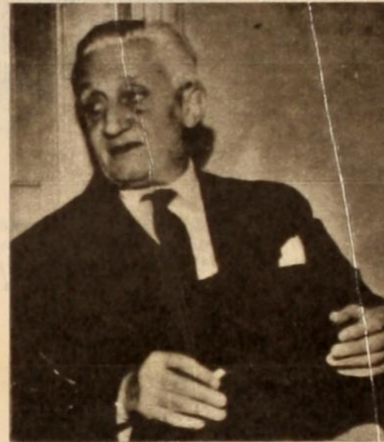
Illia: presidente surgido del fraude y al servicio de intereses imperialistas, no puede defender nuestra soberanía.