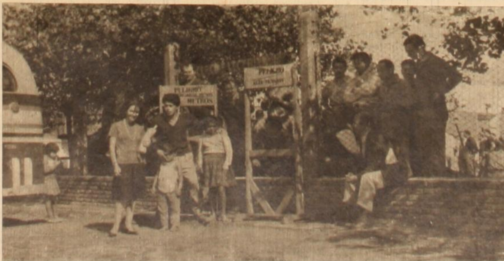
La defensa fue organizada minuciosamente. Varios piquetes se distribuyeron en vigilancia. He aquí un grupo de obreros que blanden botellas con un cóctel" de conocido efecto persuasivo.

LOS METALÚRGICOS de San Martín han escrito una nueva página de oro en la trayectoria del movimiento obrero argentino. La acción tuvo lugar en la popular barriada de Villa Maipú del partido de San Martín. Allí, rodeada de otros monstruos fabriles se encuentran las plantas de la firma CONSTRUCCIONES ELECTRICAS ESPECIALES (C.E.E.), una de las más importantes empresas en su especialidad en América latina. Para "no ser menos" que muchos industriales de esta época de crisis, ante diversas dificultades económicas, la patronal optó por "cortar el hilo por lo más delgado", es decir, que los obreros que ya venían sufriendo meses y meses de sueldos impagos se aguantaran despidos en masa. Lo más delgado le resultó demasiado grueso a la patronal sin escrúpulos, pues los obreros atentos como siempre a la defensa de sus intereses de clase, tomaron la fábrica en forma sorpresiva, reteniendo a 32 rehenes de la empresa, entre ellos algunos directivos y patrones. La sola presencia física de 530 obreros bastó para reducir cualquier intento de rebeldía, pero ello no era todo.