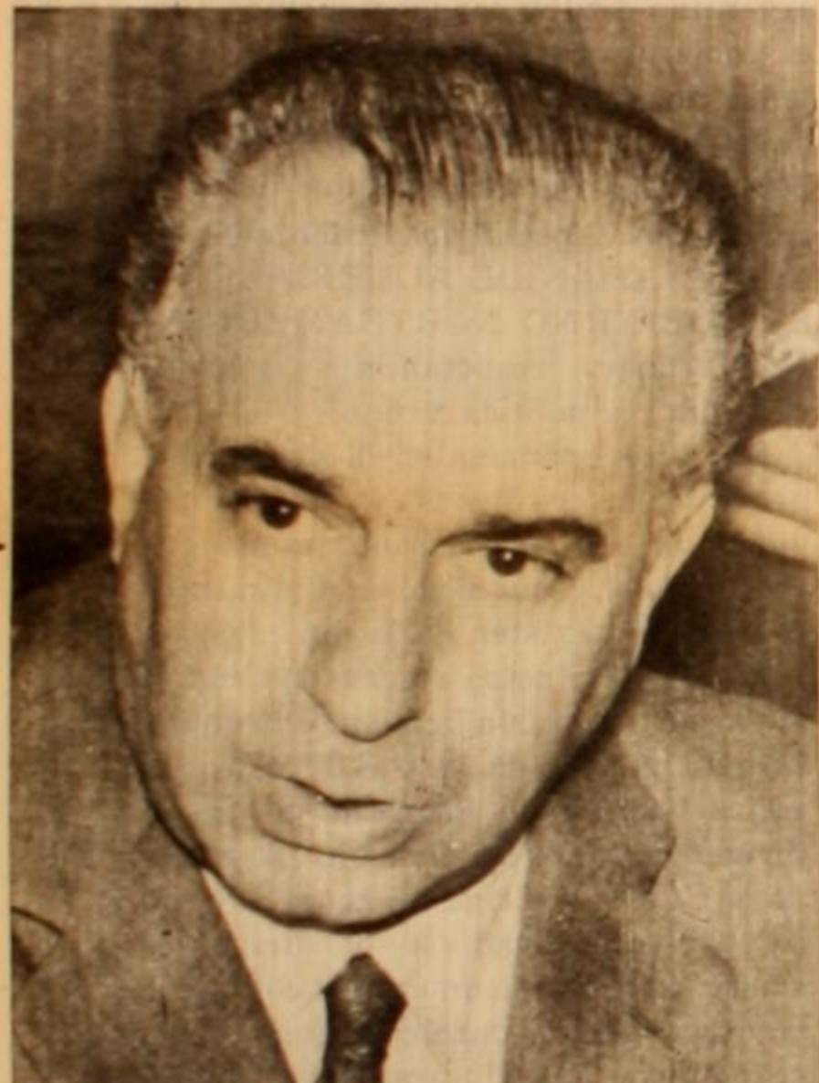
Frigerio continúa haciendo sus negocios. Una vez más fracasará.

Fracasado su intento de anular "políticamente" al Movimiento Mayoritario argentino, llevándolo por el camino del compromiso, intentarán aplastarlo por la fuerza de las armas. Pero sean cuáles sean sus manejos y sus métodos, serán inevitablemente derrotados. El pueblo argentino, dirigido por su Conductor, General Perón, ya ha iniciado el camino hacia la revolución, que culminará en la total liberación de nuestra Patria.