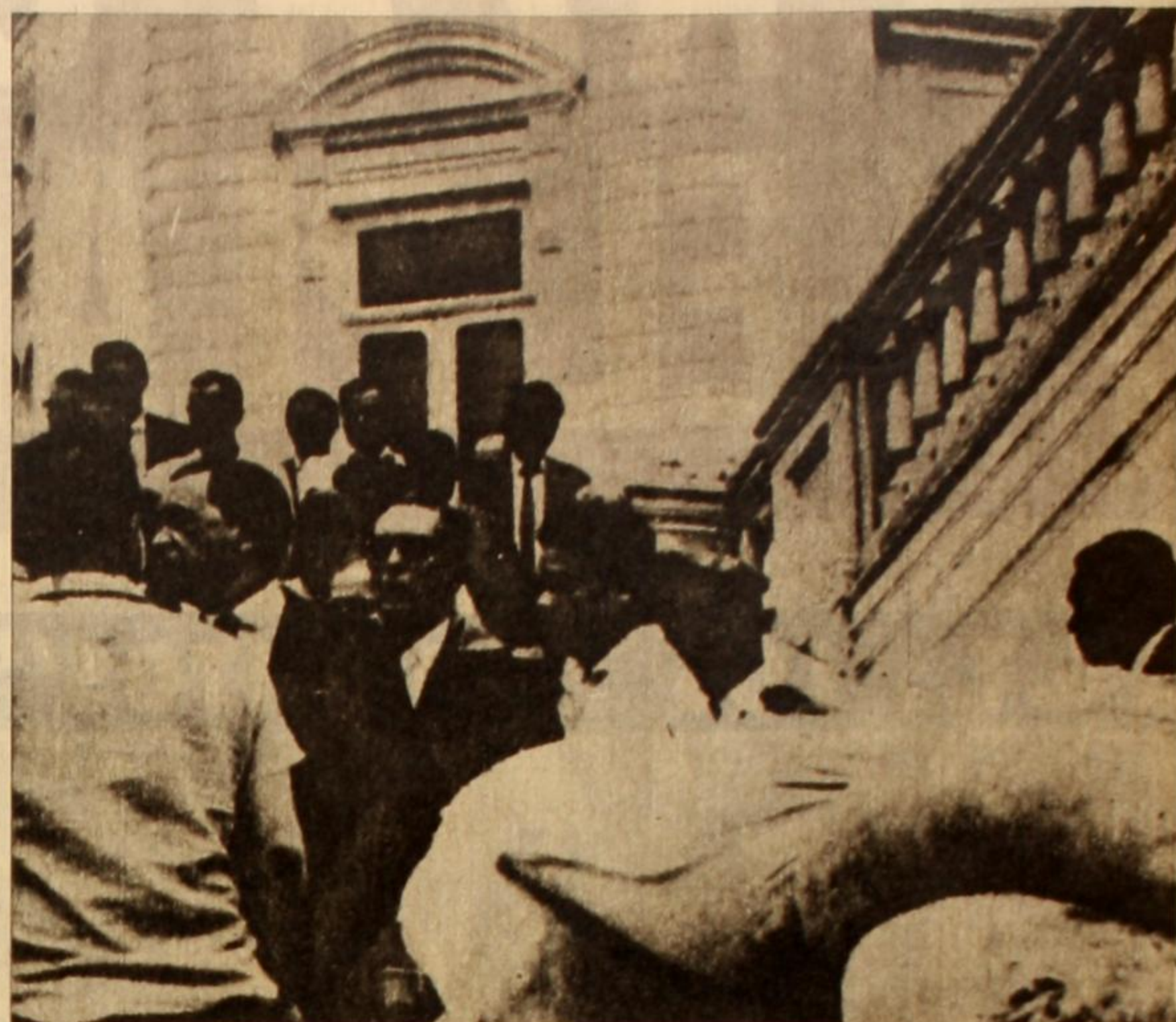
Ahora Lacerda, tras abatir a Getulio, Janio y Jango, se prepara a eliminar al "integracionista" Juscelino.