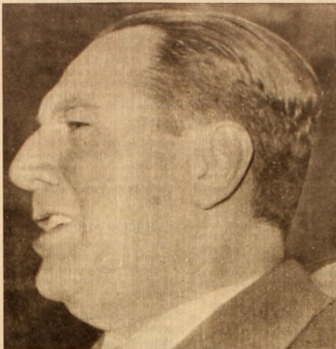
Perón ha despedido literalmente a puntapiés a los emisarios enviados por el régimen

En el otro campo, la angustia es más o menos la misma. Ya se han puesto en marcha todos los mecanismos para tratar de reflatar el "frentismo", esta vez bajo el nombre de "frente de opo-