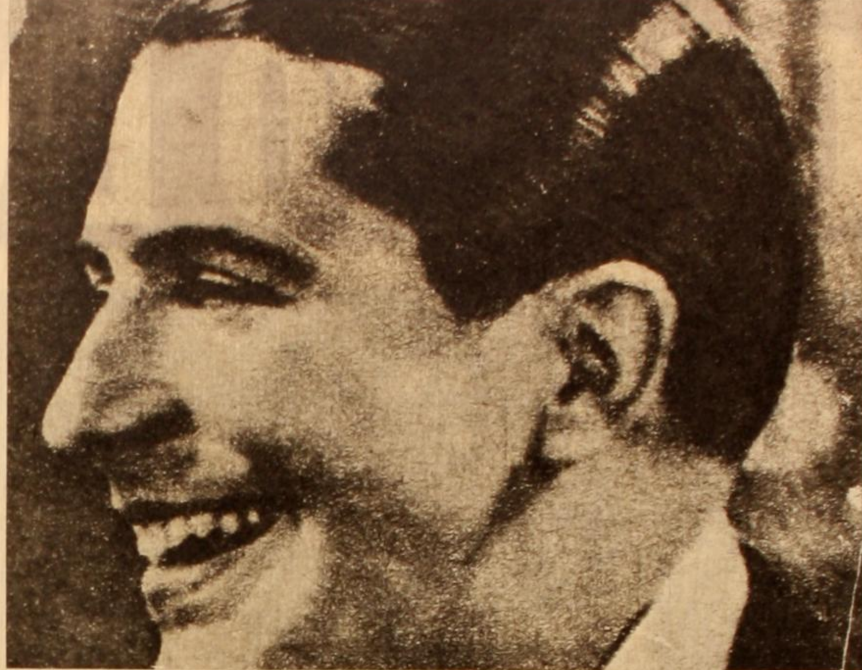
Carlos Gardel: es un símbolo de la riqueza del acervo popular.

Si bien De la Púa trató de interpretar a la clase trabajadora, fracasó lamentablemente en su intento. Prueba de ello es su poesía "Fabrica", donde se presenta a la esforzada trabajadora bajo un ropaje de Margarita Gauthier, lacrimógeno e insensato: "...musa de arrabal, musa mistonga, triste fruto del vicio y la pasión / naciste destinada a la milonga / al arruyo de un tango de salón. Es decir que la inconsistencia ideológica de Muñoz, lo llevaba a transmitir sensaciones del arrabal, sus cafishios o cualquier otro tipo de malandras a un tema que por su índole debía tener otra vibración menos radioteatral.