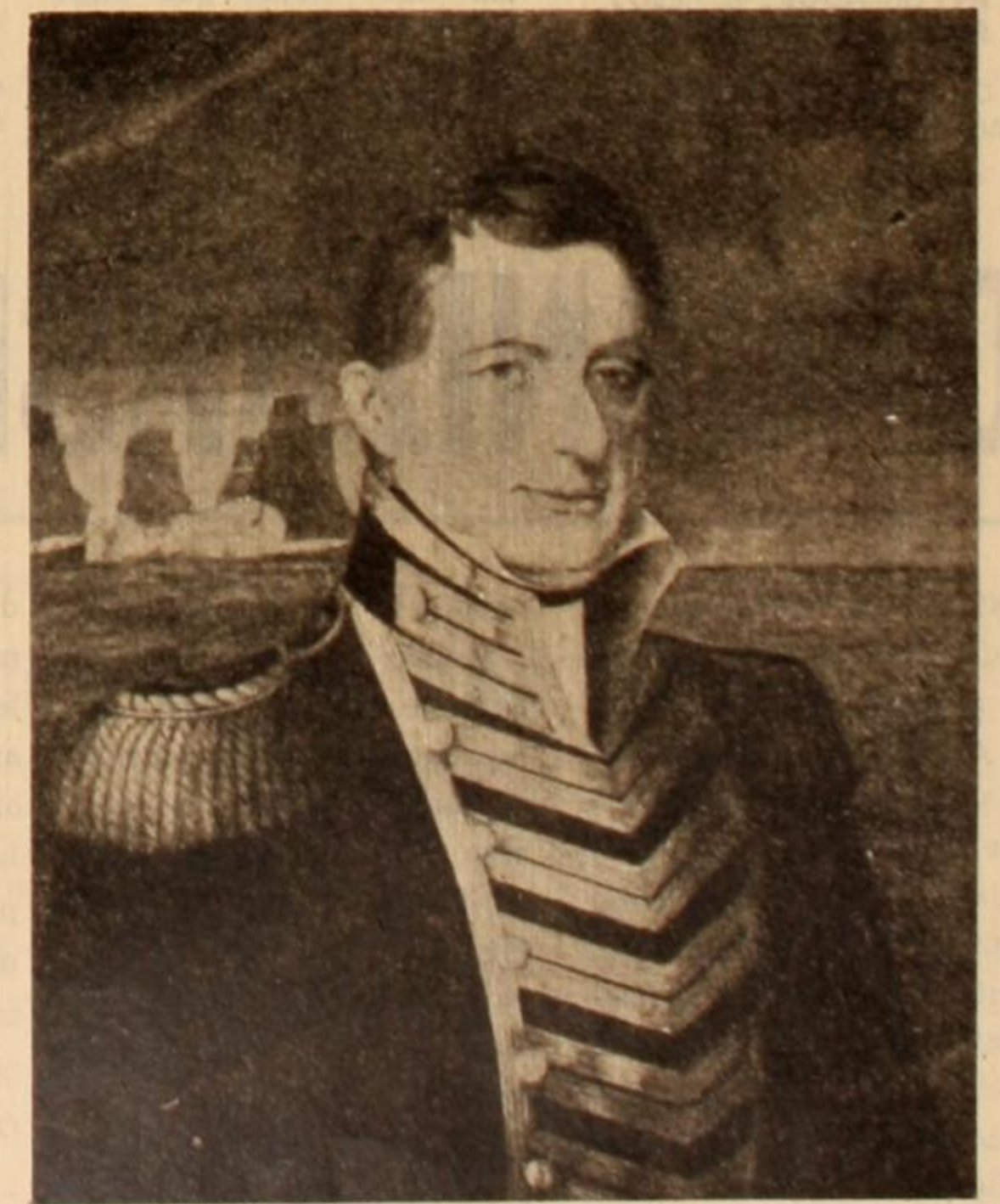
El Alte. Brown, defensor de la soberanía nacional, cuyo sable ha sido robado por el Gral. Lanusse, siendo esta reliquia nacional objeto de manoseo, como resultado de la sucia disputa entre facciones de las Fuerzas Armadas.

Los compañeros de la Juventud Universitaria Peronista nos hicieron llegar una denuncia sensacional de gravísimos alcances. ¿Quién secuestró el glorioso sable del almirante Brown? Los esbirros militares del régimen son responsables de una afrenta al honor nacional. Usan el sable del prócer para ventilar sus miserables rencillas de facción. Las fuerzas de ocupación deberán responder también por esto.