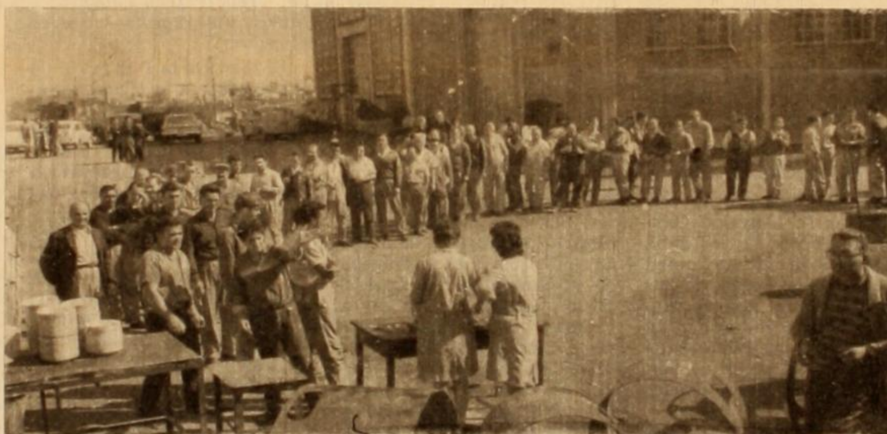
Hora del rancho. Los obreros que ocupan la fábrica, forman una disciplinada fila para recibir su ración. Por una vez en su vida, los patrones capturados como rehenes, tuvieron que comer también la misma comida de sus obreros.