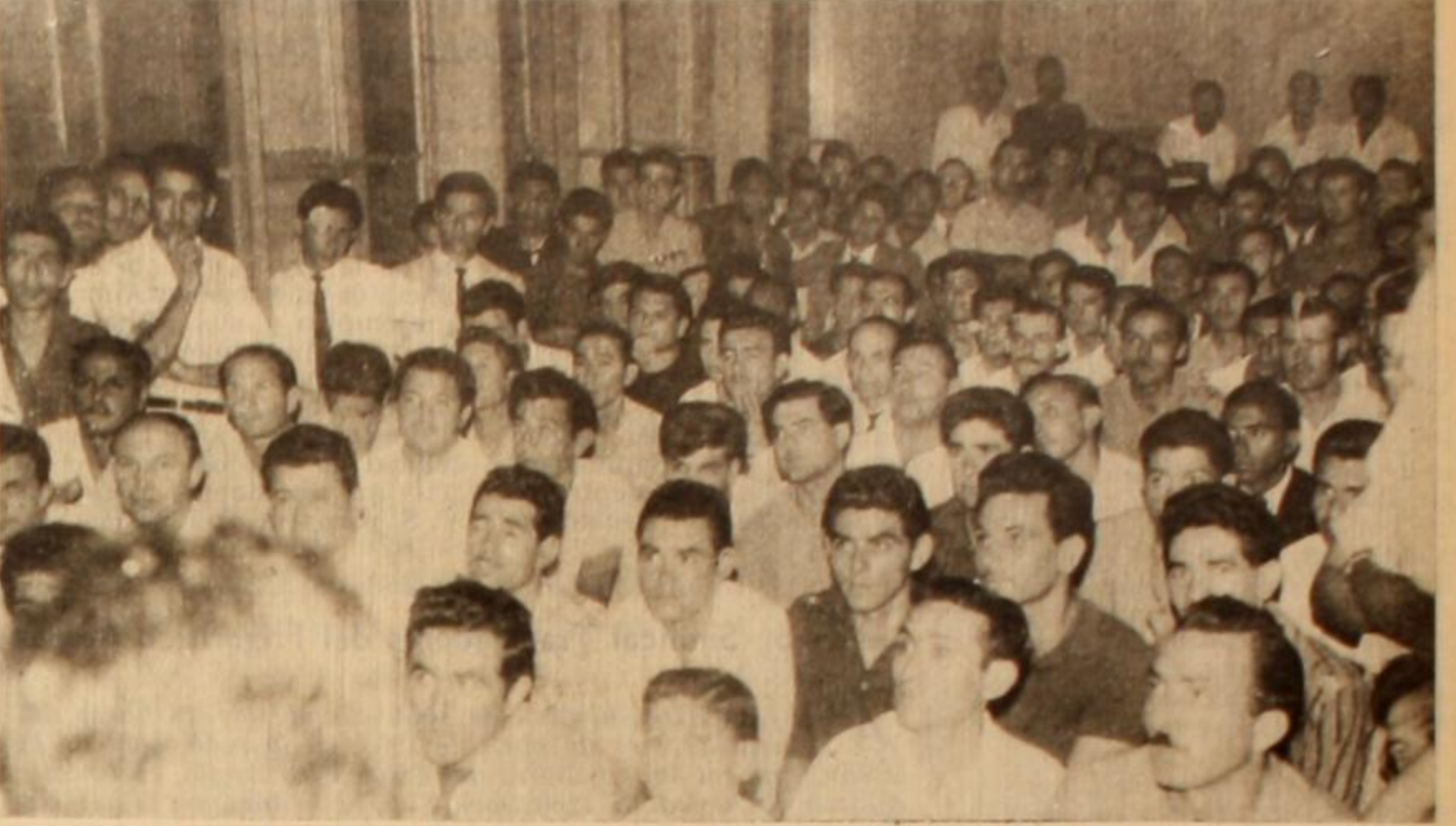
Obreros cesantes de la fábrica Kaiser, en el curso de una asamblea realizada hace poco tiempo. La Lista Blanca, "Agrupación 18 de Marzo" luchará contra los traidores, quienes quieren entregar al gremio y servir al juego de la patronal, en contra de los intereses, obreros.

sibilidades de adquirir conocimientos y el camino para llegar a la dirección del gremio, se sumarán a nuestro accionar porque seben como nosotros, que para servir con honradez a la SMATA hace falta una SALUDABLE RENOVACION DE VALORES EN LOS CUADROS DE CONDUCCION.