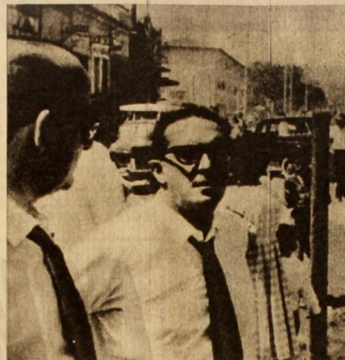
Carlos Lacerda: su actitud ultrarreaccionaria alentó al último golpe gorila.

El RÉGIMEN REACCIONARIO impuesto por los gorilas brasileños, sigue ejecutando minuciosamente su plan de devastación y terror.