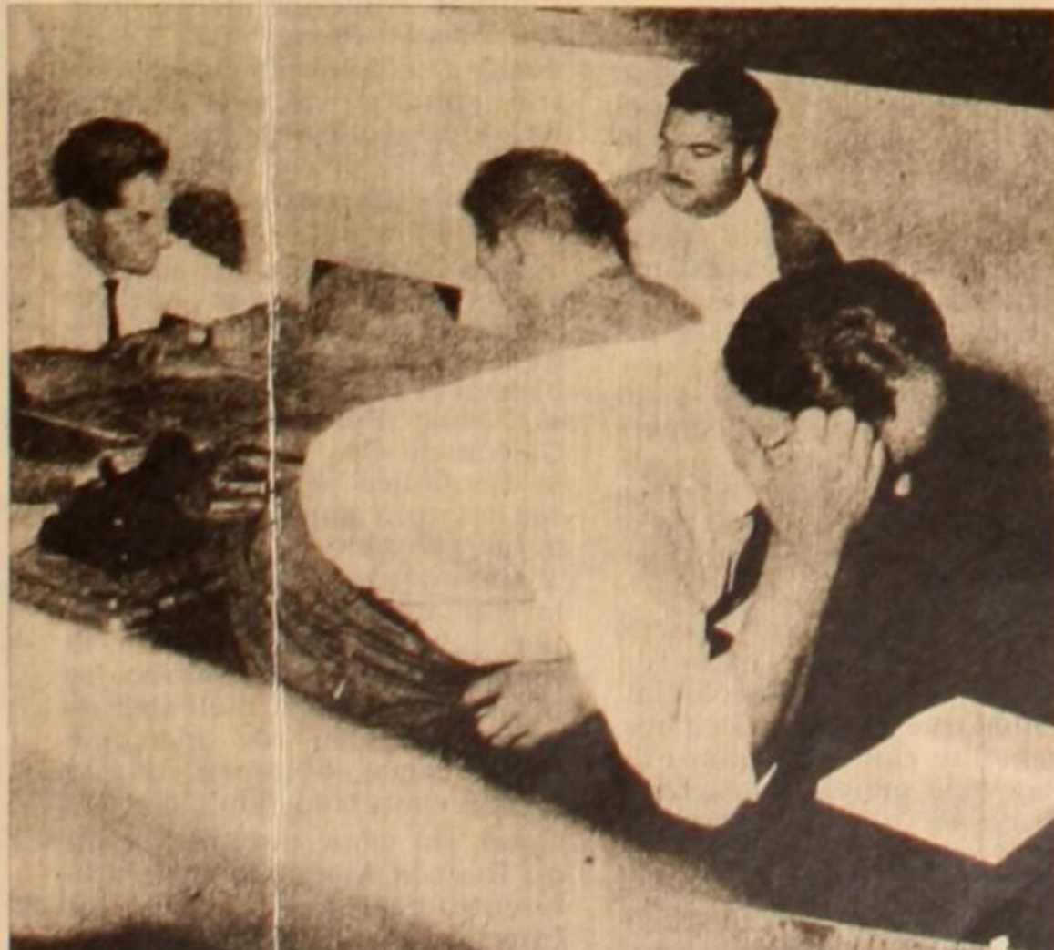
Los representantes de la patronal en un trance difícil, por pasarse de vivos. Durante dos años se negaron sistemáticamente a pagar lo que debían. Después de tres días de "régimen militar", aunque tratados con toda corrección, encontraron por fin los 15.000.000 que no habían hallado antes para pagar su deuda con el personal.

UNA VEZ MAS QUEDA DEMOSTRADO: LAS BASES, UNIDAS Y ORGANIZADAS SON INVENCIBLES CUANDO SE DECIDEN A LA ACCION, POR ENCIMA DE LAS DIRECCIONES CONCILIADORAS.