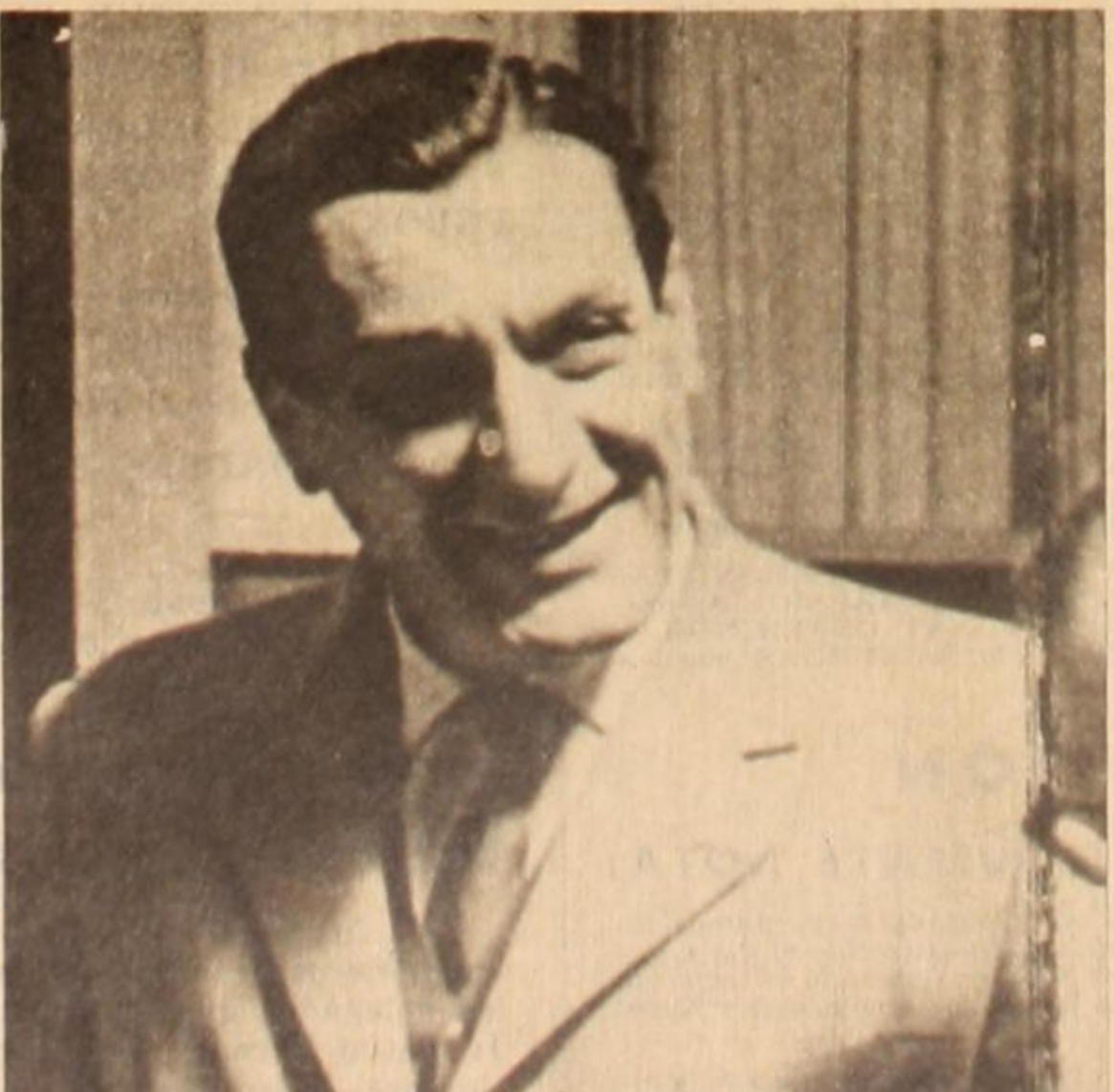
Ribas: los "independentes" no lo son tanto. Detrás suyo se mueven los hilos de los intereses del imperialismo británico.

Agrupación Blanca y Negra de la Carne de Rosario