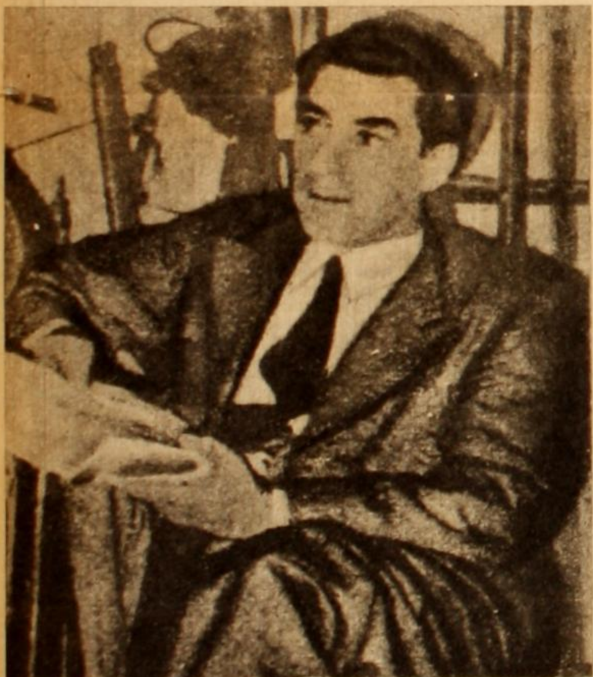
Roberto Arlt: llevó el lunfardo en la literatura a su máxima expresión.

Muñoz tuvo una noche exuberante. su abuso por las bebidas alcohólicas le produjo un mal incurable que lo llevó a la tumba. Murió el 9 de mayo de 1950. Se nos hace que algún reo, en cualquier gayola, debe haberlo llorado. Por sus sentimientos reos expresados en lunfardo mediante sus poemas bajos, Carlos de la Púa integra la antología del lunfardo por derecho propio. El tiempo ha traicionado sus temas. Sólo podemos apreciarlo en sus radiografías del suburbio, grávidas de vida rante y también de calidad parcialmente cristalizada. Sin embargo, creemos que su aporte al enriquecimiento de la lengua dialectal lunfardesca es inconmensurable, y llega a superar a su contribución poética. Por lo demás, y con sus versos en nuestras manos, podríamos parafrasearlo: "Vivirás, Carlos de la Púa, mientras taje la grella de la crencha engrasada / mientras viva un poeta / un ladrón y una puta". Así de fuerte, como al Malevo Muñoz le hubiera gustado.