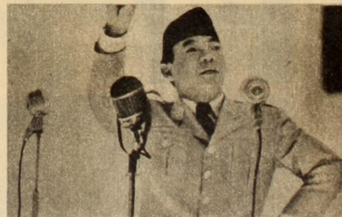
Sukarno, el líder indiscutido de Indonesia enfrenta nuevamente a la conjunción tramada contra su pueblo por los ingleses que se escudan en Malasia. Defiende no sólo su integridad territorial sino también la lucha por la liberación de todos los pueblos oprimidos contra usurpaciones colonialistas.

Por eso la solución propuesta por Djakarta ha sido: un plebiscito en Sabah y Sarawack para que sus habitantes determinen libremente si desean pertenecer a la Federación. Indonesia no vaciló en pedir que fuera la ONU la que supervisara el referéndum. Pero esa iniciativa —significativamente— nunca fue aceptada por Inglaterra y su alter ego, la Federación Malaya que incorporaron a Borneo del Norte a la Federación, luego de lo que ellos denominaron "sondeos de la opinión pública", y fue neutralizada por las potencias imperialistas que usan a las Naciones Unidas como su instrumento. A todo esto, hace unos meses, Bobby Kennedy realizó una gira por la zona llevando bajo el brazo una solución de recambio para tratar de negociar la intransigencia indonesia sobre el problema; la creación de Mafilindo, extraño matete bajo la forma de una federación que