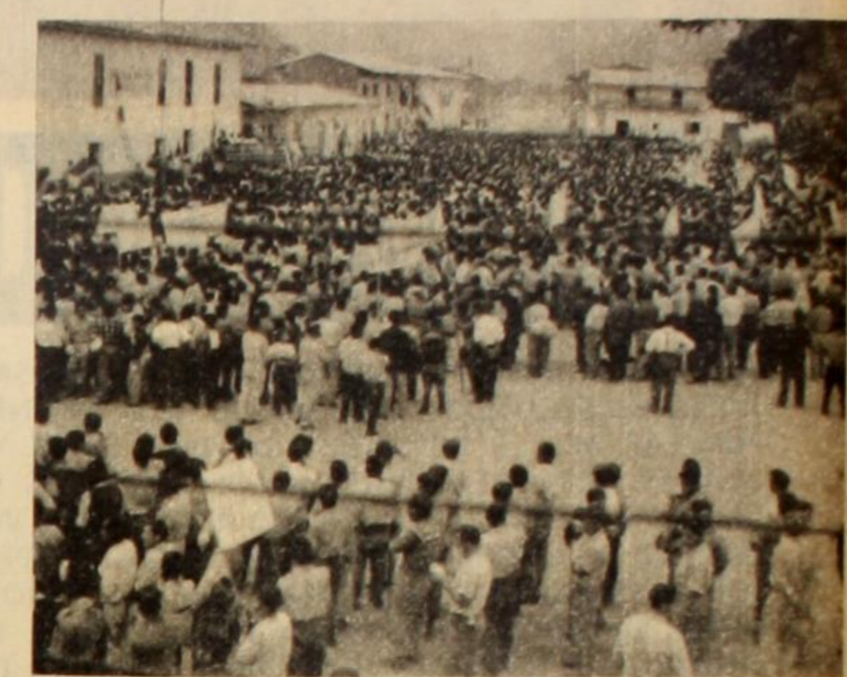
Marcha de campesinos en Quillabamba. Con sus banderas descendieron incontenibles de la montaña para reclamar la tierra de que han sido despojados por los terratenientes.

En esta tarea no fuimos comprendidos por la izquierda tradicional peruana, en especial por el Partido Comunista, que se dedicó a calumniarnos y a frenarnos. Llegó un momento en que teníamos más de cien sindicatos.