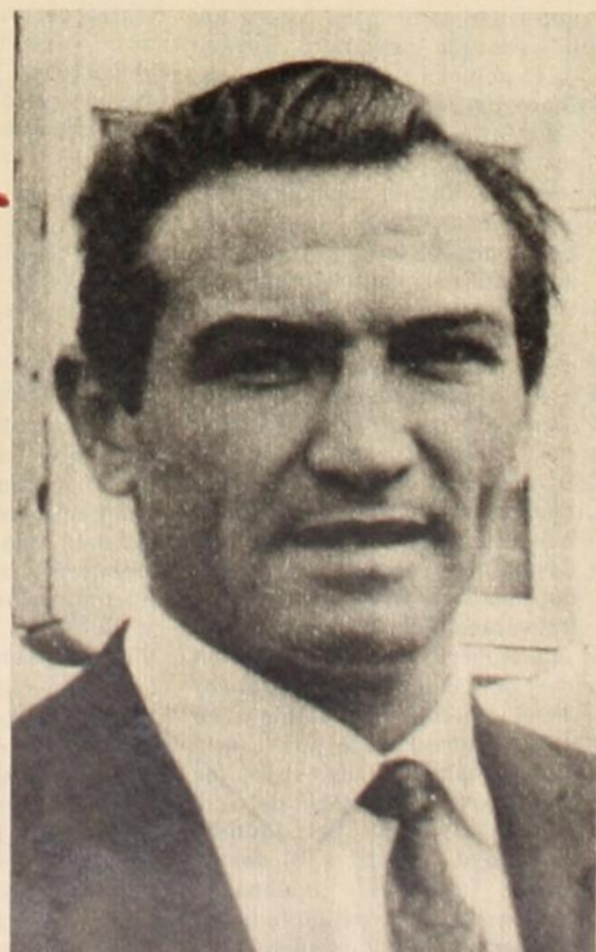
gobernaba un argentino en este país, desde 1946 hasta 1955. Hoy el deporte está en decadencia.