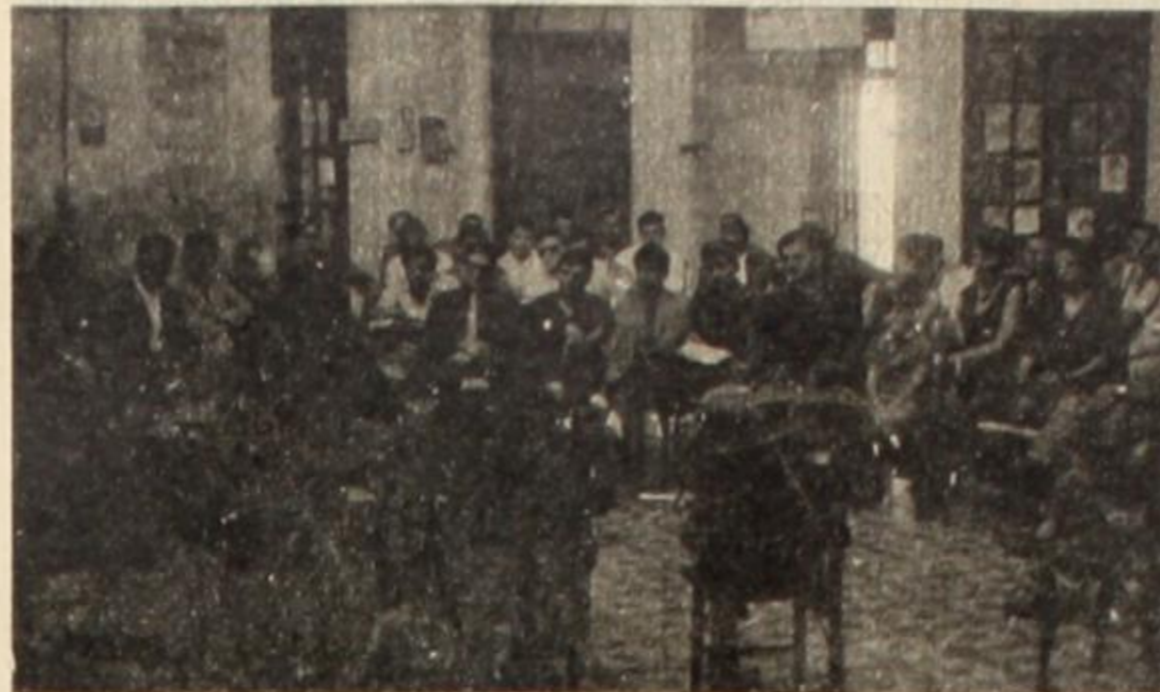
La escuela sindical de ATE, en la que se forjan los nuevos cuadros del peronismo, que desplazará a la burocracia conciliadora...