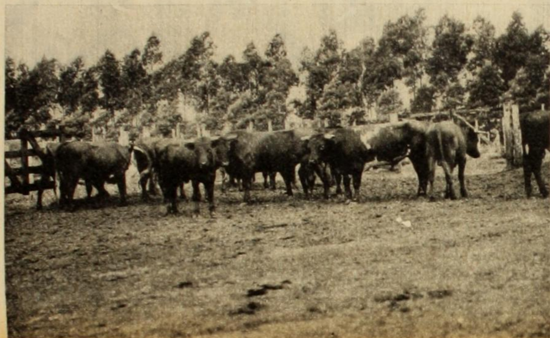
La carne continúa subiendo y la oligarquía continúa haciendo sus negocios, utilizando a los radicales del Pueblo como "idiotas útiles"

De todo esto nada habla la propaganda oficialista por la sencilla razón de que, hoy como antes, está subvencionada por los grandes bonetes de la Sociedad Rural. Y porque, hoy como ayer, la política del gobierno está al servicio del interés de los sectores minoritarios del privilegio y no del auténtico interés del pueblo.