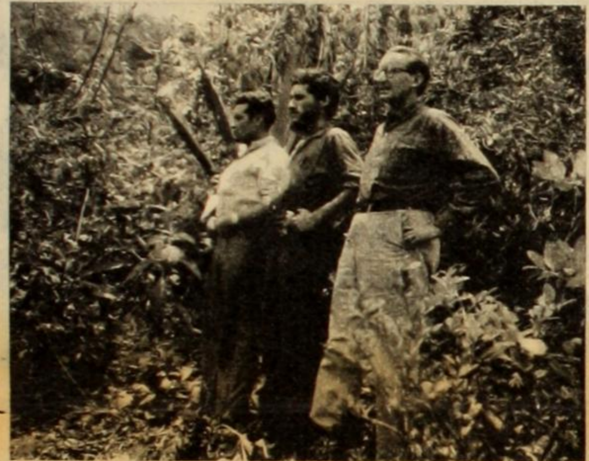
Luis De La Puente, actual líder del Movimiento de Izquierda Revolucionaria, junto con Hugo Blanco y uno de sus lugartenientes, en el foco revolucionario del valle de La Convención.