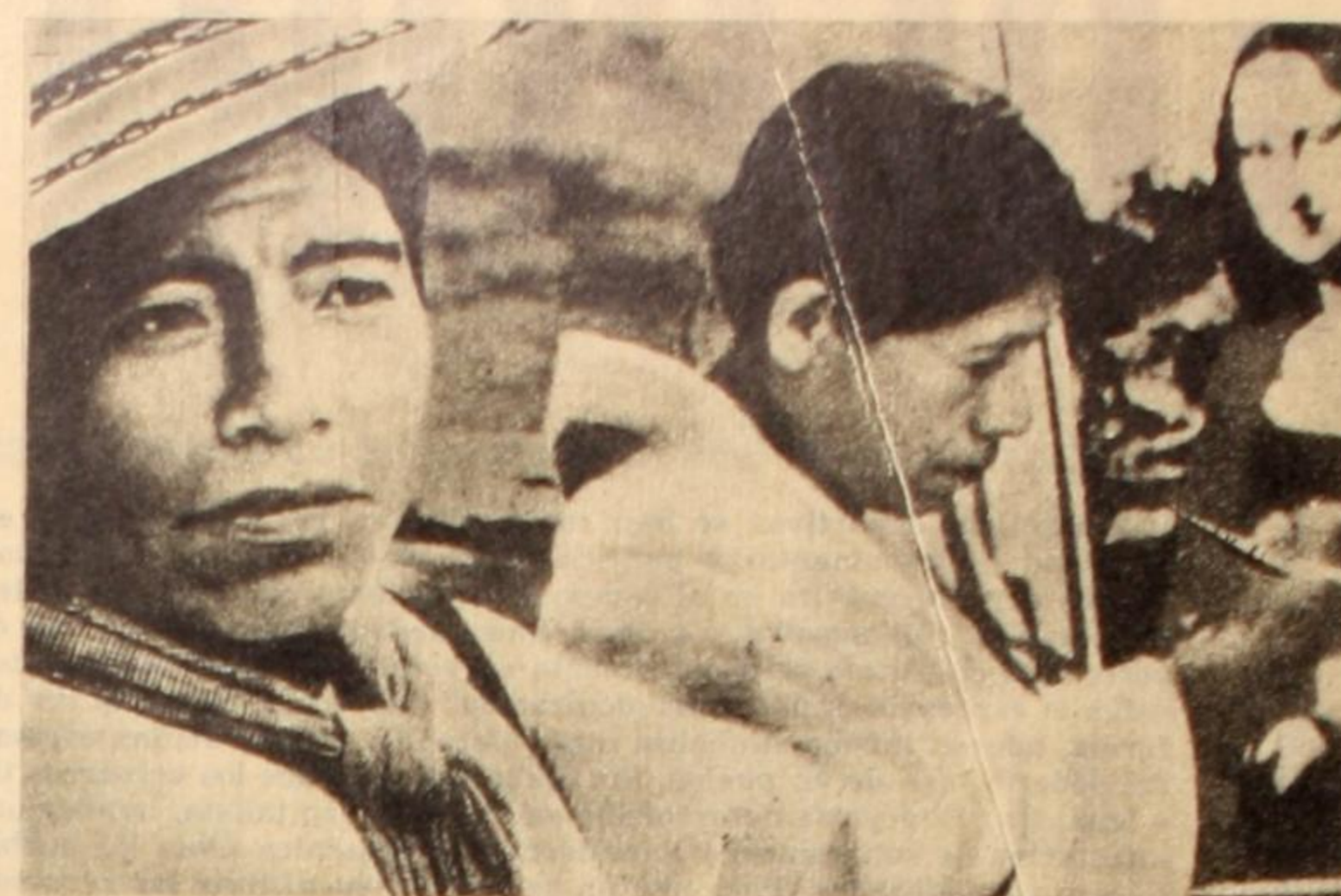
Hay una tarea urgente para aquellos que postulan un cine latinoamericano: dar testimonio crítico de la realidad social en que se debaten nuestros pueblos.

Cualquier manual de geografía política, cualquier estadística (oficial o no) nos da una imagen nítida del perfil cultural de América latina: cerca del 30 por ciento de la población vive en el analfabetismo y un número incalculable de individuos, si bien alfabetizados, se encuentran relegados a niveles ínfimos de educación y desarrollo cultural.