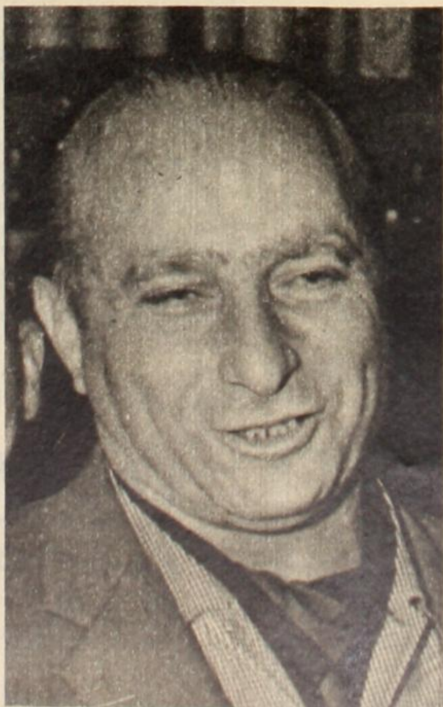
Juan Manuel Fangio y Pascualito Pérez: todo un símbolo. Sus grandes éxitos se produjeron cuando

Nuestro fútbol se desarrolló en base al extraordinario semillero de valores surgidos al conjuro de algún picado en cualquier potrero. Este vivero