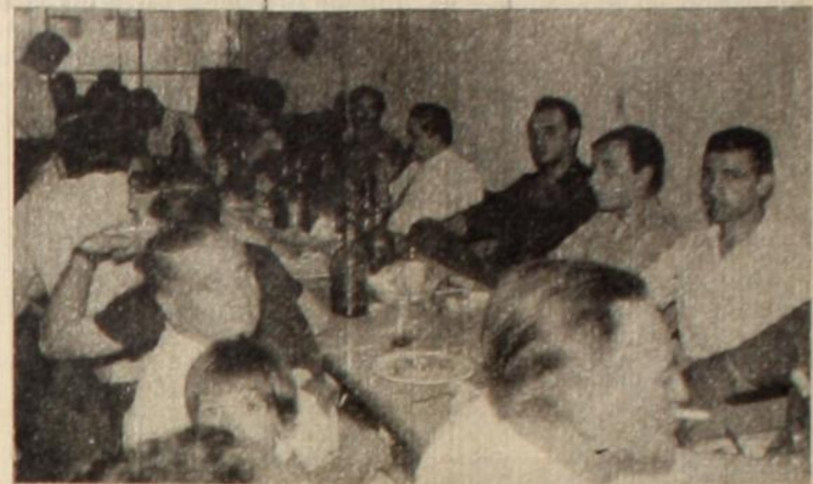
En la foto se aprecia un aspecto parcial de la comida de camaradería ofrecida a COMPANERO por el PAR y otras organizaciones revolucionarias del peronismo de Córdoba.