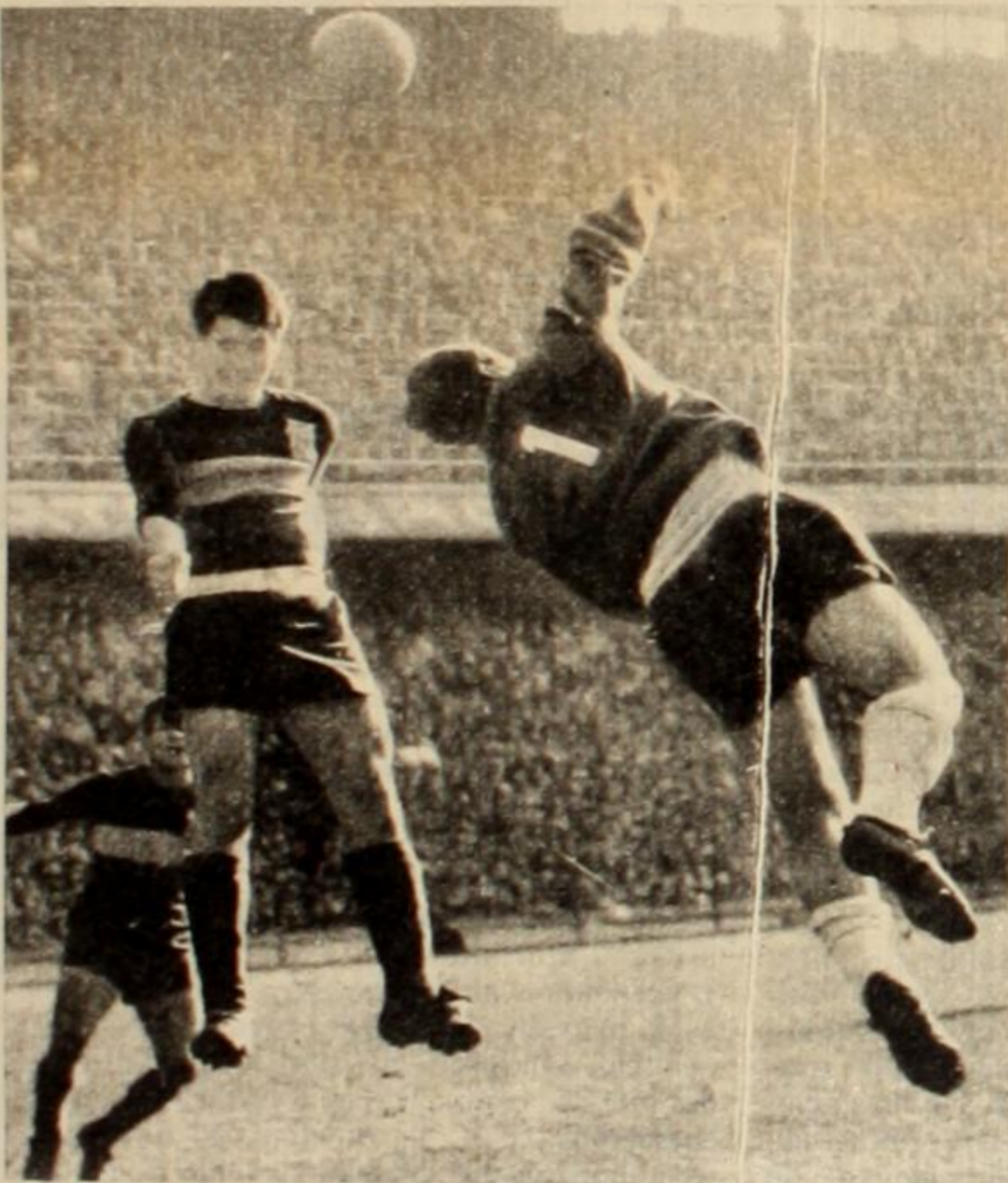
En el tiempo del gobierno popular peronista, el deporte, como todas las expresiones de la vida nacional, se desarrolló en plenitud. Se dieron las condiciones para que ese gran factor de cohesión nacional que es el deporte cumpliera su misión.

Después del triunfo, el candidato vencedor prometió solemnemente dedicar "lo mejor de su esfuerzo" a cumplir sin tregua lo prometido durante la campaña. Detrás de toda esta cháchara se esconde la transformación del deporte más popular en una gigantesca empresa comercial. La sana política estatal de fomento realizada por Perón queda así reemplazada por ese burdo trasplante de las tesis librepresistas al deporte del pueblo.