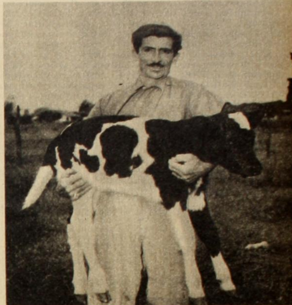
Como "en tiempos de la República" fraudulenta y oligárquica, nos ha vuelto gobernar la Sociedad Rural.

Mientras ese señor Invernador ha obtenido 15.000 pesos por