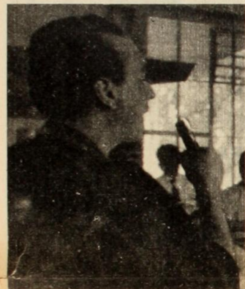
Valotta: "No hay peronismo sin Perón"