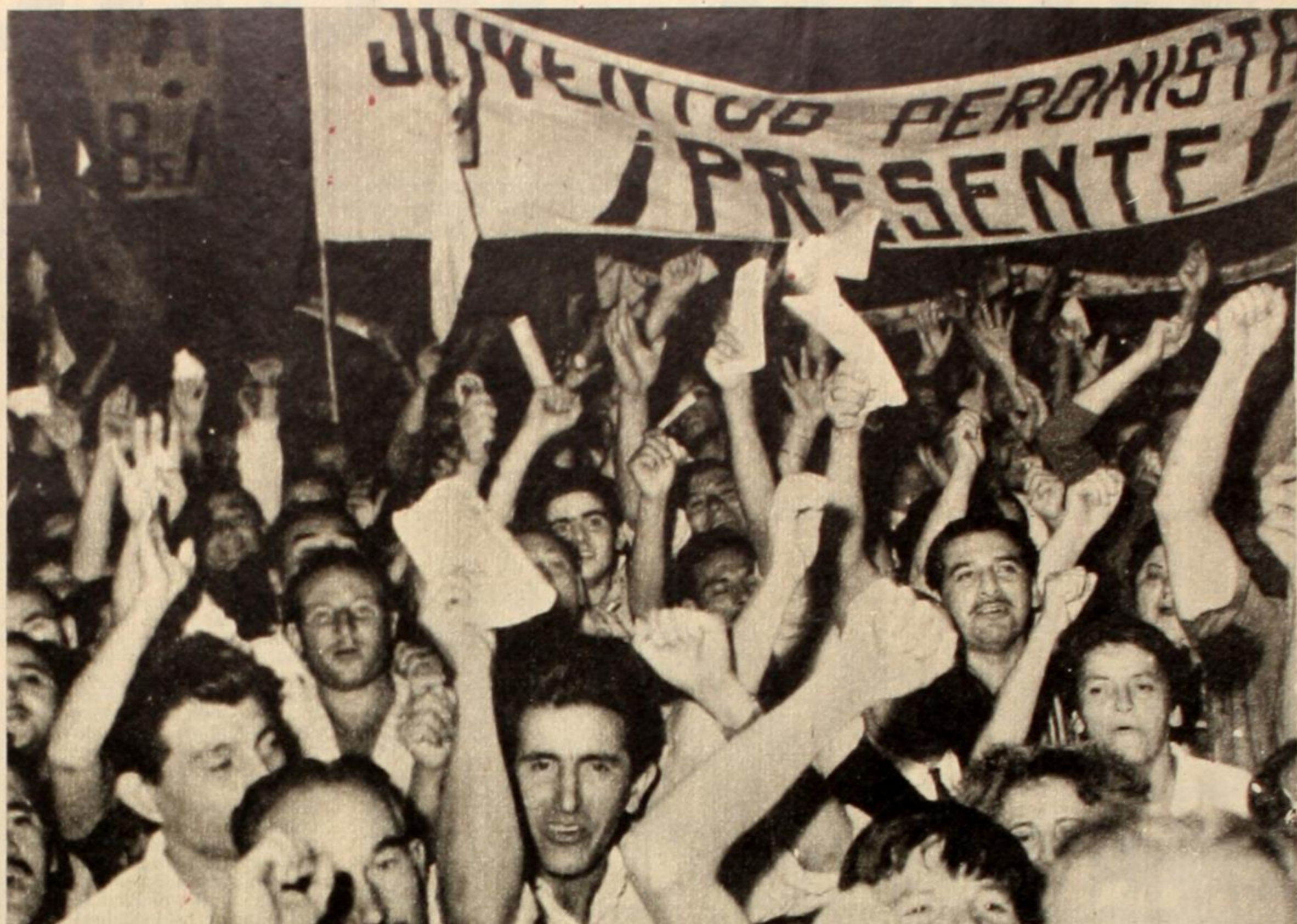
Los compañeros que multitudinariamente acudieron a San Justo, manifestaron su voluntad militante y su firme objetivo de preparar la vuelta del Líder, quien encabezará la lucha por la victoria final.

Celebrando el segundo aniversario del triunfo del pueblo, el 18 de marzo se realizó en la plaza de San Justo un vibrante acto que tuvo como nota central, dejar bien claro la necesidad impostergable de lograr la vuelta incondicional del Gral. Perón.