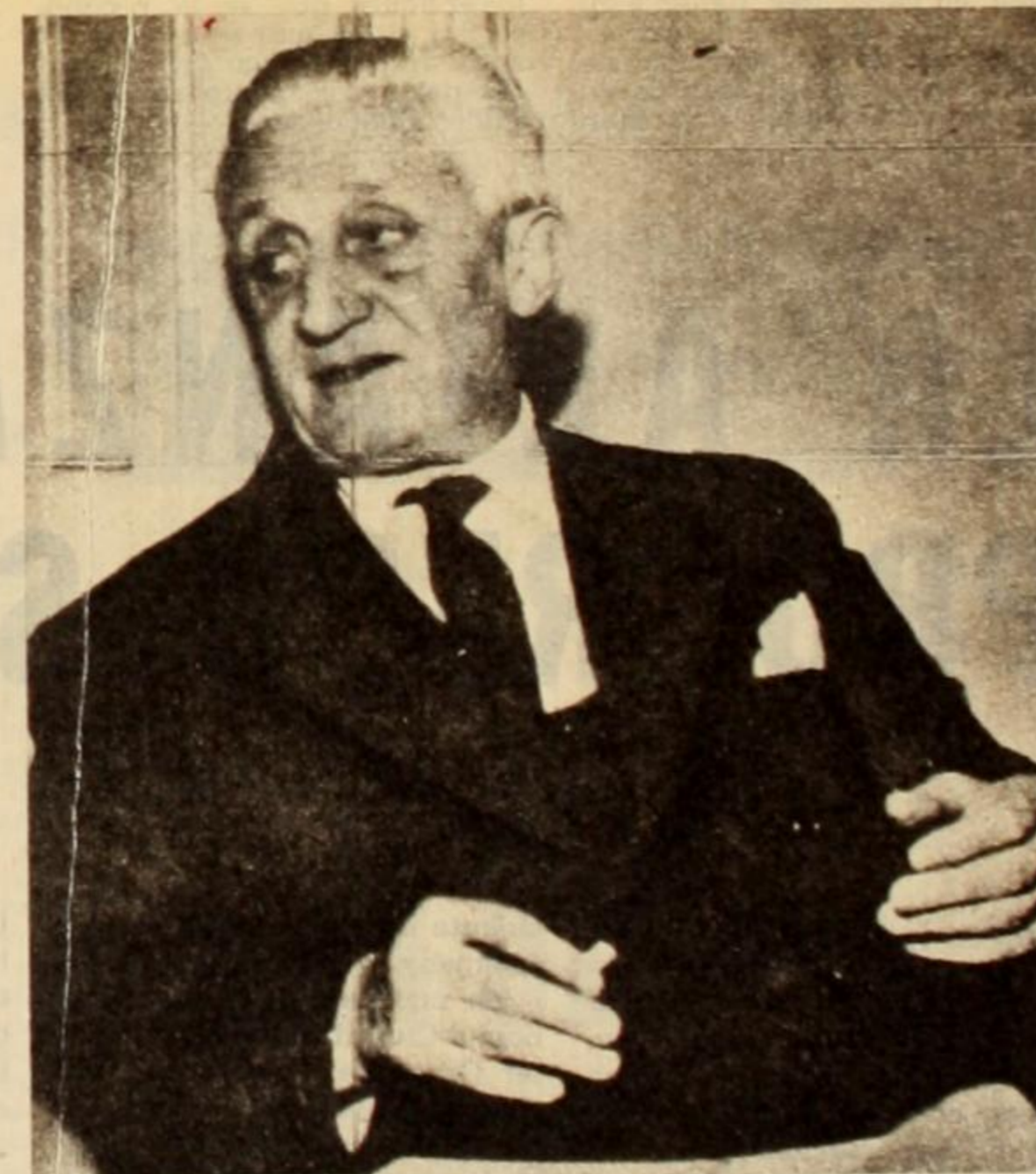
Illia: continuando la "tarea" de sus predecesores, bajo su responsabilidad gubernamental se trama la entrega de Segba a Sofina.

ustrial", y con la garantía de que el Estado procederá a: