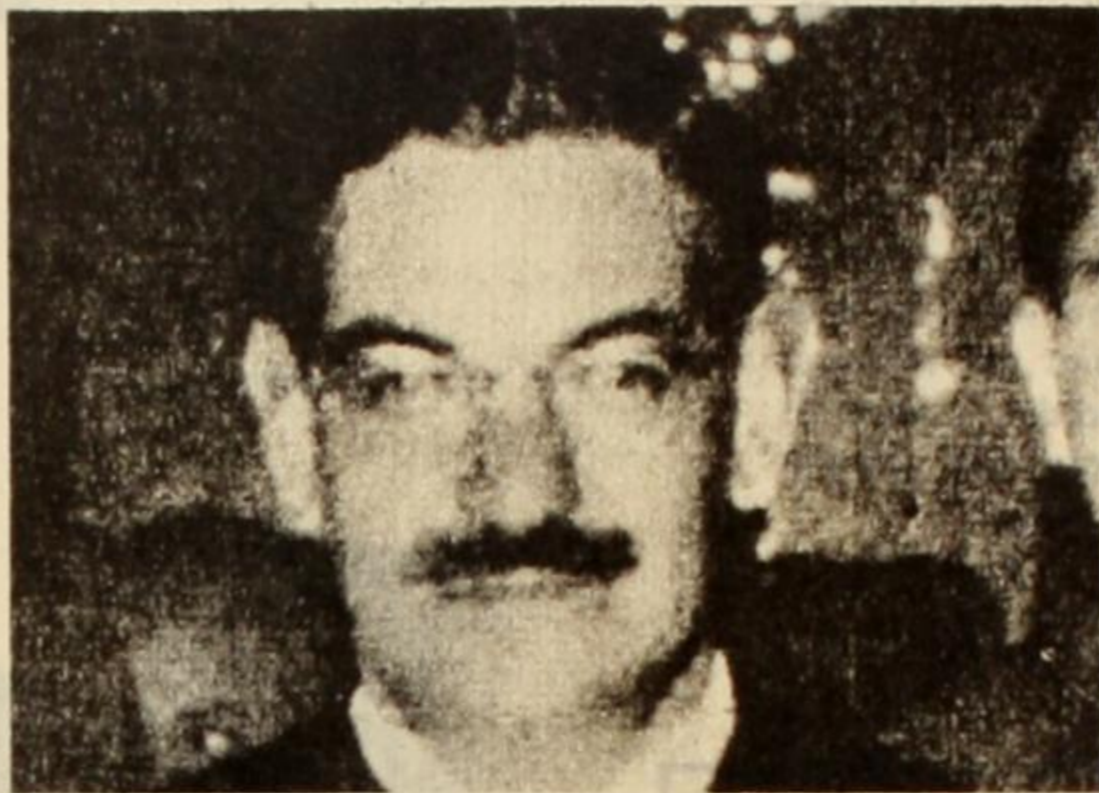
Fortun: candidato a vicepresidente fue desplazado por la nueva casta militar producida por el MNR que prefirió cambiarlo por René Barrientos, un general que pertenece a dicha casta.

ber servido durante años como encubridor de la entrega de la revolución. Pero en su descargo podemos decir que no ha perdido sus viejas mañas, ya que al Congreso realizado en La Paz, han sido invitados especialmente Mario Gutiérrez, jefe de la Falange Socialista Boliviana, que constituye el partido que los "barones del estaño" han utilizado siempre para sus asonadas contrarrevolucionarias, y Walter Guevara Arce, otro político que se separó anteriormente del Movimiento constituyendo el MNR