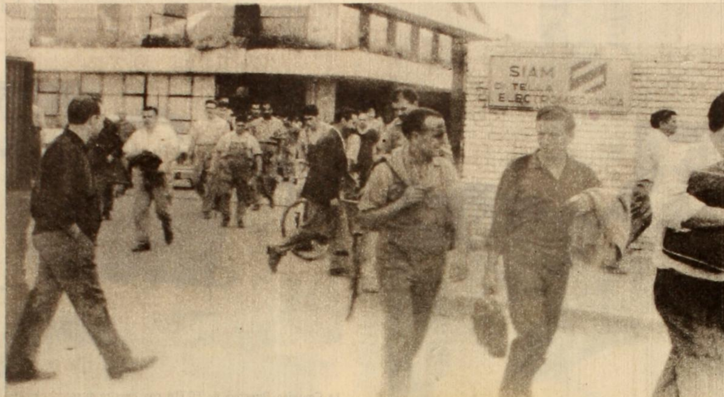
Los obreros de Siam Di Tella Electromecánica iniciaron un movimiento de fuerza para enfrentar la arbitrariedad de una patronal que los sume en el hambre y la miseria.

Último momento: Ya en imprenta esta edición recibimos la magnífica noticia de que la firma SIAM se ha doblado frente a la posición de lucha de sus trabajadores, que han demostrado una vez más que solo mediante la acción firme y decidida se vence a la reacción. Ese es el método que no debemos abandonar ni un instante, si queremos recuperar el poder que nunca debió salir de nuestras manos. Cada victoria de los trabajadores es una victoria más en el camino hacia nuestra liberación.