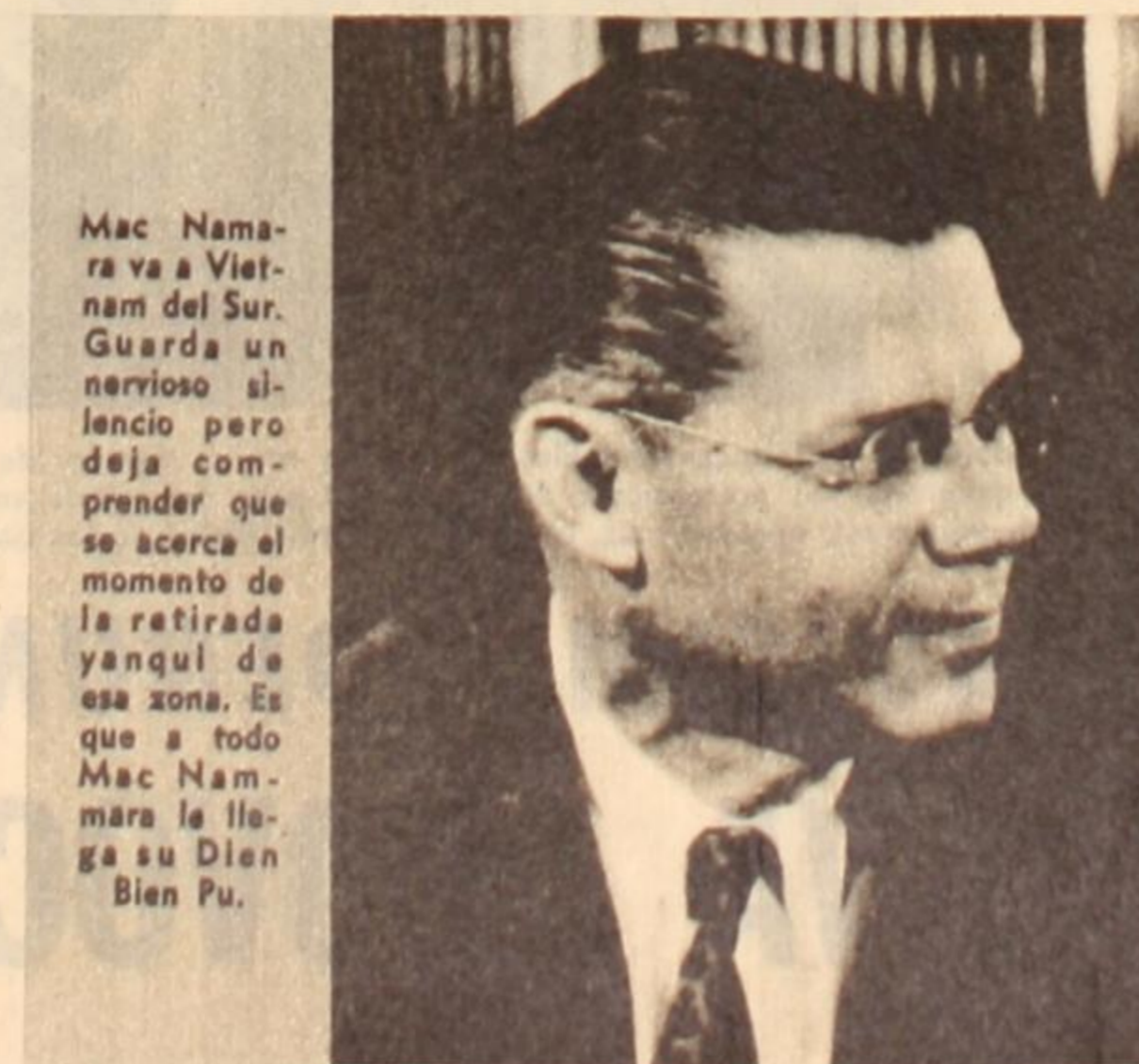
Mac Namara va a Vietnam del Sur. Guarda un nervioso silencio pero deja comprender que se acerca el momento de la retirada yanqui de esa zona. Es que a todo Mac Namara le llega su Dien Bien Pu.