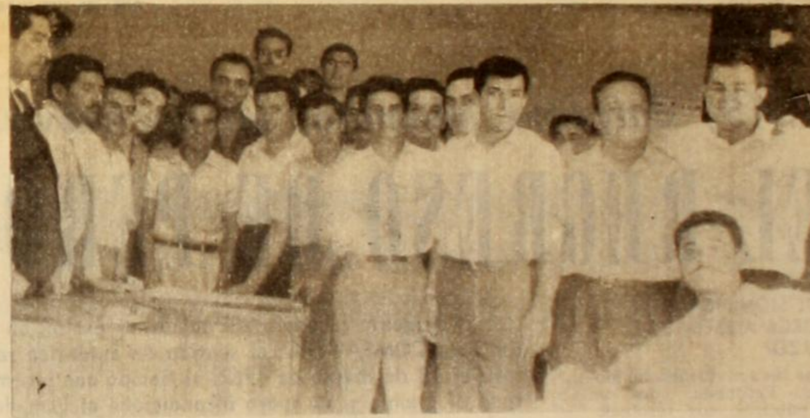
Los integrantes de la Comisión de Movilización que cumplió un extraordinario papel en la organización de la histórica marcha, aparecen en la nota gráfica con directivos y activistas de FOTIA durante el agasajo con que se despidió a los representantes de COMPANERO.