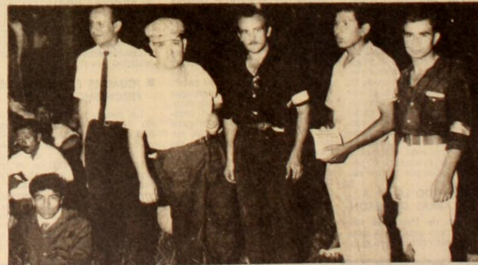
La Juventud Peronista, algunos de cuyos integrantes aparecen en la foto realizando tareas de control durante la concentración, cumplió importantes tareas lo mismo que la Agrupación Peronista Ferroviaria.