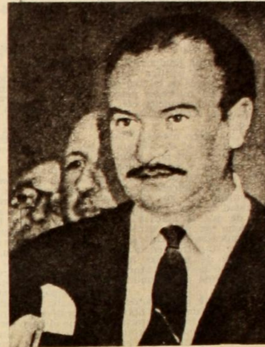
Villegas y Alonso: ¿dos cartas de un mismo juego?