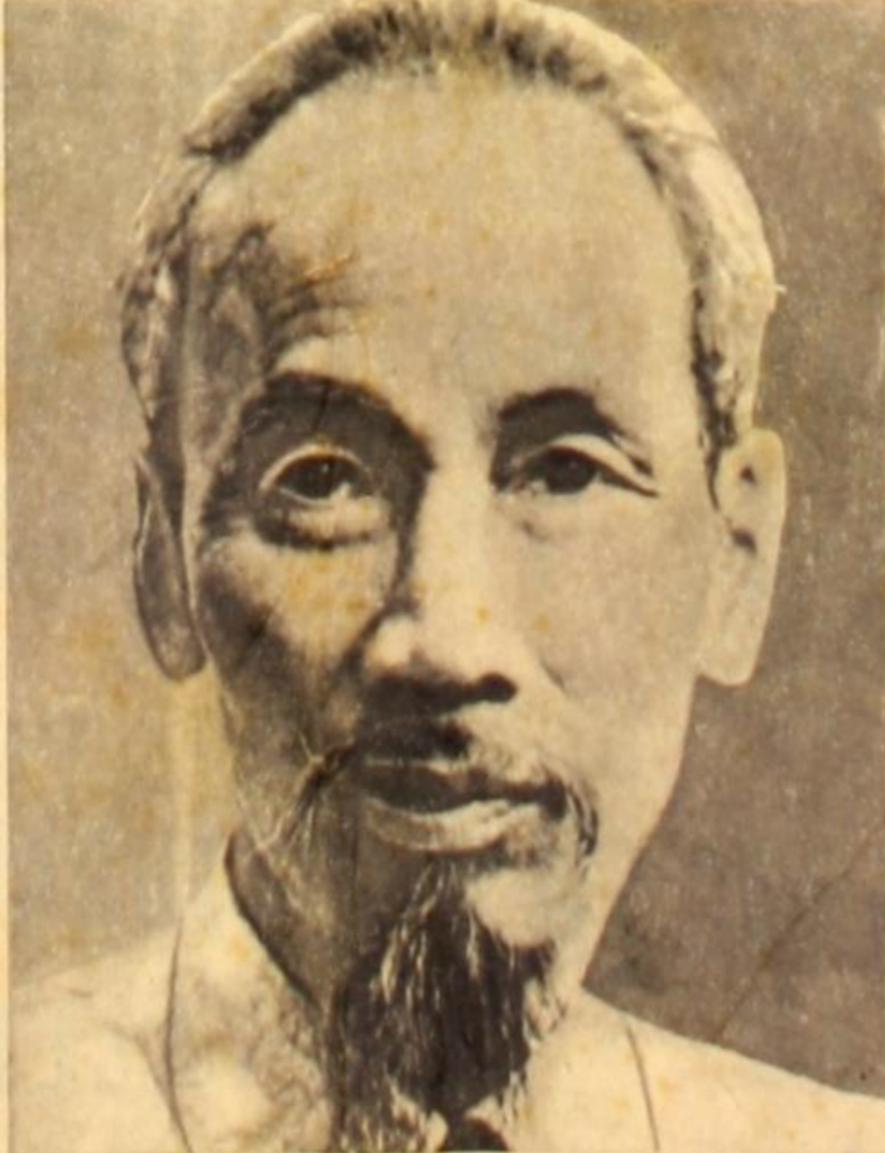
Ho Chi Minh, jefe de la revolución popular aún no concluida.