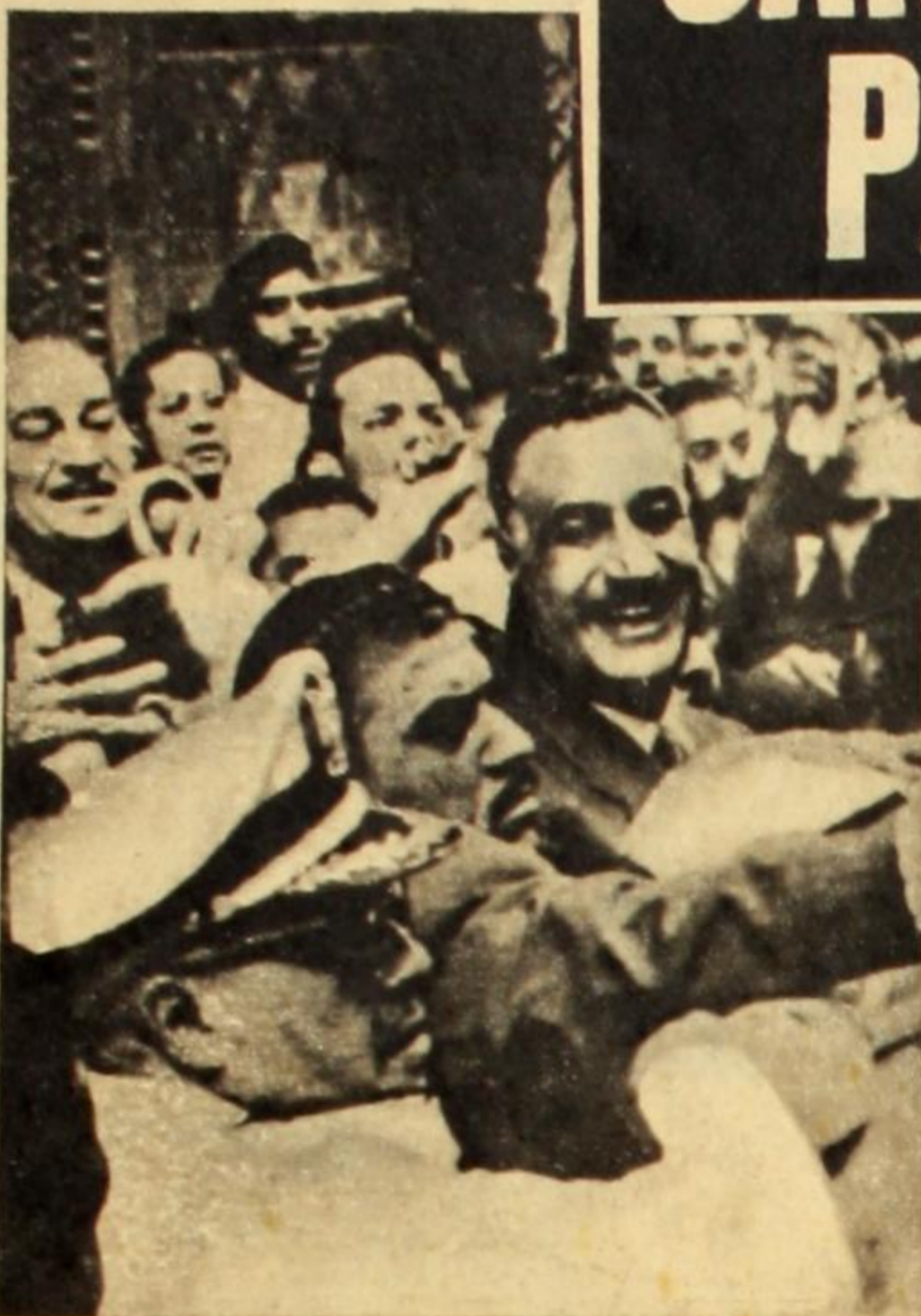
Nasser: eje de la unidad árabe, su ejemplo es fuente de inspiración...

LA UNIFICACION SE RETASA PORQUE CADA TRIUNFO POPULAR CHOCA CON NUEVAS Y SORPRESIVAS TRABAS