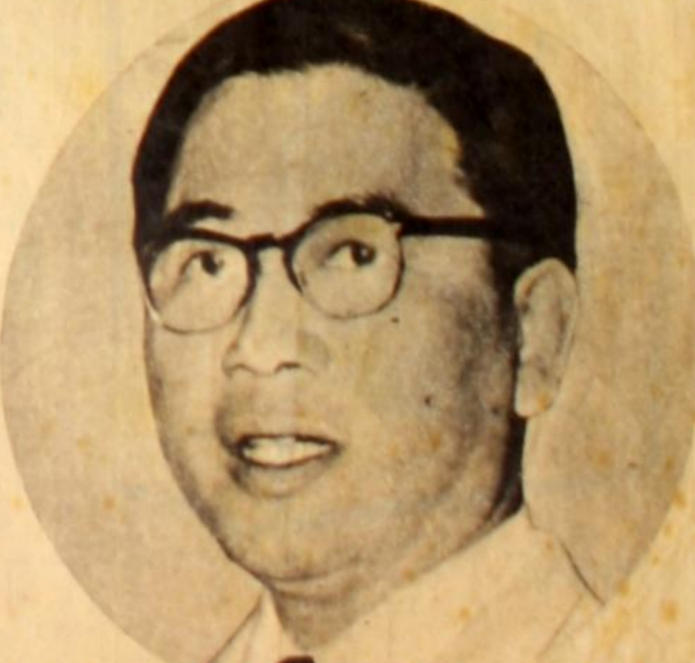
Ngo Dim Diem, representante del "mundo libre", errado con la libertad religiosa.