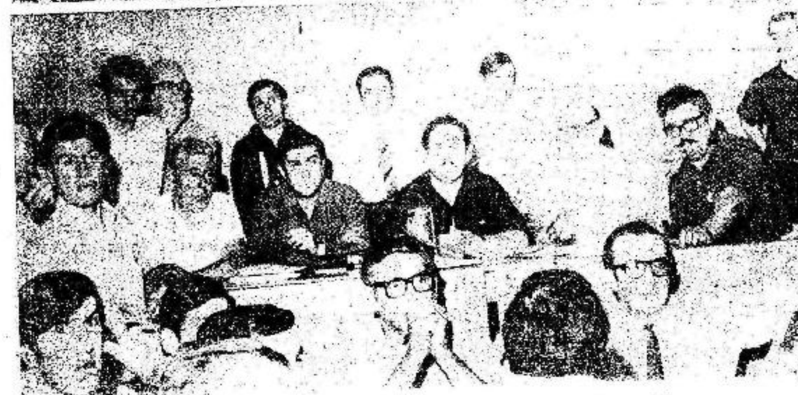
Dirigentes obreros se alternaron en la Mesa que presidió las deliberaciones del Plenario Nacional. En los grabados, sendos aspectos de la misma, bajo una leyenda de signo fraternal fijada en la pared: "Compañeros, Bienvenidos".