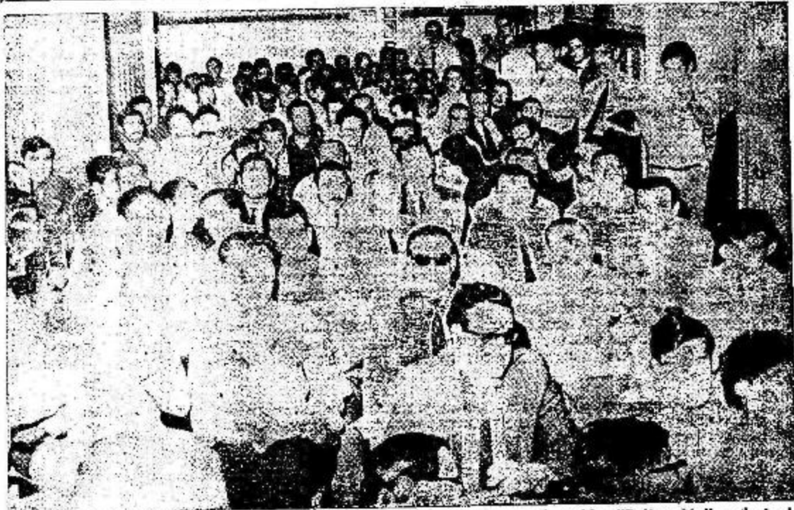
Un aspecto de las deliberaciones de la magna Asamblea en el Salón "Felipe Vallese" de la CGT de Córdoba. La voz auténticamente representativa de un vasto sector del Movimiento Obrero Argentino se pronunció sin digitaciones, sin embustes ni "pactos" y condenó a los falsos dirigentes que actúan a espaldas de las bases.

Informativo Semanal del Sindicato de Luz y Fuerza de Córdoba Personería Gremial N° 589 * CORDOBA, Viernes 17 de Octubre de 1969