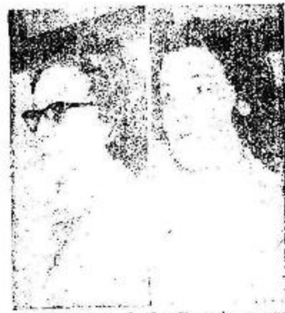
La Directora de la Escuela y una de las maestras, usando de la palabra para agradecer el gesto de los trabajadores de Luz y Fuerza.

Centro Materno Infantil (La Cullera), Instituto "Hugo Wash" (Unquillo), Escuela Alejo C. Guzmán (Secc. 139), Escuela Nº 471 (Estación Scto), Escuela Nacional Nro.