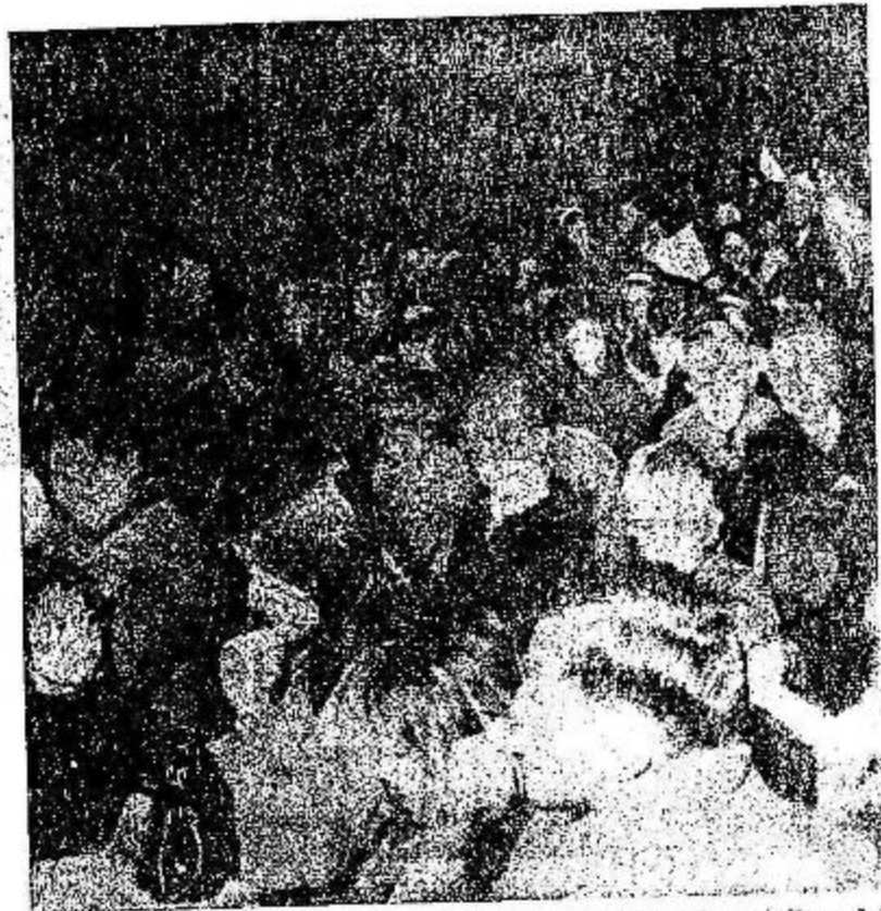
Rostros infantiles (y el de algún mayor) distraídos por el pantallazo del compañero fotógrafo. Otros pequeños asistentes, con más "experiencia", siguen absortos las secuencias del filme.

A mediodía se realizará el gran almuerzo en el Deportivo Central Córdoba