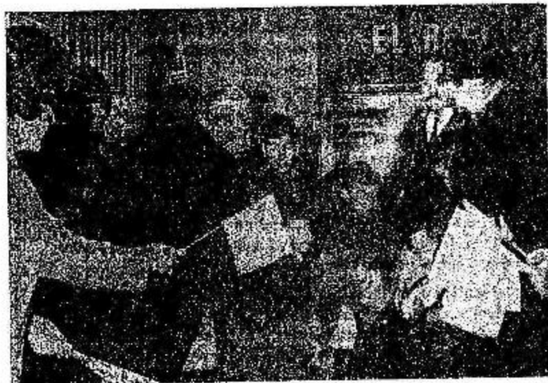
Un ritual previo a la función: una bolsita repleta de golosinas y una banderita argentina es entregada a cada niño por compañeras y compañeros que colaboraron en la organización del grato espectáculo.