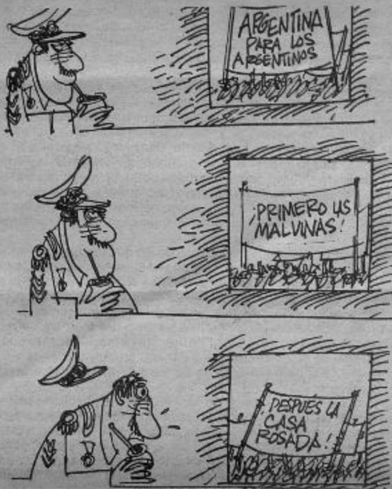
Ilustración: Palomo, Uruapan, México