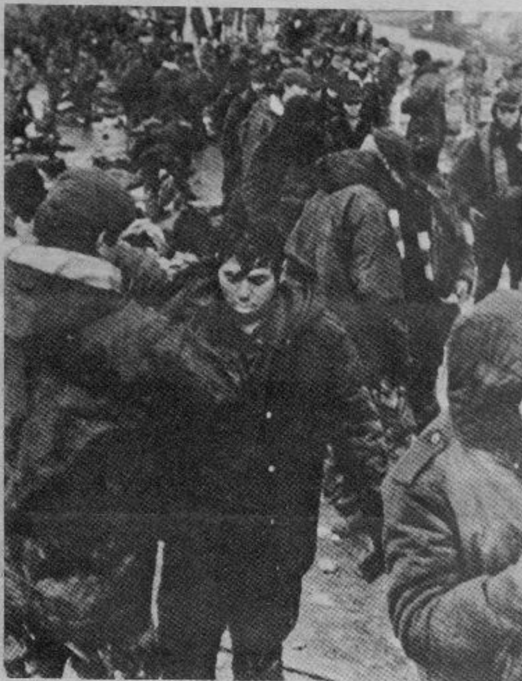
Las Malvinas en el momento de la rendición: nuestros soldados no fueron derrotados, fueron entregados y vendidos

grupo de apoyo terapéutico psicoanalítico nos confirmó que las drogas euforizantes eran de la familia de las mescalinas y otras.