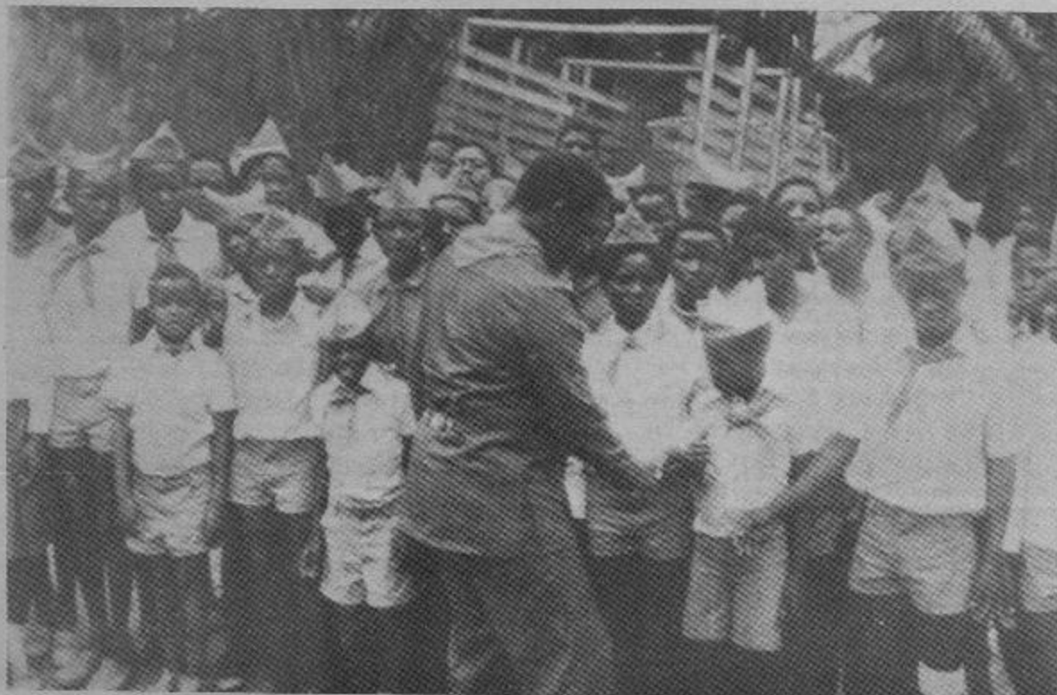
Pioneros de la Revolución Namibia