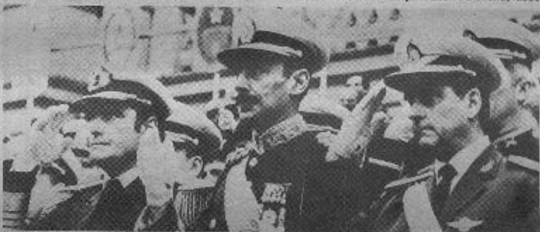
El proyecto de los militares

como Martínez de Hoz que se efectuó el golpe de Estado. Es contra el «despojo» a estos señores y en nombre de la «civilización occidental y cristiana» (en todo caso, preconiclar, inquisidora), que se encarcela, secuestra, tortura y mata.