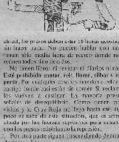
«Mujer de Ancho»