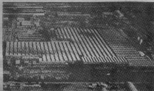
Otra vez huelgas obreras

El año 1978 se caracterizó por la reactivación del movimiento obrero argentino a despecho de la política gubernamental y de las dilaciones entre las capitales extranjeras que frenaban una tímida reacción.