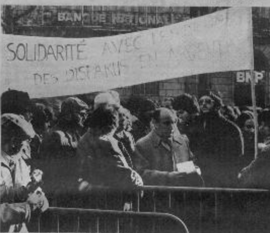
François Mitterrand está la embajada argentina.