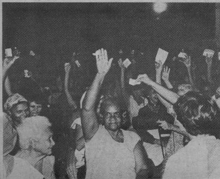
En Cuba vota todo el mundo, a partir de los 16 años

En los últimos meses de 1975, más de 6 millones de cubanos discutieron en Asambleas públicas el anteproyecto de Constitución que había sido redactado por la Comisión Mixta Integrada por el Partido Comunista y el gobierno