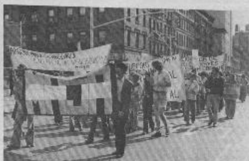
MASA SE HACE SOLIDARIO EN ESTA FECHA CON LOS HERMANOS CHILENOS Y ENVIA SU FRATERNAL SALUDO A ESE HEROICO PUEBLO QUE LUCHA CONTRA LA DICTADURA Y QUE CONSTRUYÓ EL CAMINO QUE LLVARA AL TRIUNFO DE LA REVOLUCION SOCIALISTA.

EL 11 DE SEPTIEMBRE SE CONMEMORÓ EN TODO EL MUNDO LOS TRES AÑOS DEL DERROCAMIENTO DEL GOBIERNO DE UNIDAD POPULAR QUE TRAJERA LA PODER A LA SANGRIENTA DICTADURA MILITAR DE PINOCHET. TAMBIÉN ESTA FECHA TIENE ESPECIAL SIGNIFICACION POR LA MUERTE EN COMBATE DE ESE GRAN LIDER REVOLUCIONARIO QUE FUERA SALVADOR ALLENDE.