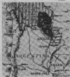
Continuamente, aviones Curtiss-Wright, y municiones; muchos bolivianos al ser capturados utilizaban uniformes que todavía conservaban las insignias del U.S. Army. Este hecho nos muestra que el peligro de guerra se había convertido ya en un hecho, a partir del 2 de julio de aquel mismo año, cuando las relaciones entre los dos países quedaron rotas, la línea situándose al alrededor del fuerte Fitz-Roy en junio de 1932; el 15 de julio de 1934 que el Standard Oil Co. financiaba la guerra a la oligarquía de los "barones de estaño". De esta forma, un tiempo después los bolivianos podrían recurrir a medios bélicos avanzados, y tras intensos bombardeos de aviación y de artillería de 105 mm, lanzaban violentos ataques de miles de hombres precedidos por tanques y lanzallamas; pero al fin, toda la guerra duró hasta diciembre de 1932—que los combates giraban en torno de los soldados a pie, que frecuentemente recurrían al machete, lo que brindaba ventaja a los paraguayos.

[La Guerra del Chaco costó 120,000 vidas!]