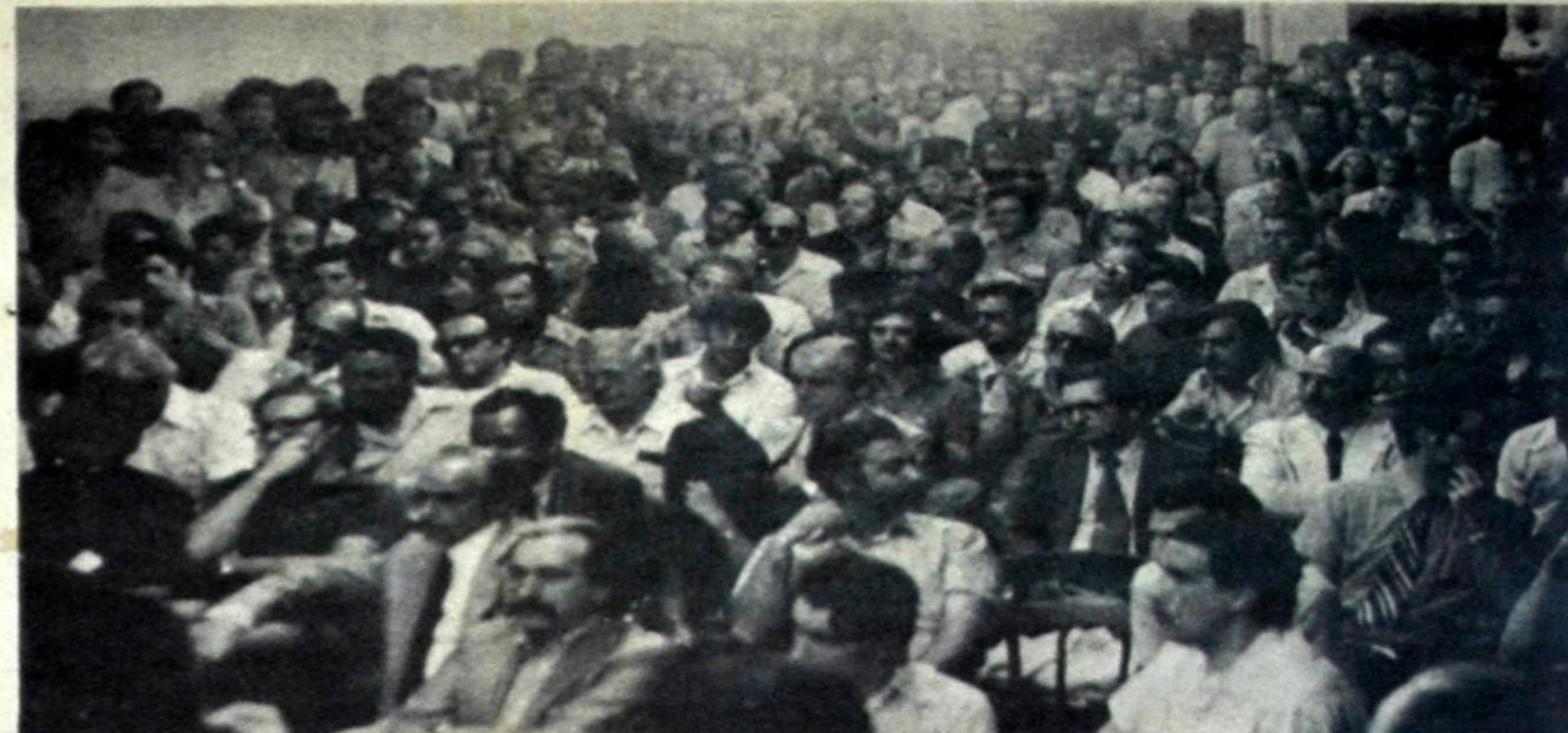
Los trabajadores de los diarios " Crónica " y " La Calle ", clausurados por el gobierno, hicieron masivas asambleas para considerar su situación y demandaron la reapertura de sus fuentes de trabajo.

En un acto de contornos masivos, convocado y presidido por los trabajadores de Crónica y La Calle , y al que fueron invitados todos los partidos políticos, incluso el Justicialista, la opinión democrática del país prestó su adhesión a la conformación de una Comisión Permanente de Gráficos, Periodistas, Representantes Políticos y Parlamentarios, "en defensa de la reapertura de las fuentes de trabajo, de la libertad de expresión y de los derechos sindicales". Este comité, de propósitos constructivos, tiene ahora en sus manos esta imponderable tarea, que, como fuera señalado por los dirigentes de los gremios damnificados, "es una importante contribución a la pacificación, la democracia y la consecuente liberación económica, política y social del país".