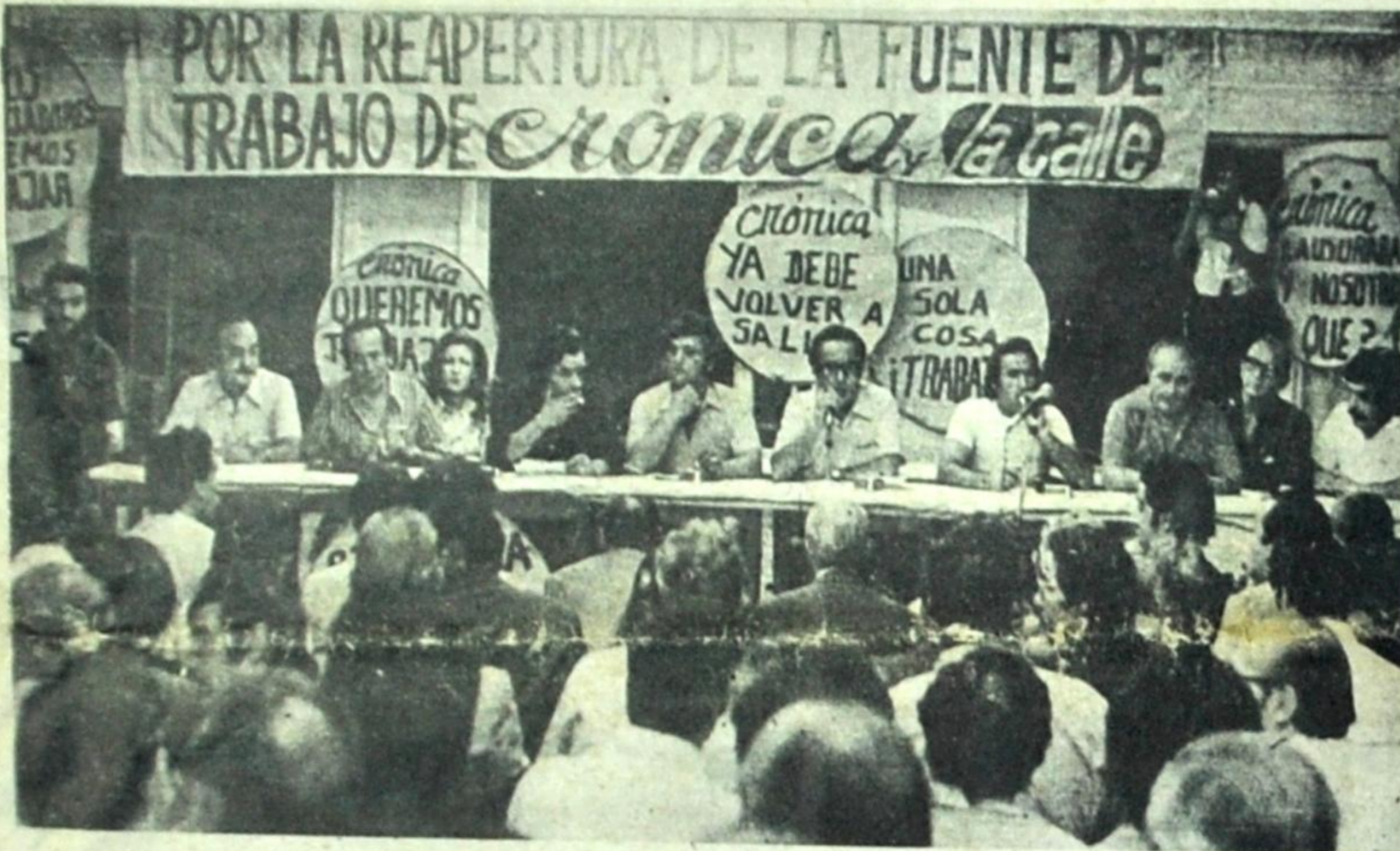
En un sinnúmero de reuniones, los gráficos y periodistas afectados por la clausura de diarios se abocaron al estudio de su dura situación. Representantes de partidos políticos y organizaciones culturales, obreras y estudiantiles les armaron su solidaridad.