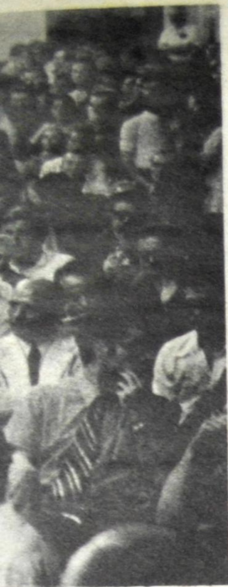
hicieron masivas jo.