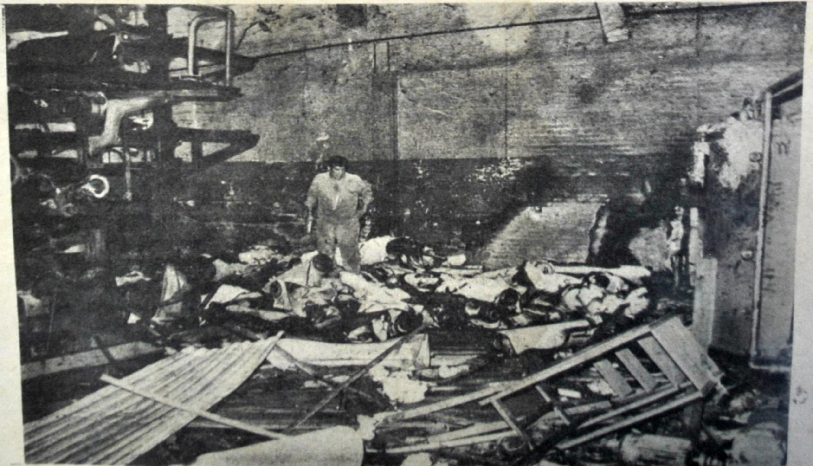
Un comando extremista perpetró un atentado contra...

Gráficos y periodistas cordobeses y capitalinos dieron fe mutuamente de su solidaridad con palabras tensas y cordiales y reafirmaron allí mismo la decisión de seguir luchando contra toda amenaza por la reconquista de sus derechos. De hecho, los compañeros cordobeses quedaron incorporados a la Comisión e invitados a allegar su voz a la tribuna del 7 de febrero.