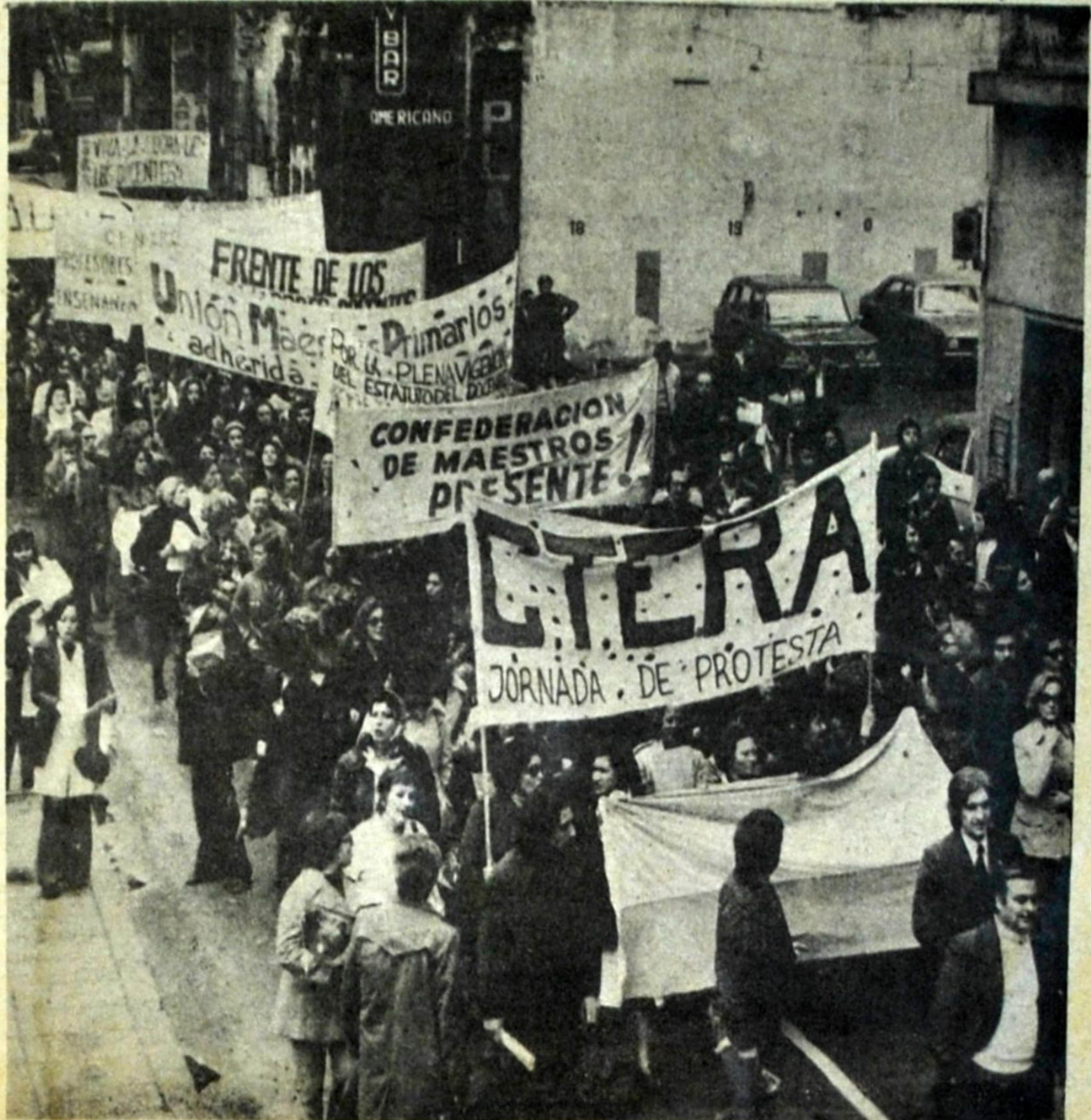
Durante todo el año 1974 hubo en la Argentina 511 huelgas y paros obreros, según la estadística oficial. Los mismos comprendieron a 4.036.226 trabajadores y su duración global fue de 59.508.055 horas-hombre. Clasificados sectorialmente, dichos paros y huelgas fueron: 256 en la industria, 128 en los servicios, 16 en el agro y 111 en otras actividades. Clasificados por su extensión fueron: 28 nacionales, 100 locales y 193 de fábrica o establecimiento. ¡La clase obrera no claudica!