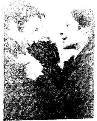
una despedida " dialogo " con un jerarca traidor