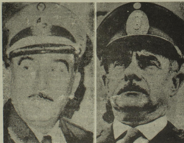
La entrevista de Perón con el fascista Banzer (arriba) su viaje al Uruguay y la visita de Chiappe Posse para encontrarse con Carcagno son ejemplos elocuentes del contenido antipopular de la diplomacia del gobierno.

del gobierno fascista en Bolivia, que desde agosto de 1971 ha asesinado a miles de patriotas, rebajado los salarios al mismo tiempo que devaluaba el dólar y liberaba los precios, entregado enormes riquezas de todo orden a los monopolios, ya sea directamente a sus centros, ya sea a sus filiales brasileñas, etc. etc.