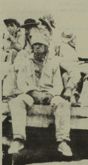
El pueblo trabajador en la miseria como siempre.

Estos últimos días la policía nuevamente ha reiniciado los atropellos contra el pueblo, en el caso del inicio procedimiento cometido contra la sede y los afiliados del partido legal Movimiento Lucha del Pueblo, los que sufrieron interrogatorios políticos en manos de Bordón y otros torturadores que se suponía estaban en disponibilidad, y que por