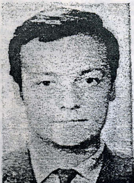
El fotógrafo Fumarola asesinado por un grupo parapolicial.

Tucumán. Obreros cesantes del ingenio "La Fronterita" ganan las calles céntricas de esta ciudad, exigiendo la creación de fuentes de trabajo.