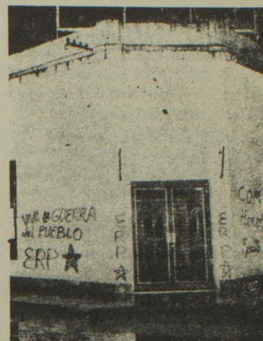
El resquebrajamiento del Frente Burgués, el incremento de las luchas de masas y el accionar guerrillero, abren nuevas posibilidades hacia la reconstrucción de la unidad obrera y popular.

pudo concretar en formas orgánicas y estables producto de la debilidad de todas estas fuerzas, de su incipiente desarrollo; condiciones hoy superadas por años de experiencia de combate, por un mayor conocimiento por parte de la vanguardia revolucionaria del comportamiento y la táctica de las distintas clases de la sociedad y las organizaciones que las representan.