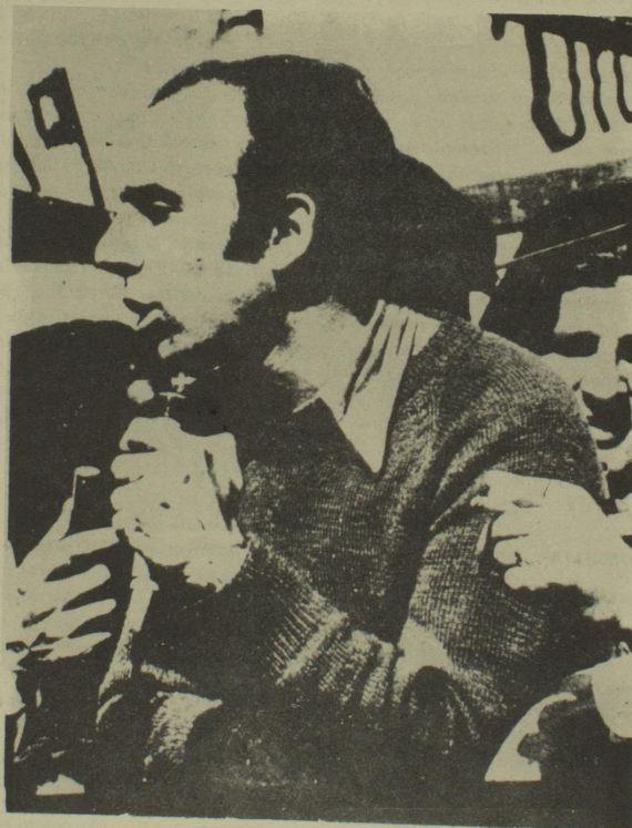
El compañero del PRT que habló en el acto de Córdoba.

Los actos, manifestaciones y el accionar armado de las organizaciones revolucionarias, fue el cálido homenaje que nuestro pueblo tributó a los Héroes de Trelew, y fue asimismo la reafirmación una vez más, de la firme decisión de mantener en el alto las banderas de la unidad y la lucha en la senda emprendida por nuestro pueblo hacia la conquista definitiva de la libertad.