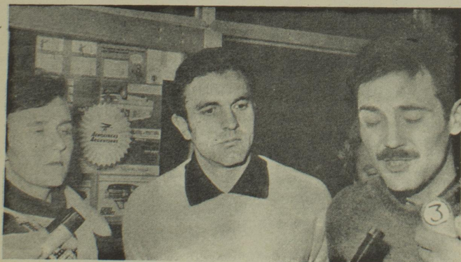
LA UNIDAD DE ACCION QUE SE DIO EN LA EPOCA DE LA DICTADURA NO CRISTALIZO EN FORMAS ORGANIZATIVAS.

La vanguardia revolucionaria, junto a las más representativas fuerzas del pueblo deben multiplicar esfuerzos para concretar la unidad obrero-popular, y darle las formas orgánicas que sienten las bases para la construcción en un futuro no muy lejano de la herramienta apta para disputar al poder político a las fuerzas enemigas; El FRENTE DE LIBERACION NACIONAL.