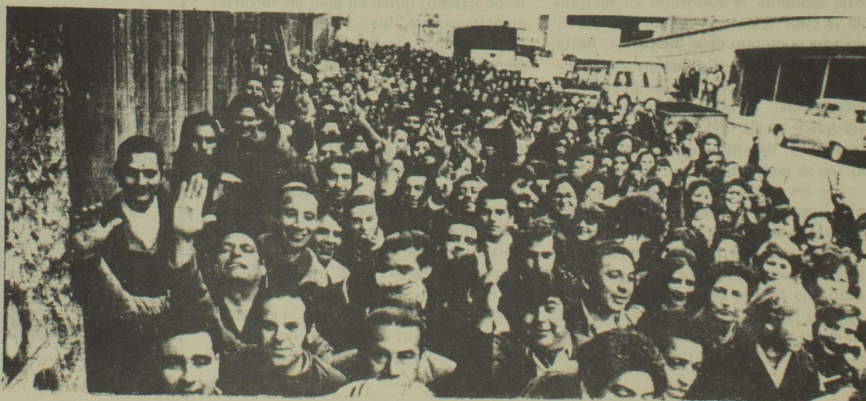
LAS HORAS EXTRAS AYUDAN A MANTENER EL EJERCITO DE DESOCUPADOS

El ejemplo de los mecánicos de Córdoba, los metalúrgicos de Villa Constitución, Propulsora Siderúrgica y fábricas, talleres y fundiciones de Buenos Aires y Rosario, así como el de gráficos, jaboneros, químicos y otros sectores obreros, todos los cuales están aplicando el trabajo a convenio, negándose a realizar horas extras, indica que existen grandes posibilidades para dar nuevos e importantes pasos hacia la generalización del combate, concientes de que sólo en la sociedad socialista, abolida la propiedad privada de los medios de producción, desterrada la ganancia como móvil de las actividades creadoras, el proletariado podrá organizar la producción en función de las necesidades colectivas de todo el pueblo.