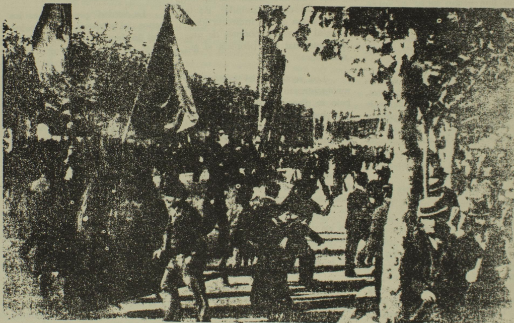
1o. DE MAYO DE 1909. EL CARACTER COMBATIVO, REAFIRMADOR DE LA INDEPENDENCIA DE CLASE DEL PROLETARIADO FUE LA CARACTERISTICA MAS SALIENTE DE AQUELLAS CONMEMORACIONES.

Este carácter combativo, reafirmador de la independencia de clase del proletariado, fue la característica más saliente de aquellas conmemoraciones. El proletariado recordaba a sus hermanos asesinados, y al hacerlo, contradecía a-