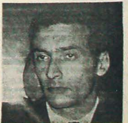
CORTES: La CGT de Mendoza acusa

El Sindicato de Obreros y Empleados Vitivinícolas y Afines, de la zona en conflicto, adherido a nuestra CGT, viene luchando desde hace más de un año para que estos obreros cobren sus haberes y lo han logrado medianamente con paros y luchas. En este último conflicto se están esperando aún las soluciones y luchando por ellas, y la solidaridad de los demás afiliados al Sindicato ha permitido que se distribuyan alimentos entre los trabajadores de la zona de Lulunta.