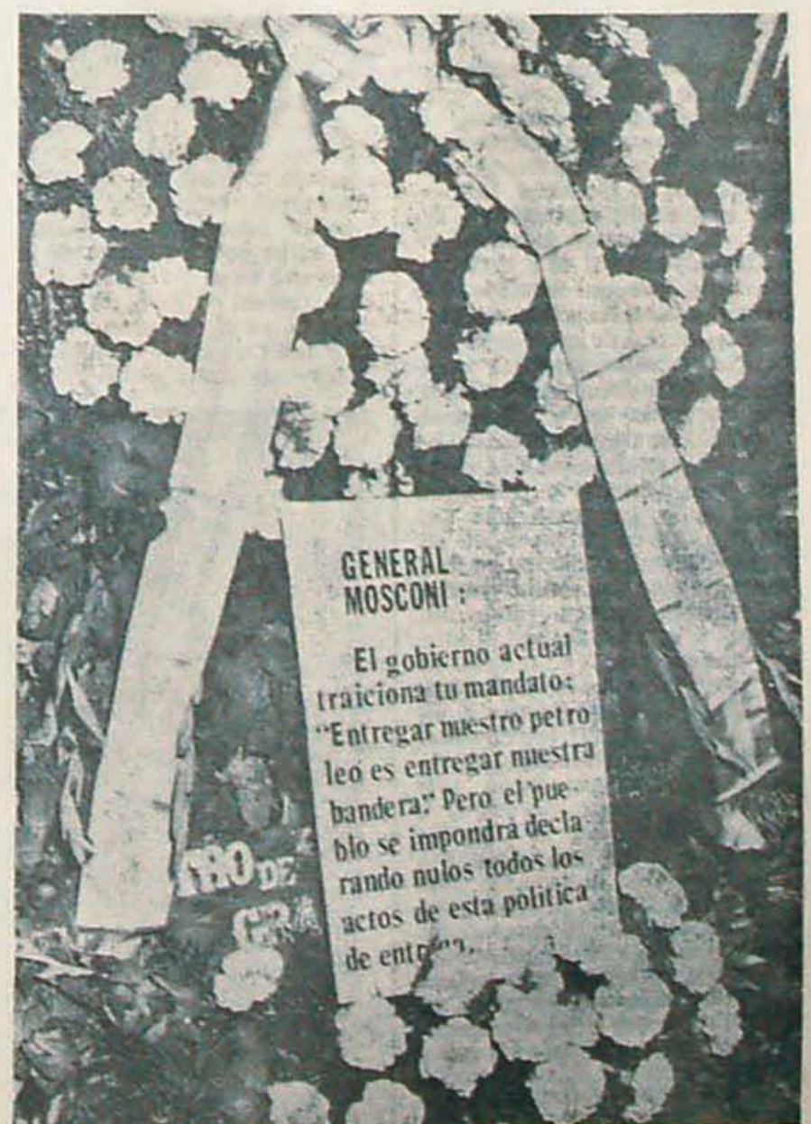
Flores para el recuerdo del general Mosconi. Hoy un grupo de patriotas lo recuerda. Mañana, el pueblo conquistará el petróleo argentino y recuperará su nombre para la patria liberada.

Los profesores y los botones de Ciencias Económicas se pusieron histéricos al ver los carteles, y requirieron el auxilio de la Policía Federal para sacarlos.