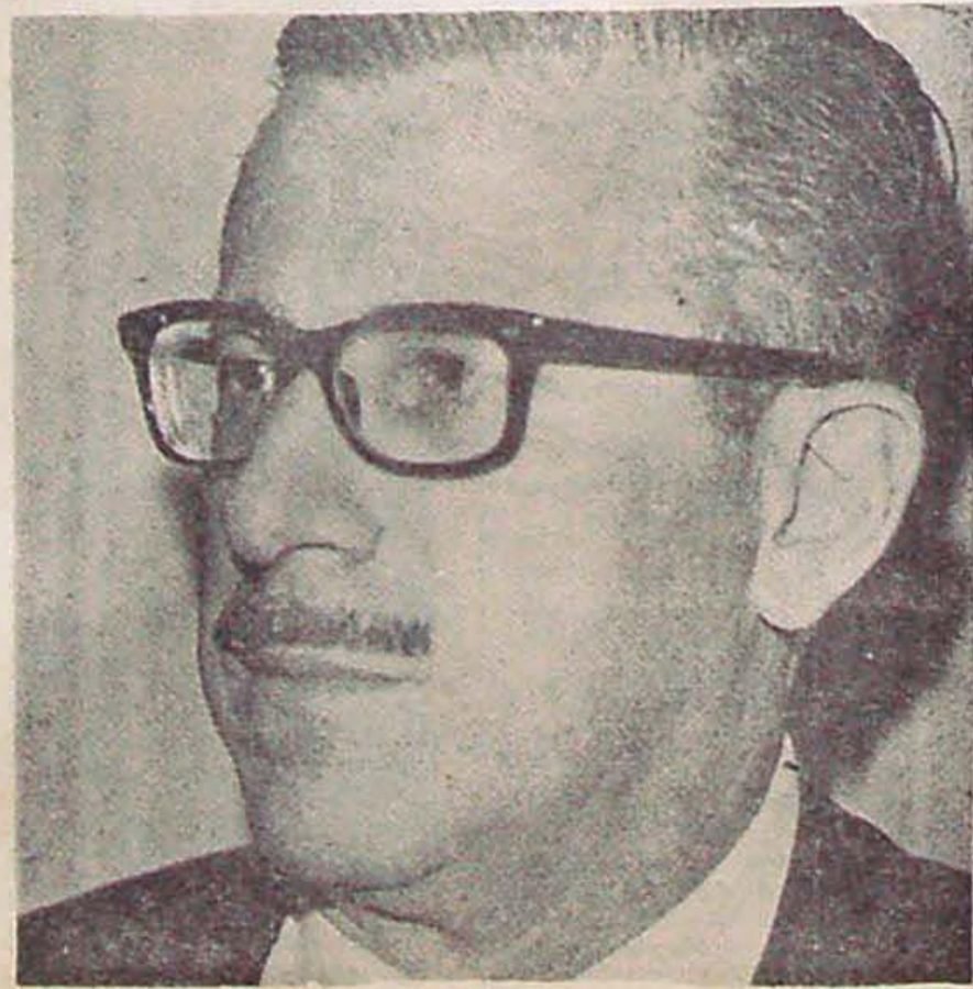
K. V.: La voz del año