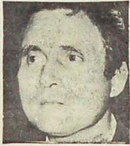
Organo: Triunfo de las bases.

Las próximas elecciones que se realizarán el viernes 22 en el gremio gráfico son de fundamental importancia no sólo para los trabajadores de esa especialidad sino para todos los trabajadores argentinos.