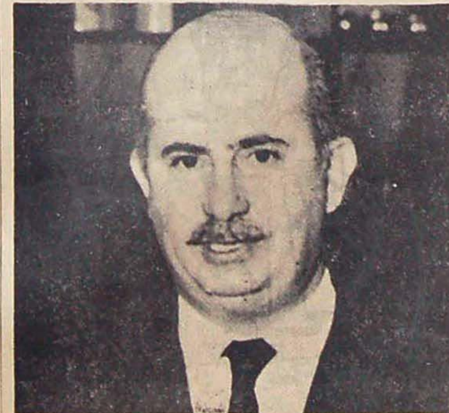
Ministro Astigueta: menos alumnos, menos maestros y más FORD.

La privatización de la enseñanza pública comenzó con Arturo Frondizi, en su ofensiva masiva contra la educación nacional. Fue Frondizi quien primero ensayó la transferencia de las escuelas Láinez a las provincias, con tanto éxito que debió dar marcha atrás ya que las provincias que apenas si mantenían su administración no podían hacerse cargo de las escuelas. El precedente fue tenido en cuenta por el gobierno de Onganía que dictó una nueva ley de transferencia —la 17.878— para entregar a las provincias las escuelas del Consejo Nacional de Educación. Esto quiere decir que se les regala el local cuando es propio o se efectúa un