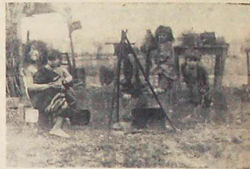
Tucumán: más que antes el espejo de la Argentina.