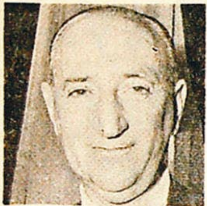
Almirante Castro (CONADE)

mirantes con el grupo Austral y sus brigadieres? Ahora veremos. Es de conocimiento público que dos empresas de aviación privadas, que reconocen pertenecer al mismo grupo financiero, Austral y ALA, están beneficiándose de