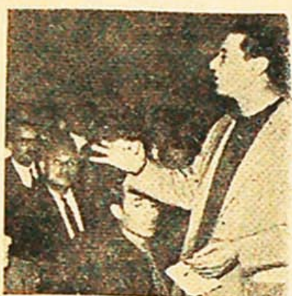
De Luca: la única impugnación

Es difícil imaginar un gobierno que en los últimos dos años haya violado más sistemáticamente el derecho laboral y perseguido con más saña a los trabajadores que el gobierno de Onganía. Sin embargo, el delegado argentino San Sebas-