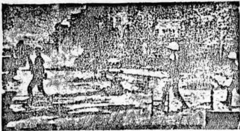
la sangrienta represión no logrará detener al pueblo thailandés

representantes, las Fuerzas Armadas thailandesas que para conjurar este peligro dieron el sangriento golpe del 6 de octubre de 1976.