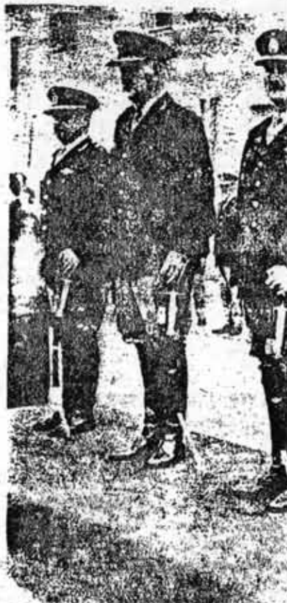
Hábilmente Lanusse organizó el GAN, que permitió el relevo de las FF.AA.

Hoy no solo se ha terminado el populismo como alternativa de engaño al pueblo y estabilidad capitalista sino que además las fuerzas revolucionarias adquirieron un mayor desarrollo y experiencia y no están derrotadas a pesar de los golpes sufridos. Mientras tanto, las condiciones objetivas para el triunfo revolucionario, la crisis