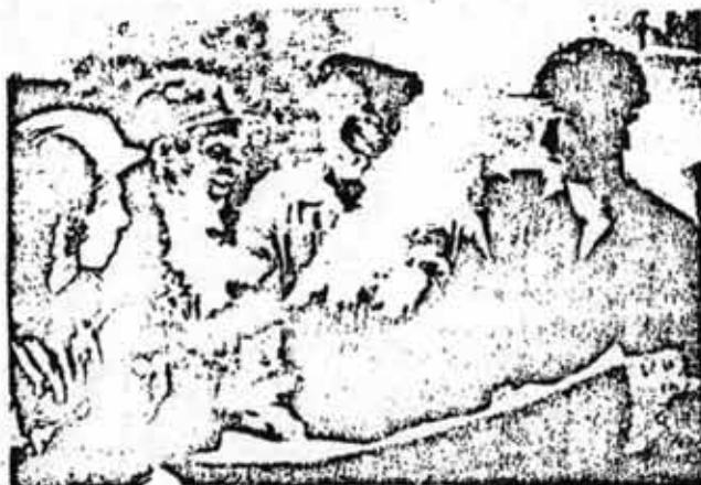
AÑO TRAS AÑO MEJORA EL NIVEL DE VIDA DE LOS TRABAJADORES

La estabilidad de los precios minoristas es una parte integrante del programa social del Estado Soviético, programa que busca mejorar el nivel de vida del pueblo y que ha venido aplicándose invariablemente en el noveno quinquenio. En el décimo quinquenio, el Partido Comunista de la Unión Soviética se propone seguir con firmeza este mismo rumbo. Las "Orientaciones fundamentales de fomento de la economía nacional de la URSS en 1976-1980" aprobadas en el XXV Congreso del Partido Comunista de la Unión Soviética, dicen al respecto lo siguiente: "Continuar asegurando la estabilidad de los precios estatales al por menor, de los artículos fundamentales, comestibles y no comestibles, rebajar los precios de algunas mercancías a medida que se vayan creando las condiciones propicias para la acumulación necesaria de recursos mercantiles."