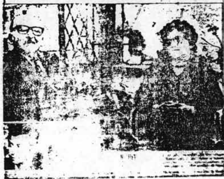
Los padres de nuestro querido compañero durante su estancia en Italia en que efectuaron una conferencia de prensa.