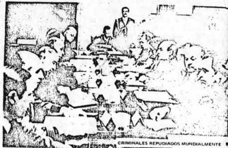
CRIMINALES REPUDIADOS MUNDIALMENTE

Amplios sectores progresistas y democráticos europeos y de nuestro continente se movilizan para que cesen en nuestra patria los secuestros, asesinatos, de torturas, las inhumanas condiciones de vida de los presos políticos en las cárceles, la barbarie de los campos de concentración. En Francia el CENTRO ARGENTINO DE INFORMACION Y SOLIDARIDAD (CAIS), en Italia el COMITE ANTIFASCISTA CONTRA LA REPRESION EN ARGENTINA (CAFRA), en Suecia los ARGENTINA KOMITEE, en Alemania el CENTRO DE SOLIDARIDAD CON AMERICA LATINA (COSAL), en Suiza el GRUPO DE INFORMACION SOBRE ARGENTINA (IGA), han realizado conferencias de prensa, publicaciones en diarios, radios y TV de los respectivos países denunciando la sanguinaria política de los militares argentinos, llamando a