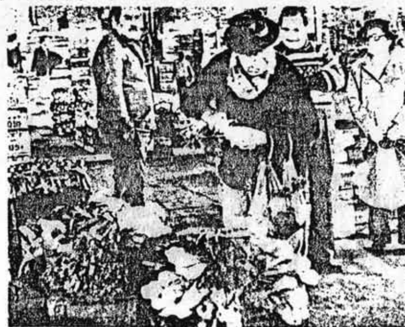
Los últimos aumentos inciden decisivamente en el miserable salario real.

es, por otra parte, su optimismo, como fundados sus temores. No sólo que la lucha guerrillera está vigente sino que dinamizará las próximas luchas y las impregnará de los justos y necesarios métodos violentos.