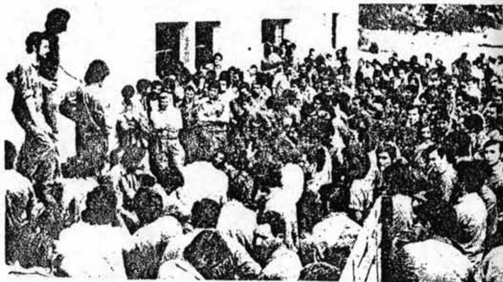
EN ESTA ETAPA LAS MASAS CONTARAN SOLO CON SU PROPIA MOVILIZACION PARA EXPRESARSE.

Todo un campo nuevo y fértil se presenta