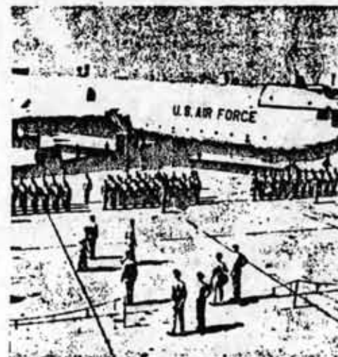
La base aérea devuelta presta gran utilidad a los yanquis para su espionaje en la zona.

La extensa frontera con Laos y Camboya es una sólida retaguardia para las fuerzas revolucionarias y la Dictadura Militar, conciente de esta ventajosa situación ha multiplicado las provocaciones a lo largo de las fronteras con ambos países. Han recluido en campos de concentración a muchos residentes vietnamitas en Thailandia e inventan todo tipo de calumnias contra los países revolucionarios