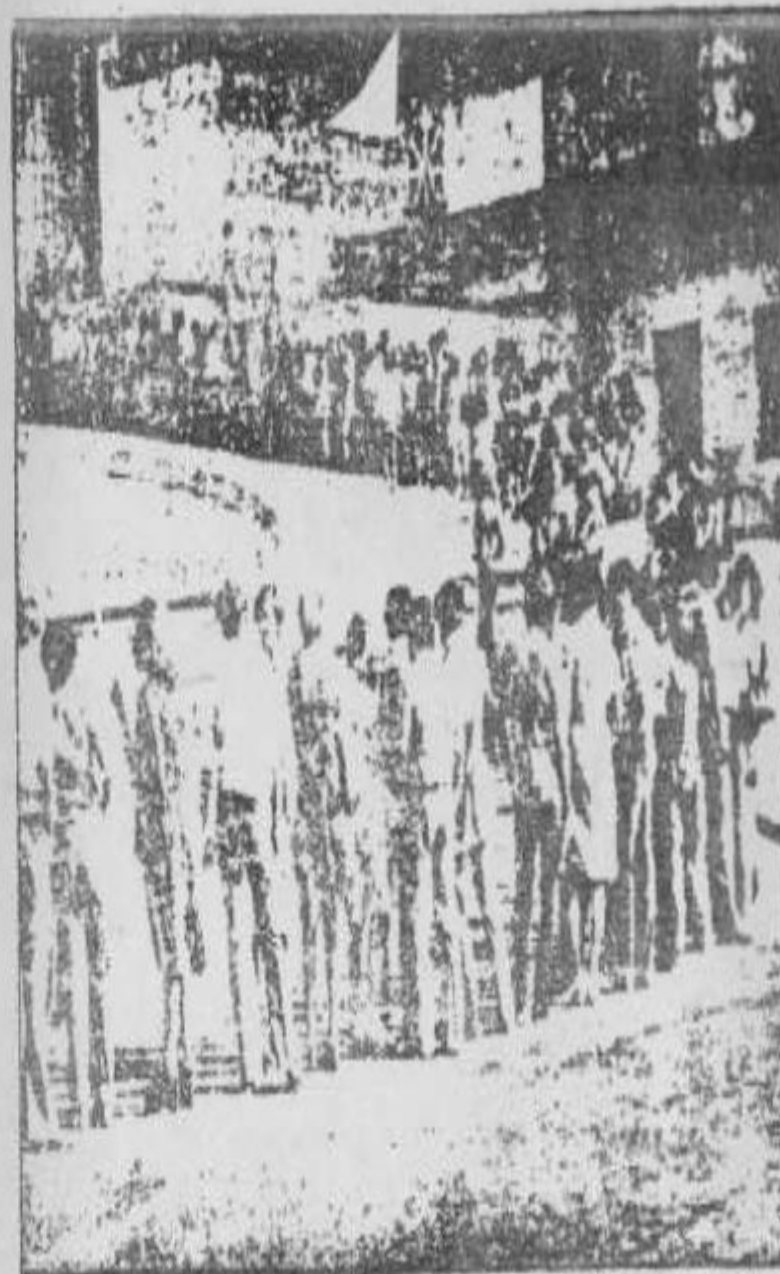
Los distintos sectores encontrarán en el Frente una herramienta de lucha.

de la lucha de clases o de quebranto económico de las clases dominantes, una fracción de las mismas, más poderosa que las otras asume la dirección del gobierno por medio de la fuerza, quebrando el orden institucional democrático-burgués.