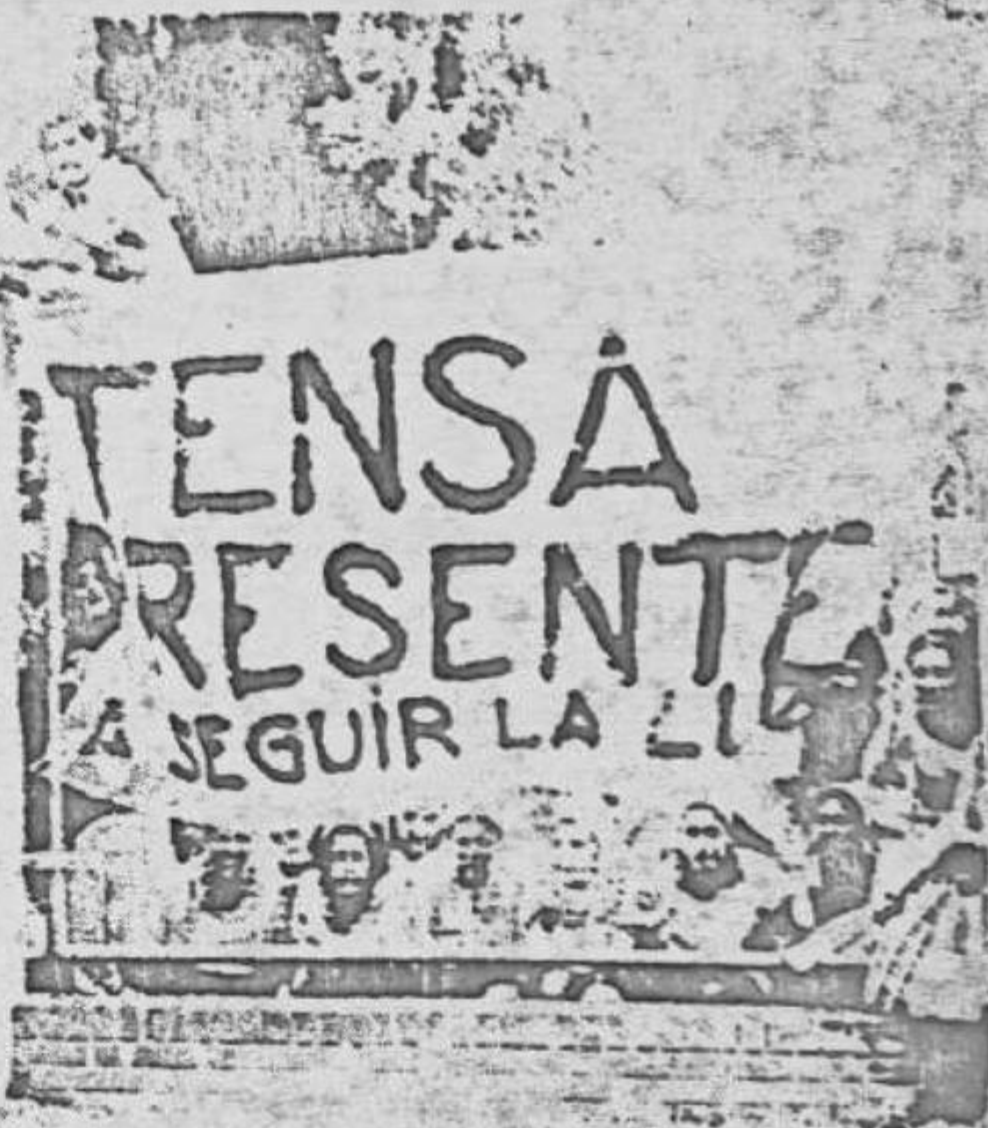
La resistencia a la Dictadura se extiende a lo largo y lo ancho de la Patria.