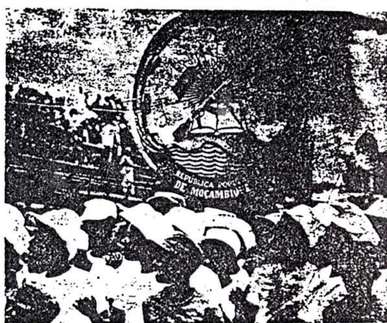
El emblema nacional y la juventud en el nacimiento de una República

El respaldo del FRELIMO a la justa causa de la liberación nacional y social de la población de Zimbabwe se