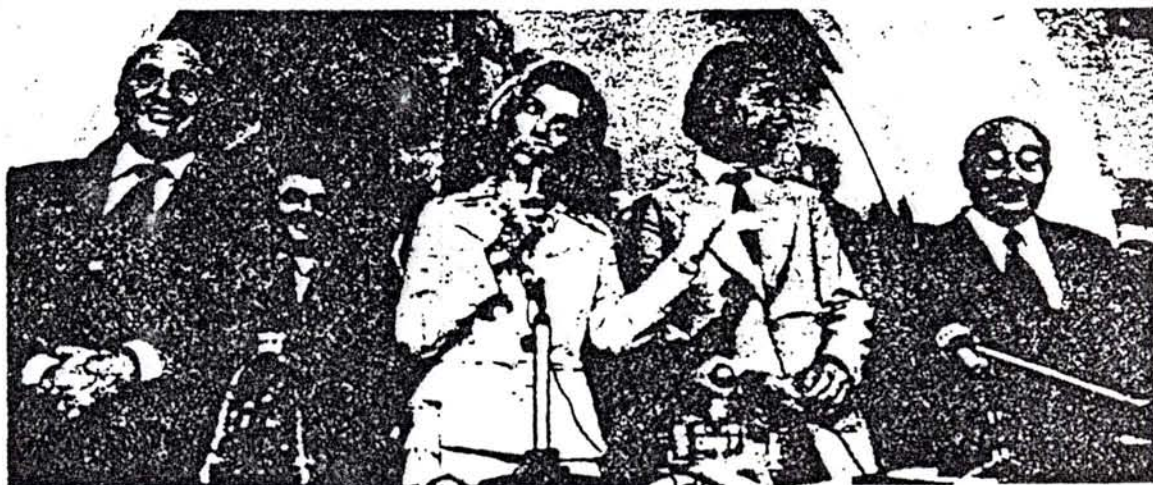
Isabel Perón hablando en la CGT. El nuevo proyecto económico solo sirve para agravar la crítica situación del gobierno que Isabel trata vanamente de ocultar tras sus bravuconadas.

La clase obrera y el pueblo, no quisieron aceptar pasivamente el papel de victimas que el plan de emergencia les reservaba / su poderosa y enérgica movilización fue una respuesta casi instantánea; esto hizo aflorar de inmediato las contradicciones dentro de la burocracia sindical. Puesta ante la disyuntiva de enfrentar a las masas movilizadas apoyando el plan como pretendía Lorenzo Miguel, o ponerse al frente de la lucha popular, lo que le hecho los enfrentaba al gobierno e incluso a las FF.AA. la burocracia se enfrascó en largas discusiones y posteriores tratativas con el gobierno. El resultado final fue la modificación parcial de las medidas de emergencia que