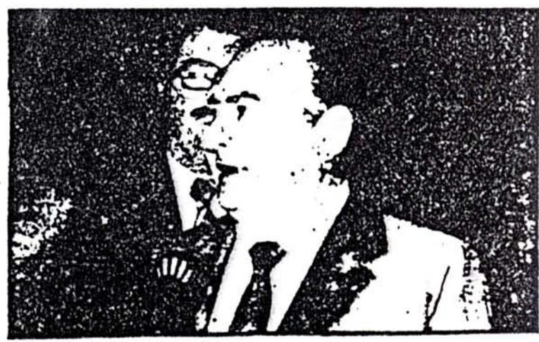
El Plan Mondelli no es más que el Plan del Fondo Monetario Internacional.

A pesar de todo esto sin embargo, nada ha logrado el gobierno cor. su amo. Lo exiguo de los préstamos otorgados por la misión económica que se trasladó a Washington en busca de los dólares con que imaginariamente el imperialismo 'retribuiría' los favores del gobierno argentino revela hasta qué punto los yanquis desconfían de las perspectivas que se abren a la burguesía y al partido en el poder para contener las luchas populares; revela en síntesis, la ineptitud total de este gobierno de aventureros y ladrones para defender incluso los intereses de sus amos.