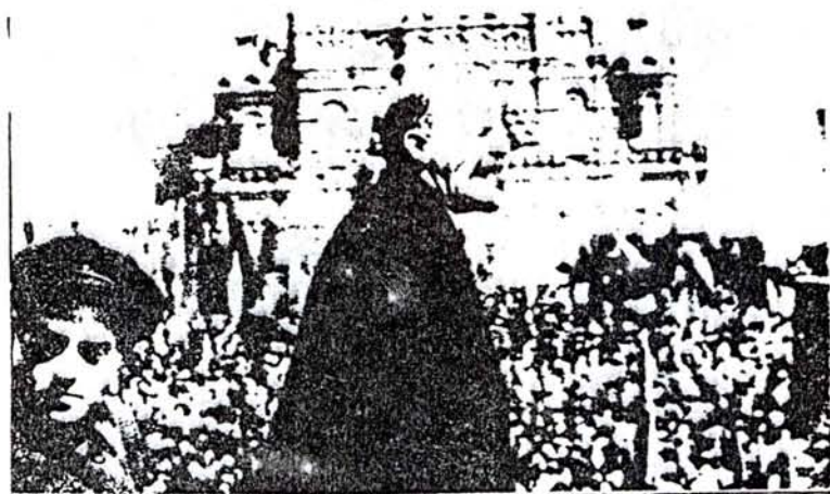
V.I. Lenin. "El periódico no es sólo un propagandista y agitador colectivo, sino también un organizador colectivo."

Grandes sectores de masas buscan con avidez una respuesta clara y concreta para sus expectativas, una guía para encauzar sus luchas y orientarlas hacia ejes correctos, una luz que disipe el manto de sombras tendido por la burguesía. Ante ese desafío es necesario que el periódico llegue a un número superior de hombres y mujeres del pueblo, a través de una campaña sistemática, realizada en base a planes concretos, que posibiliten incorporar a la tarea al conjunto del Partido. Prepararse para esa campaña es hoy cuestión de primordial importancia para los militantes partidarios y la vanguardia revolucionaria.